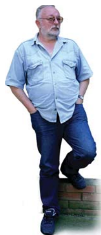
Piše: Mika Dajmak