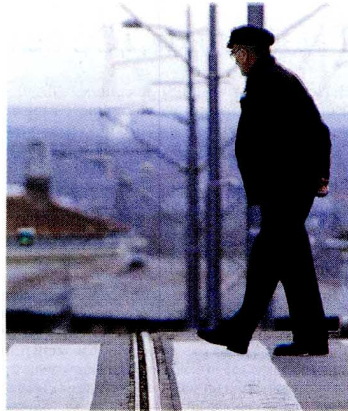
Популација све старија