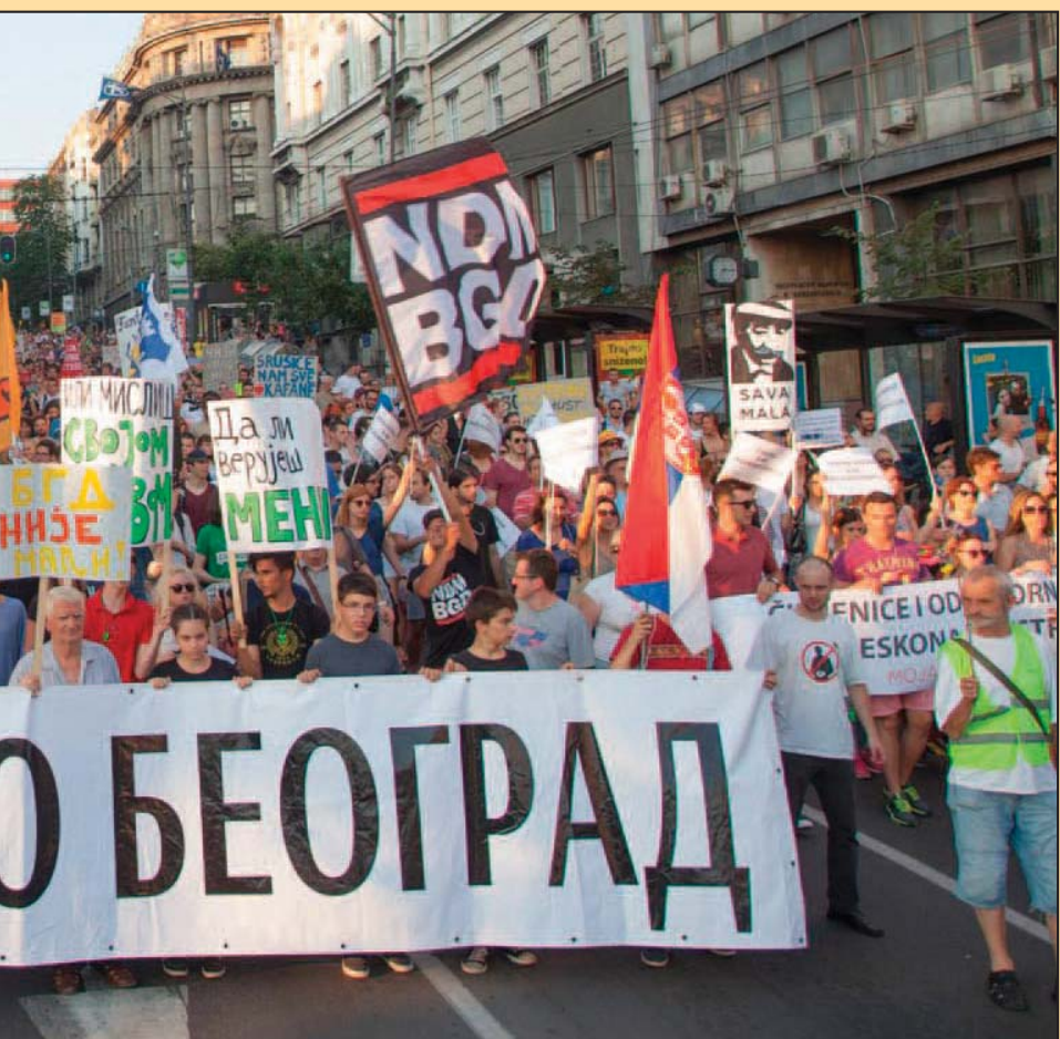
Protestna akcija pažnju Beograđana i na njima su se okupljale desetine hiljada ljudi

Grad poseduje veliki broj praznih prostora koji bi mogli biti iskorišćeni za potrebe kulture, ali i druge oblasti kao što su socijalna zaštita ili obrazovanje. Prodaja niti je jedino, niti poželjno rešenje. Zajedničke resurse treba da iskoristimo tako da odgovorimo na potrebe koje ne možemo zadovoljiti na tržištu.