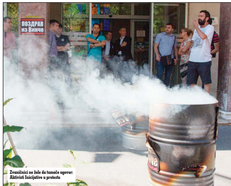
Zvaničnici ne žele da tumače ugovor: Aktivisti Inicijative u protestu

Pored finansijskog dela analiza je ukazala i na pravno-proceduralne probleme, kao što veliki broj nedostajućih delova i priloga ugovora (npr. prilozi iz kojih se izračunavaju plaćanja), i to da se gradsko pravobranilaštvo nije bavilo analizom Ugovora (jer po njihovom tumačenju prevod ugovora nije u duhu srpskog jezika, nema pečat sudskog tumača; sa drži pravne termine koji nisu u skladu sa domaćim pravom i smatra da je bavljenje opravdanošću ugovora u nadležnosti Sekretarijata za finansijske). Gradski Sekretarijat za finansijske je sa druge strane došao do zaključka da Ugovor nema uticaj na gradski budžet. Takođe u toku procesa se i desila promena sasta-