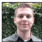
Piše: Milan Škobić

Ne smemo dozvoliti da se ovo preduzeće privatizuje samo da bi se njegovo zemljište rasparčalo, a namena promenila. Ogroman potencijal za privredu i nova radna mesta