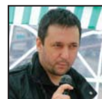
Piše: Vladimir Radojičić

Beograd će 30 godina isplaćivati investitoru minimum 38 miliona evra godišnje. Odvoženje smeća poskupljuje četiri do pet puta, ukida se mogućnost otvaranja radnih mesta u „zelenoj ekonomiji“, problemi sa zagađenjem vazduha