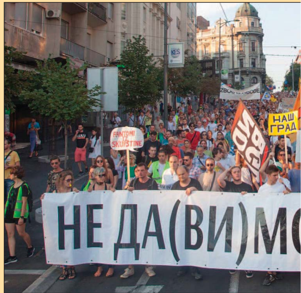
Protesti koje je organizovala Inicijativa protiv nelegalnog noćnog rušenja u Hercegovačkoj ulici privukli su najviše