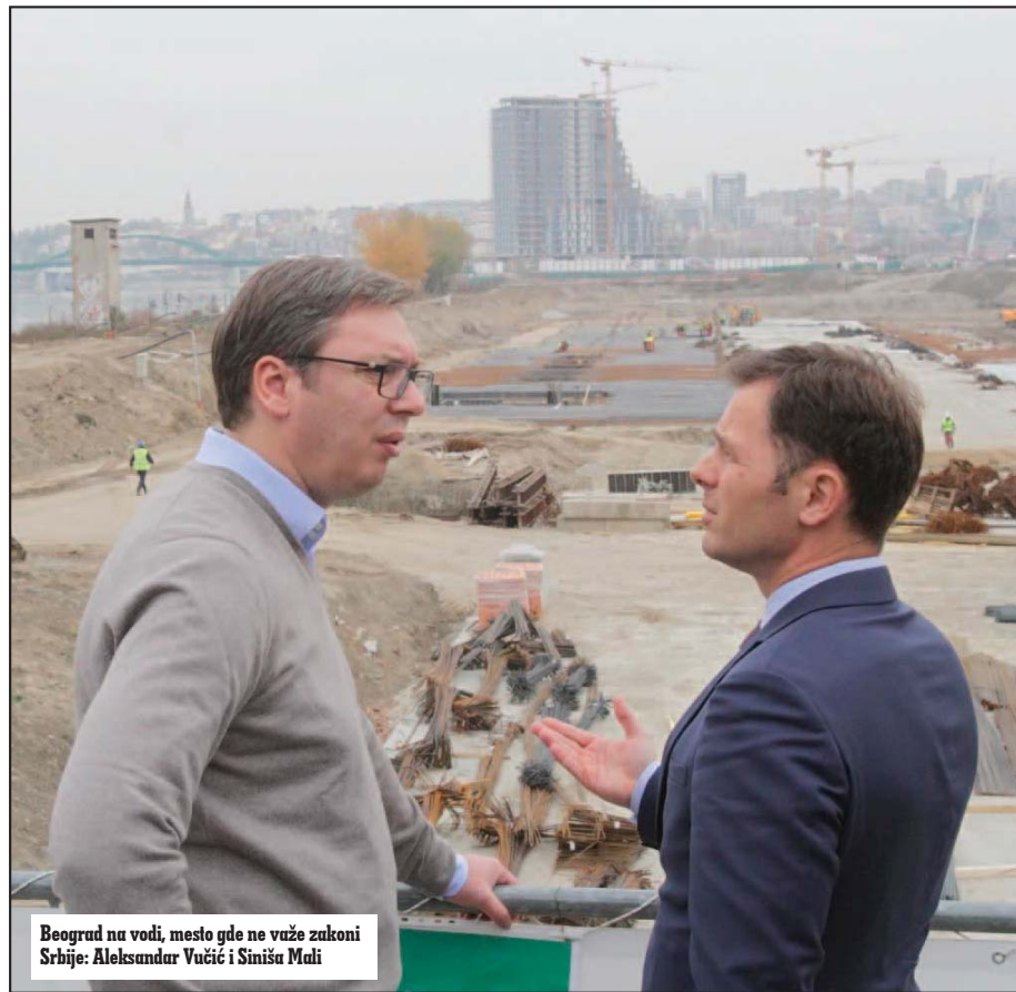
Beograd na vodi, mesto gde ne važe zakoni Srbije: Aleksandar Vučić i Siniša Mali

Inicijativa će fokus planiranja sa zarade moćnika bliskih vlasti vratiti na potrebe građana i in-