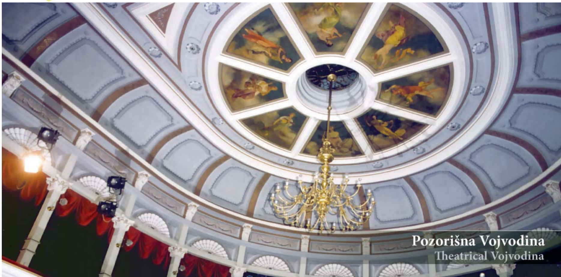
Pozorišna Vojvodina Theatrical Vojvodina