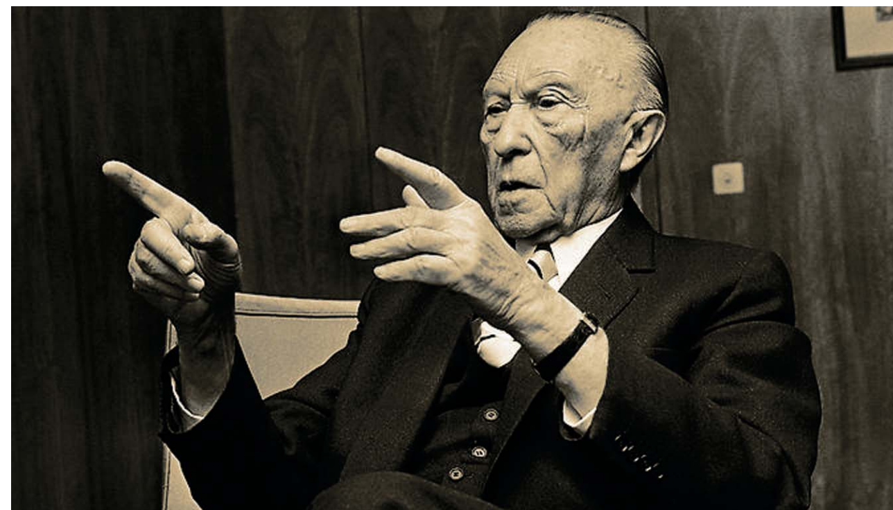
Evropska unija ima samo mirnodopske ciljeve

Naravno da za to nije dovoljno imati samo ugovore. Oni moraju zaživeti i tome pristupamo snažno i s poverenjem. Pritom, svesni smo ozbiljnosti naše situacije, na osnovu koje smo došli do evropskog ujedinjenja. Svesni smo, takođe, da naši planovi nisu sebični već da imaju u vidu dobrobit čitavog sveta.