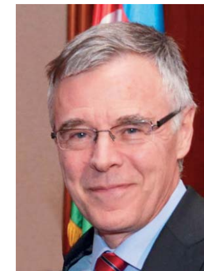
Leo D'aes, ambasador Belgije, za Danas

U uverenju da ćemo taj cilj ostvariti, za nas Nemce leži i povod za jednu posebnu nadu. Kada dode dan poput današnjeg, osetimo bol zbog toga što smo još uvek sprečeni da u ujedinjenoj Evropi učestvujemo kao ujedinjena Nemačka. No, mi ne prestajemo da se nadamo. I 17 miliona ljudi, koji su na silu odvojeni od