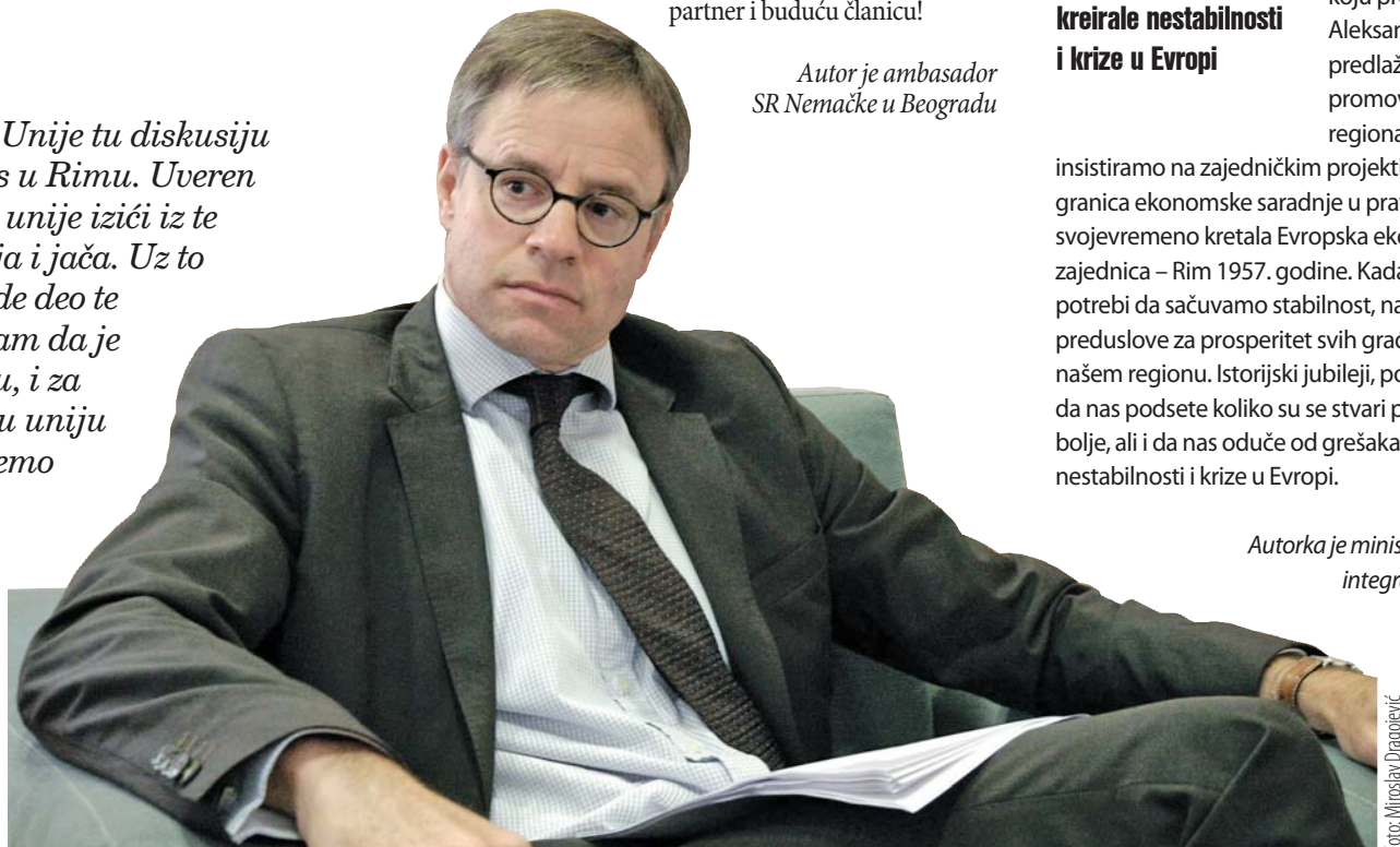
Autorka je ministarka za evropske integracije u Vladi Srbije