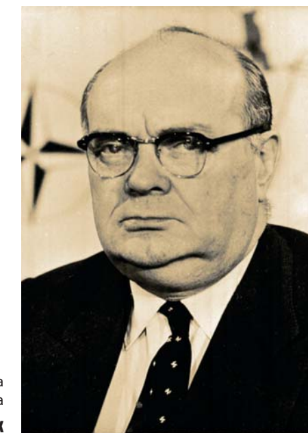
Grandiozna politička vizija Pol-Anri Spak

Potpisivanje Rimskih ugovora, pre 60 godina, uz osnivanje Beneluksa, 1944, i NATO 1949. godine, daleko je najvažniji međunarodni događaj za Belgiju od završetka Drugog svetskog rata. Kod sva tri ugovora, Pol-Anri Spak odigrao je glavnu ulogu. Predsedavajući komitetima za kreiranje ugovora, Pol-Anri Spak dao je izuzetan doprinos jednom istinski istorijskom sporazumu, kojim je grandiozna politička vizija i konstruktivna solidarnost predočena u sporazum što je uobličio glavni deo Evrope u potonjim decenijama. Ovaj dobrovoljni preobražaj regionalne politike, osmišljen u cilju obezbeđivanja prosperiteta, društvenog napretka i trajnog poštovanja za osnovne vrednosti naše civilizacije, koji su duž celog puta aktivno podržavali hrabri i vizionarski političari, jeste glavni mirovni projekat našeg doba. Ne možemo, naprosto, prenebregnuti njegov značaj, za prošle i buduće generacije, jer, uprkos nekim nedostacima, Evropska unija je remek-delo, u stalnom napretku, sa istorijskim dostignućima, na koja svi možemo da budemo neizmerno ponosni.