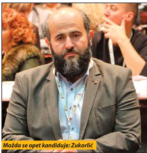
Možda se opet kandiduje: Zukorlić