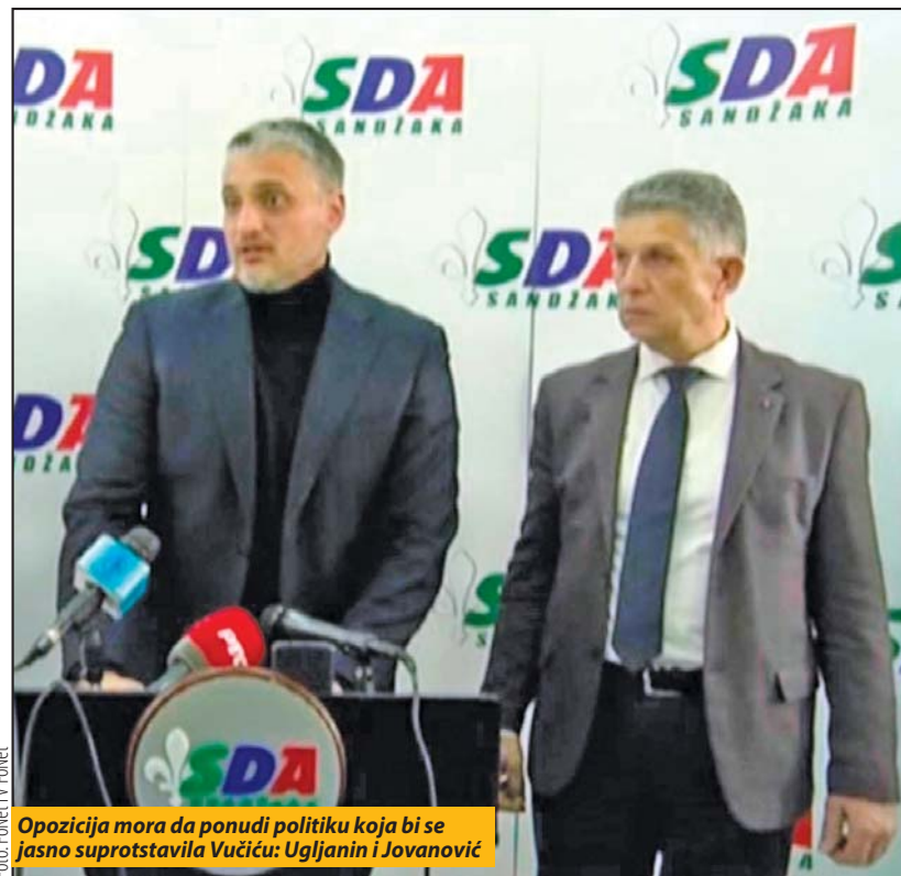
Opozicija mora da ponudi politiku koja bi se jasno suprotstavila Vučiću: Ugljanin i Jovanović

Ljajić je, kako se i očekivalo, odušao od ranije najavljene kandidature za predsednika. Na nedavnoj Skupštini beogradskog odbora SDPS, Ljajić je izjavio da Srbiji treba politička stabilnost i predsednik jake političke snage, koji će moći da sprovede reforme, ubrza proces ulaska u EU i daje podršku vladi da rešava probleme, a to je Vučić. „Naš cilj treba da bude pobjeda u prvom izbornom krugu“, poručio je Ljajić. Sigurno je da će njegov stav poštovati i Sandžačka demokratska partija, koja je deo vladajuće koalicije. Vučićevu kandidaturu su podržale još San-