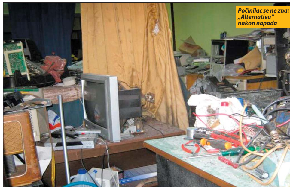
Počinioc se ne zna: „Alternativa“ nakon napada

- Kako drugačije protumačiti činjenicu da inspektor zna kako on kaže da su htjeli da me zaplaše a ne ubiju, a ako to zna, onda zna i ko je počinilac. Kako se moglo desiti inspektoru da ne tako davno u jednom od pljevaljskih kafica zaplijene automatsku pušku sa izbrisanim serijskim brojem, sa 23 metka u okviru i metkom u cijevi pokrene istragu, od osumnjičenih uzme izjave, ali zbog blokade istraga je obustavljena ili tapka u mjestu. Puška ni posle godinu dana još uvijek nije vraćena iz Forenzičkog centra u Danilovgradu, opravdano sumnjamo da između ova dva slučaja ima povezanosti i da se među njima nalazi onaj ko je pokušao da me ubije, a na koga nije podnešena krivična prijava, navodi Šljuka. On pored policije, kritikuje i rad tužilaštva, koje, kako kaže, ignoriše sve njegove zahtjeve. J. Durgut