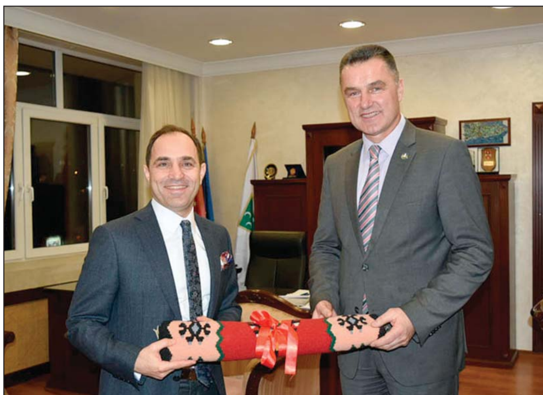
Novi turski ambasador posetio Novi Pazar