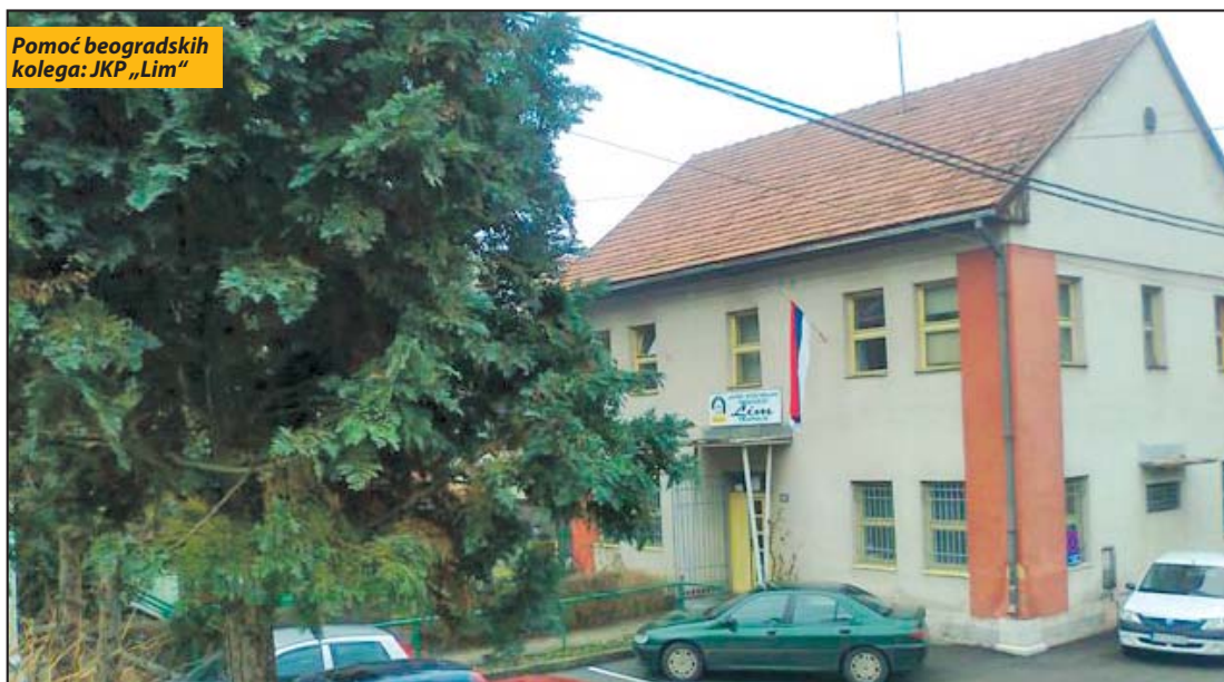
Pomoć beogradskih kolega: JKP „Lim“