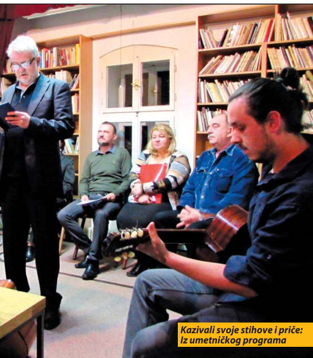
Kazivali svoje stihove i priče: Iz umetničkog programa

U svojoj prigodnoj besedi direktorka matične Biblioteke podsetila je i na, pre svega, izdavački poduhvat od pre nekoliko decenija, kada je Kulturno-prosvetna zajednica Nove Varoši publikovala „Šumove Zlatara“ - zbirku deset zavičajnih pesnika, od kojih danas većina, na žalost, nije me-