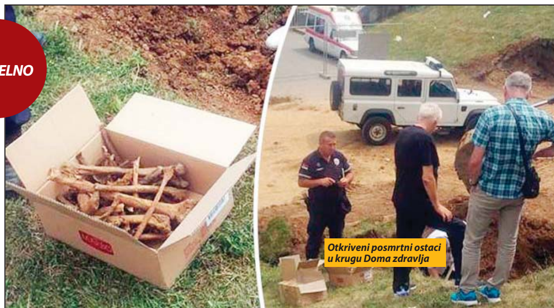
Otkriveni posmrtni ostaci u krugu Doma zdravlja