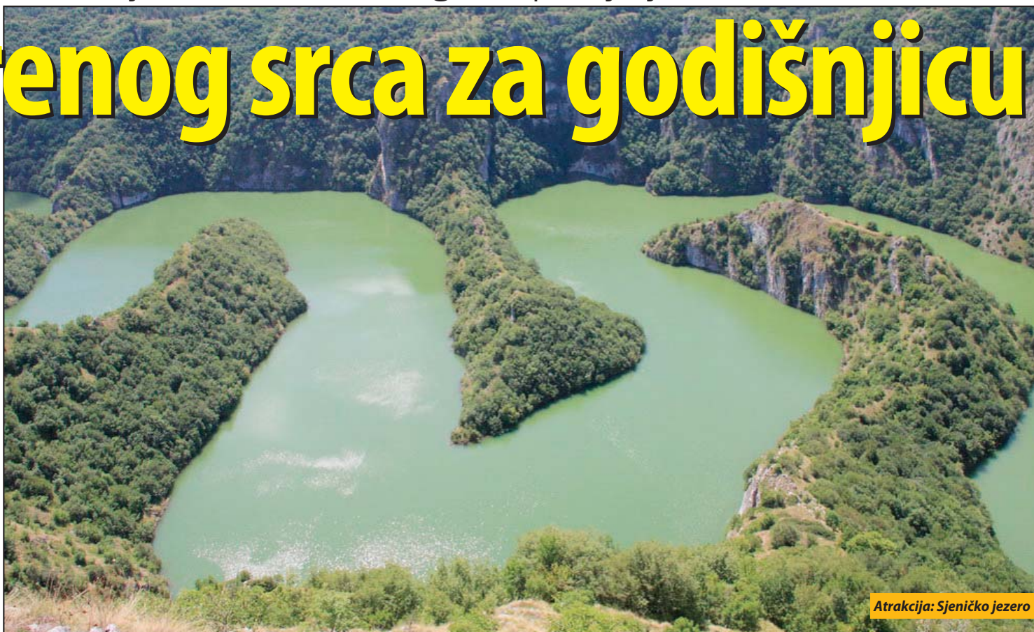
Atrakcija: Sjeničko jezero

A opština Sjenica ima šta da ponudi turistima, koji su sve brojniji. Ima četiri rezervata i parka prirode i sva su zaštićena. Specijalni rezervat prirode „Uvac“ je zaštićeno prirodno dobro od izuzetnog značaja. Nalazi se u kanjonu Uvca, na teritoriji opština Sjenica i Nova Varoš. U ovom rezervatu živi 104 vrste ptica, a najčuveniji i najveći je beloglavi sup. Najatraktivniji deo na tom prostoru je Sjeničko jezero u ukleštenim meandrima Uvca. Pored saobra-