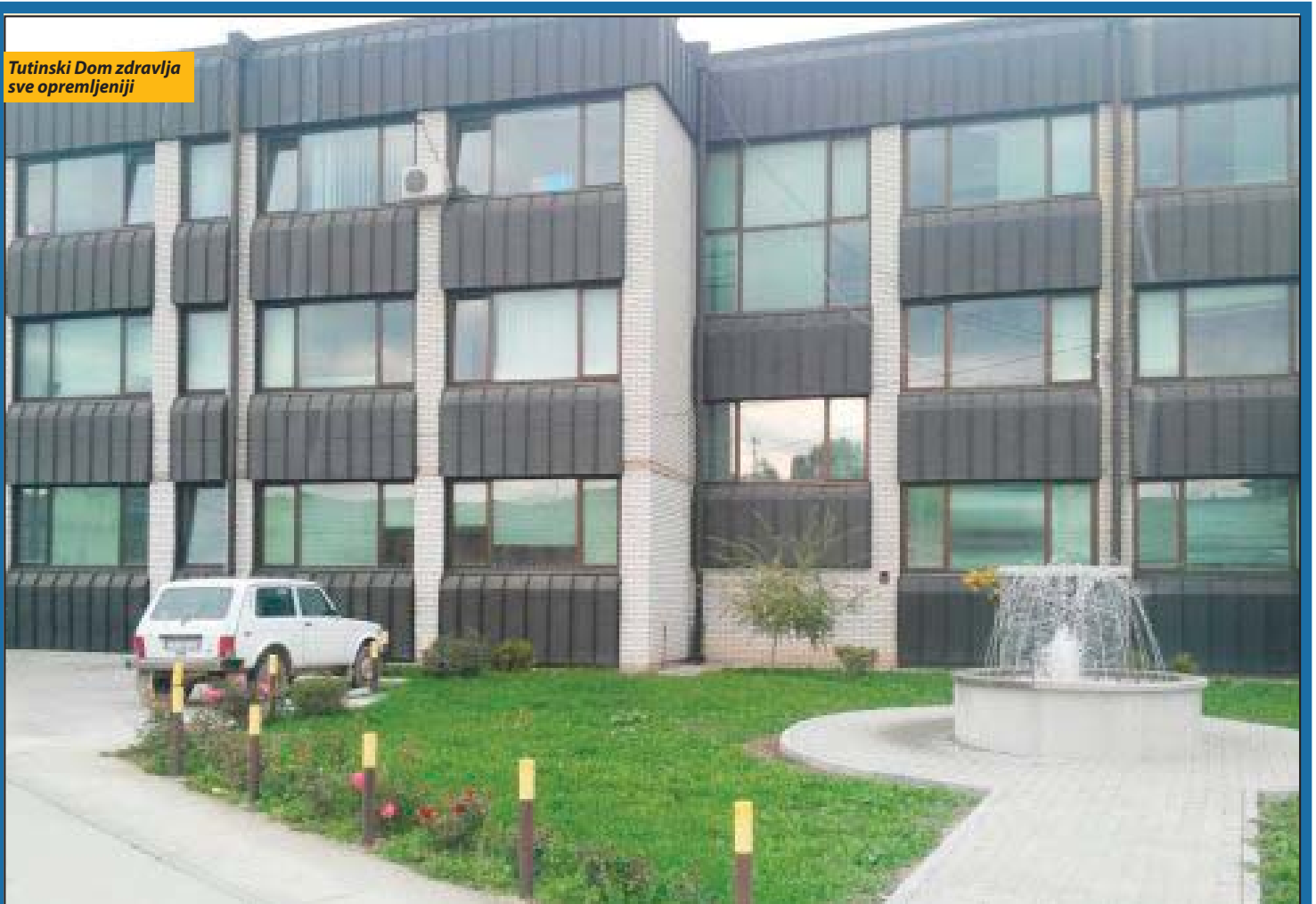
Tutinski Dom zdravlja sve opremljeniji