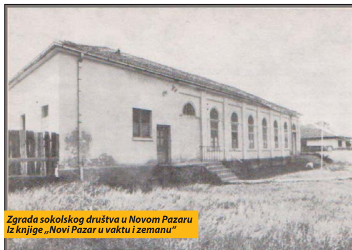
Zgrada sokolskog društva u Novom Pazaru iz knjige „Novi Pazar u vaktu i zemanu“