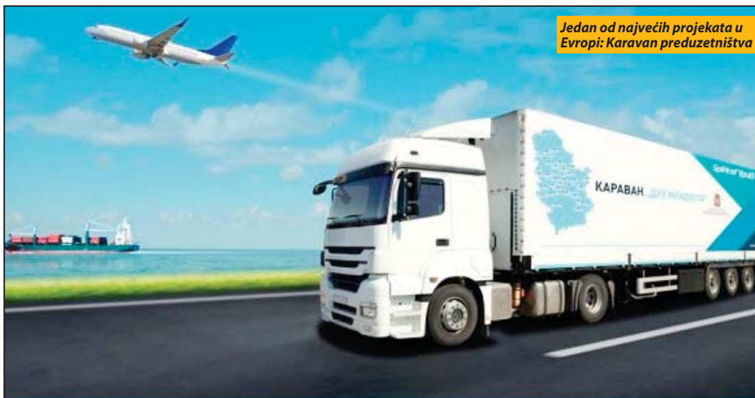
Jedan od najvećih projekata u Evropi: Karavan preduzetništva

Prvi put u Prijepolje sutra stiže Karavan preduzetništva