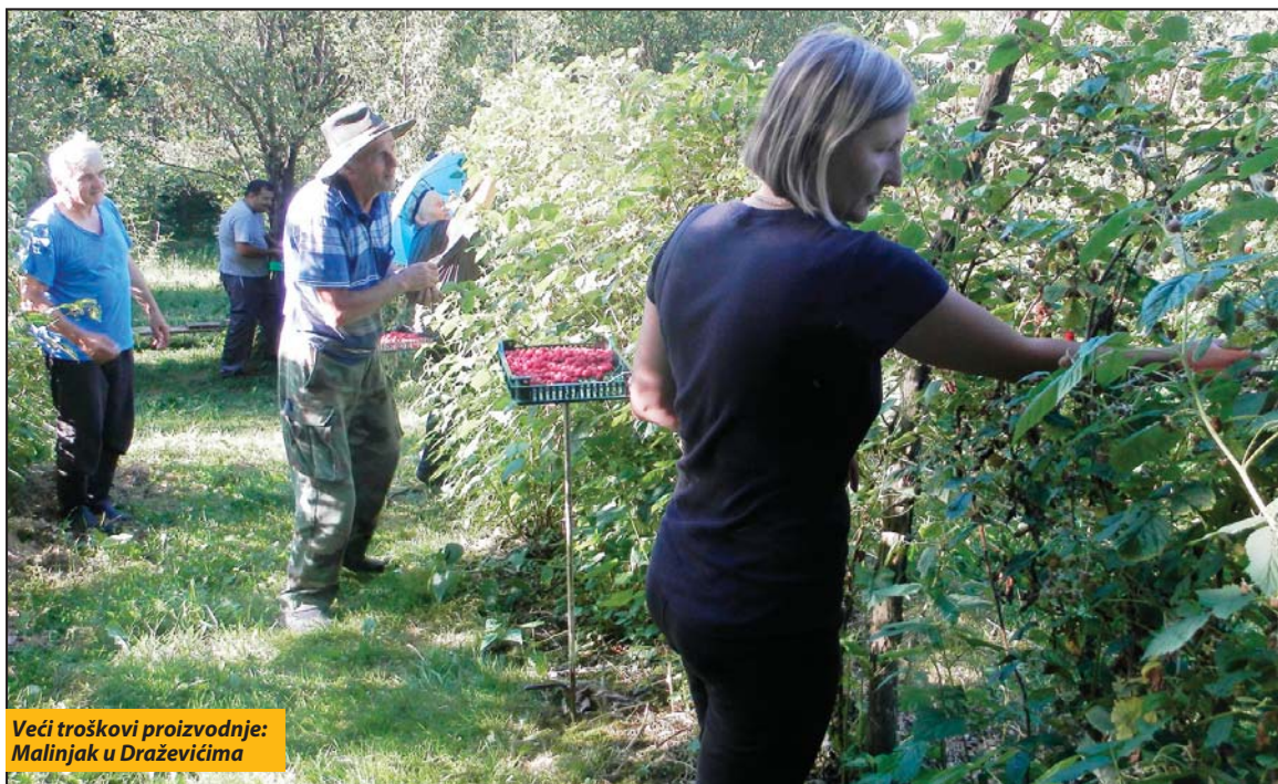
Veći troškovi proizvodnje: Malinjak u Draževićima

U novovaroškom kraju u jeku berba malina