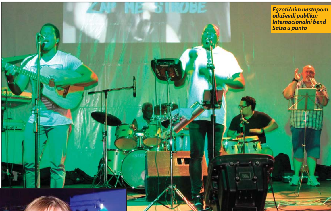
Egzotičnim nastupom oduševili publiku: Internacionalni bend Salsa y punto

Novovaroški rokeri, oni mlađi, ali i nešto stariji, sa blagonaklonošću su dočekali ponovni susret dobro poznatim užičkim bendom „Mundens“, koji je odličan nastup imalo tokom druge festivalske večeri. Bend, inače, na ovim prostorima, a i šire, uspešno deluje još od 2003. godine. Ni kiša, ni prohladno vreme nisu sprečili publiku da se dobro zabavi uz