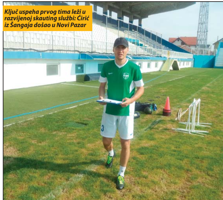
Ključ uspeha prvog tima leži u razvijenoj skauting službi: Ćirić iz Šangaja došao u Novi Pazar

-Ne, oni koji nisu stasali u toj ligi nastavljaju s igrom u omladinskoj konkurenciji. Onaj koji se istakao on mora