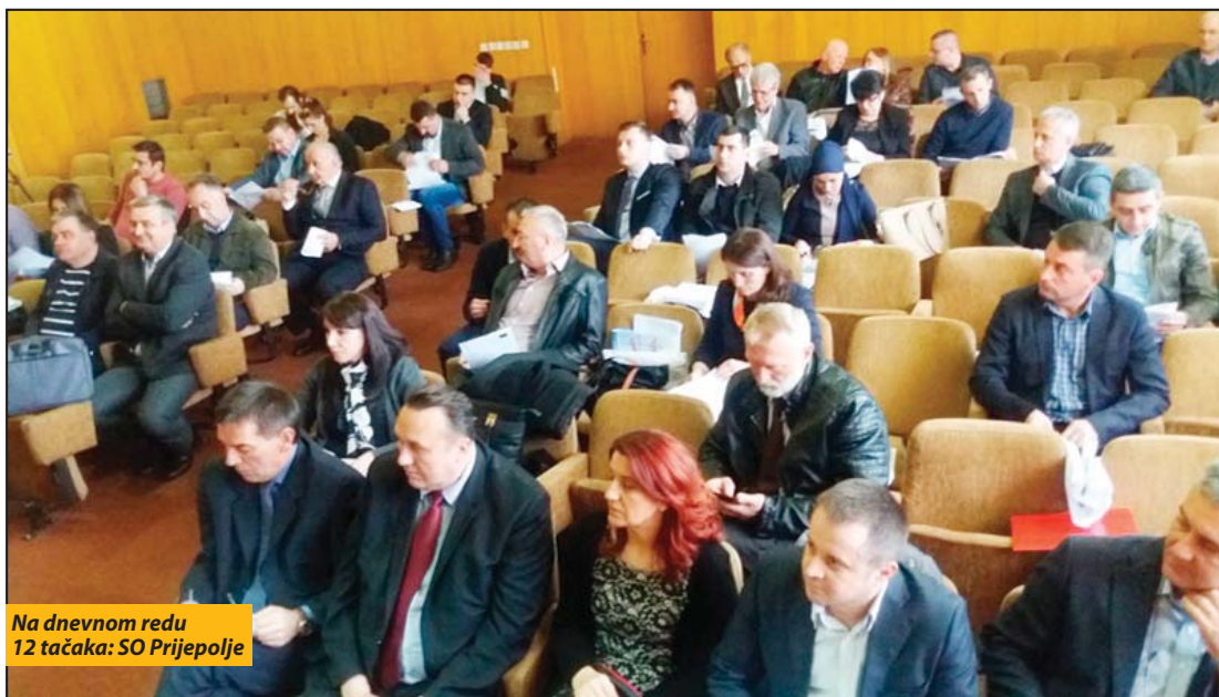
Na dnevnom redu 12 tačaka: SO Prijepolje

Upravljanje donacijama koje prima Opština Priboj, dodela sredstava iz budžeta Opštine, prostorno i urbanisti-