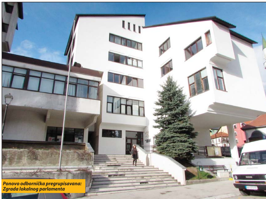
Ponovo odbornička pregrupisavana: Zgrada lokalnog parlamenta

i program formirajući novu koaliciju i vlast i u tome ne želim da učestvujem“, navodi se u kratkoj pisanoj izjavi Vesne Čkonjević medijima. „U buduću ću u lokalnom parlamentu nastupati kao samostalni odbornik, a o okviru buduće novoformirane odborničke grupe“, najavila je Čkonjević. Previranja ima i u lokalnom SNS. Od-