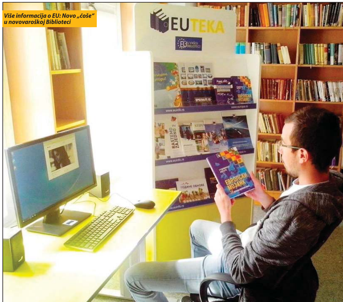
Više informacija o EU: Novo „čeoše“ u novovaroškoj Biblioteci

Nova Varoš - Biblioteka „Jovan Tomić“ u Novoj Varoši postala je nedavno deo mreže „EUTEKA“ koju čini 48 književnih riznica na području čitave Srbije. Reč je o svojevrsnim informativnim punktovima na kojima građani mogu da pronađu različite informacije o Evropskoj uniji.