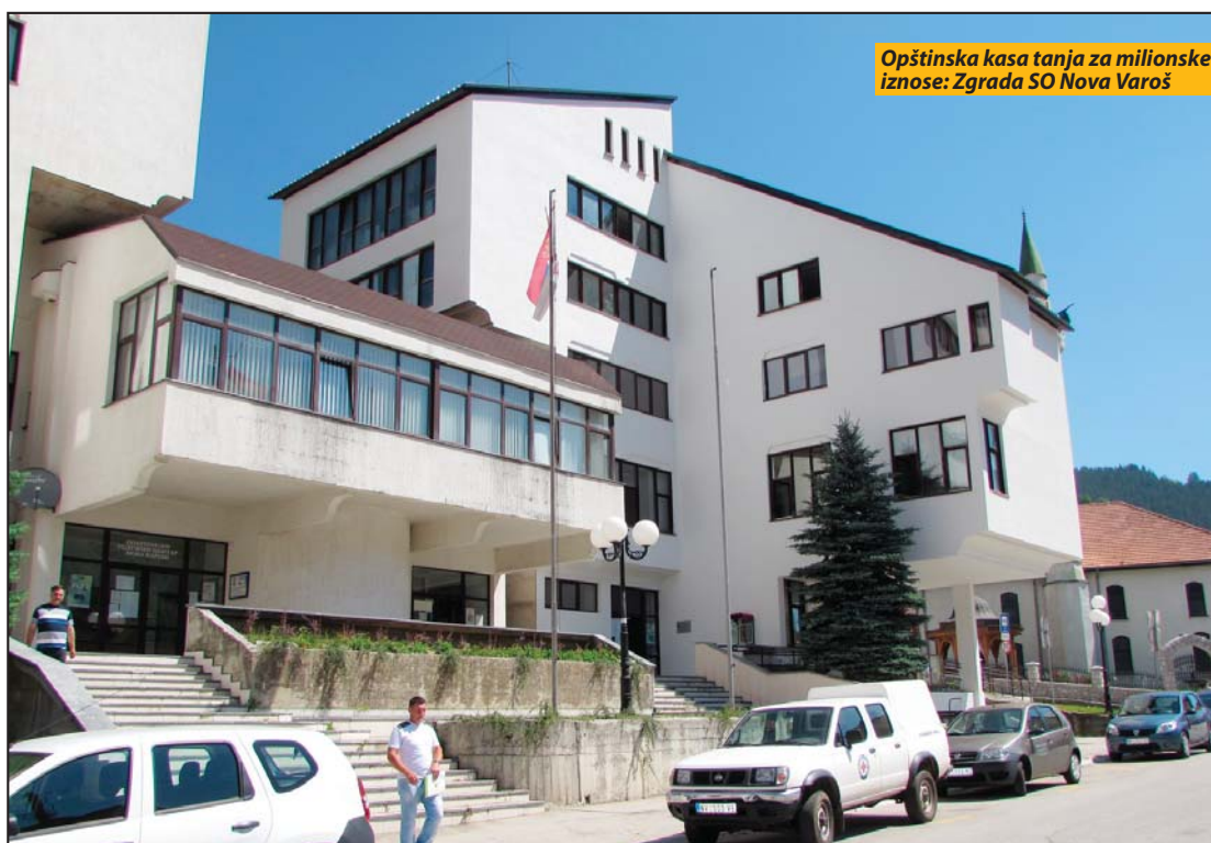
Opštinska kasa tanja za milionske iznose: Zgrada SO Nova Varoš

koliko godišnje prihadjemo po ovom osnovu. Istina je da trenutno postoje zakonske „rupe“ koje „Elektroprivreda“ onemogućavaju da uplaćuju novac za ove namene. Zakon o komunalnim naknadama jeste donesen, ali nikada nisu usvojeni podzakonski akti. Zato