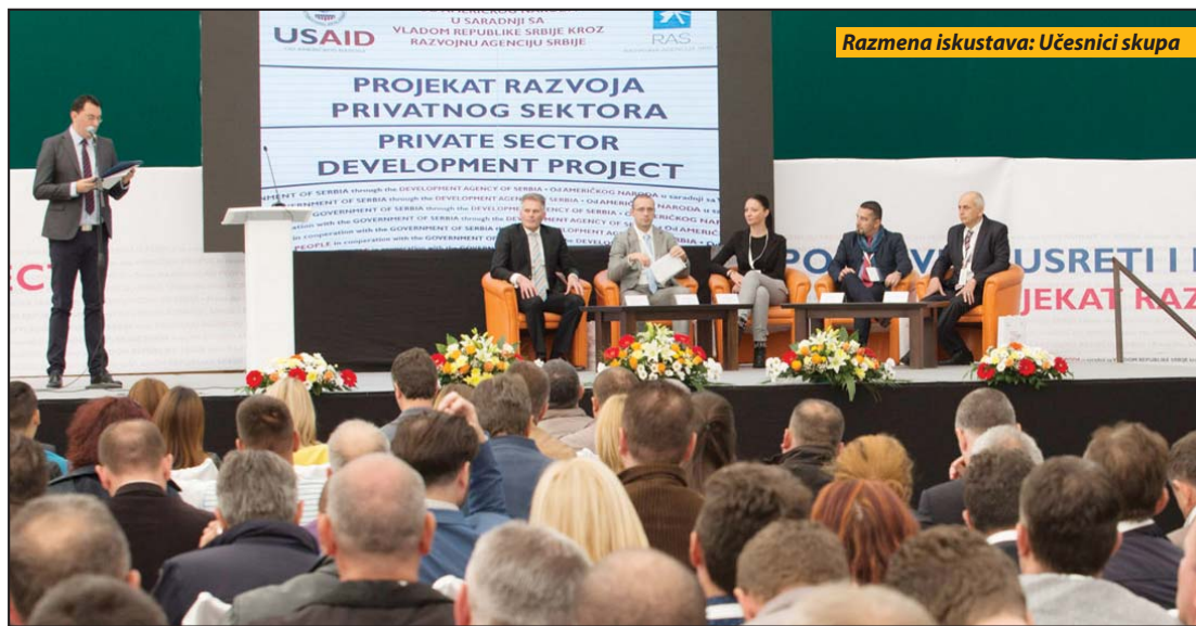
Poslovni susreti na Zlataru u organizaciji Razvojne agencije Srbije i USAID