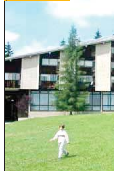
Pod ključem već sedam godina: Centar Zlatar