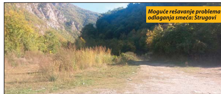
Moguće rešavanje problema odlaganja smeća: Strugovi