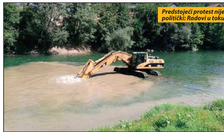
Predstojeći protest nije politički: Radovi u toku