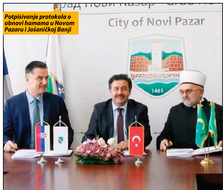
Potpisivanje protokola o obnovi hamama u Novom Pazaru i Jošaničkoj Banji