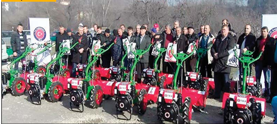
Podela motokultivatora iz donacije TIKA

- Da radimo pravu stvar dokaz je projekat iz 2015. godine kada je ubrano 30 tona maline i veoma smo zadovoljni zbog toga - naglasio je Bajrak i dodao da veruje da će proizvodnja malina biti