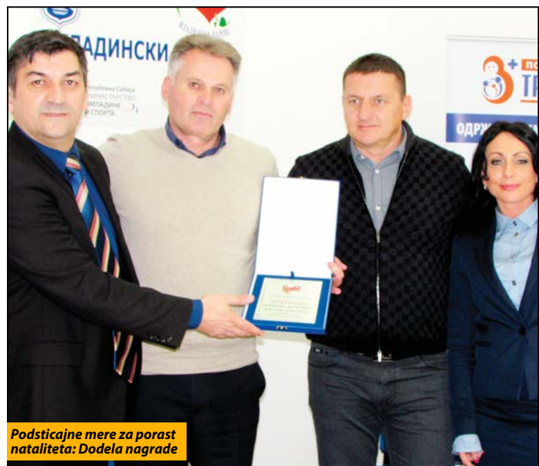
Podsticajne mere za porast nataliteta: Dodela nagrade

nje u decu nije trošak, već investicija, kao i da je to zalog za budućnost.