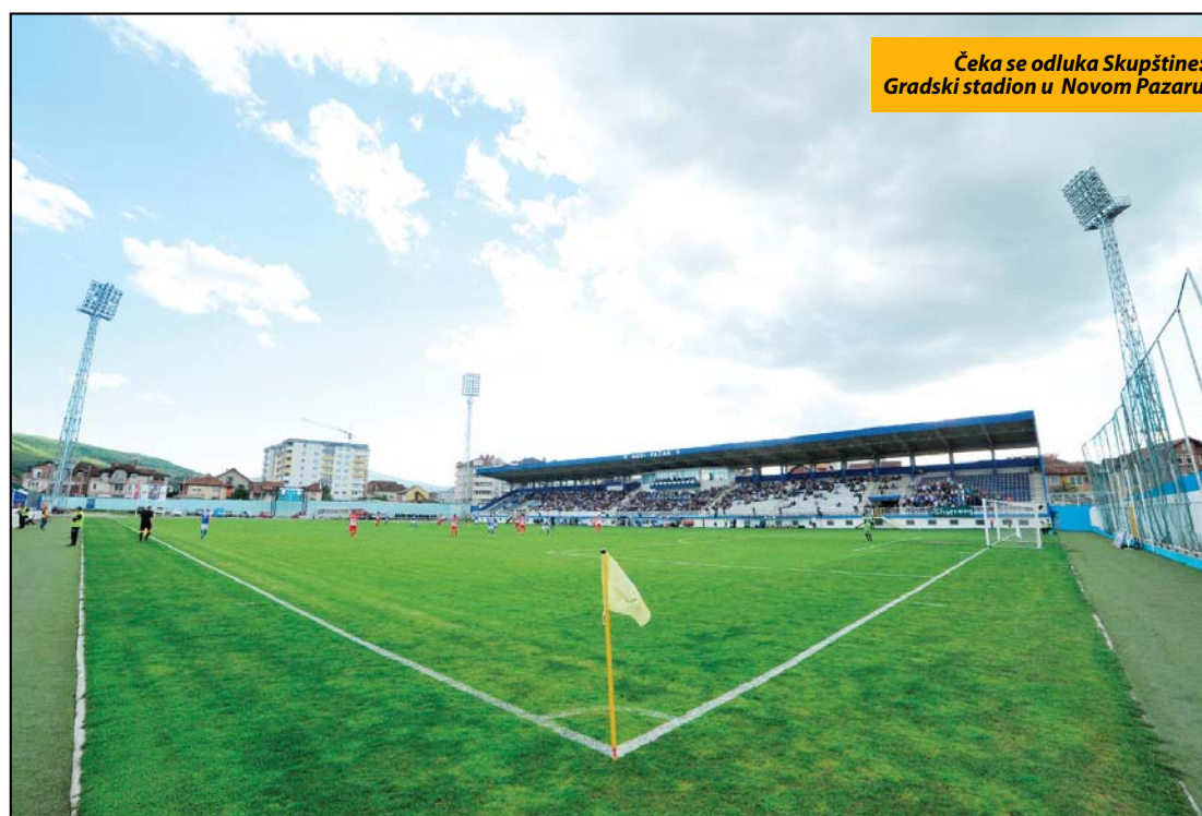
Čeka se odluka Skupštine: Gradski stadion u Novom Pazaru