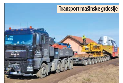
Transport mašinske grdosije

Bio je u upotrebi skoro tri decenije, od 1986. do 2014. godine. Proizveden je u fabrici „Rade