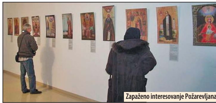
Zapaženo interesovanje Požarevljana

Gojković je govorio i o vekovnim sponama Srba i Rusa, o seobama u oba smera, istaknutim predstavnicima jed-