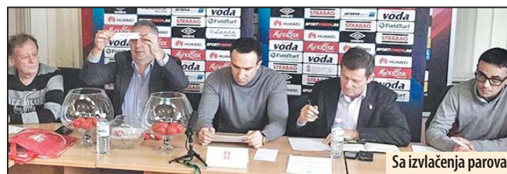
Sa izvlačenja parova

KMF Niš 92 - KMF Nova Pazova KMF Euro Motus Beograd - KMF Kopernikus Zrenjanin,