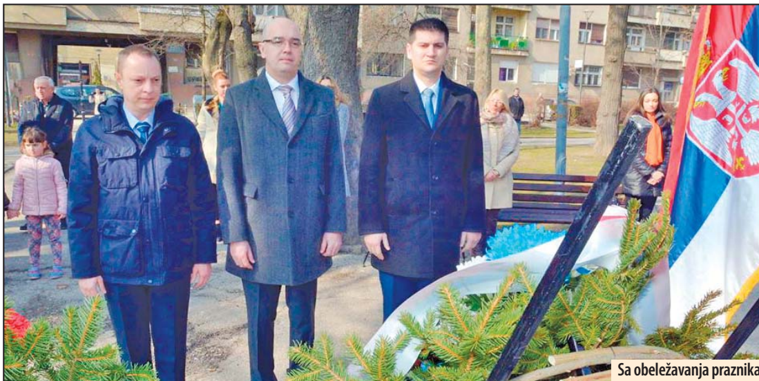
Sa obeležavanja praznika

- Dan državnosti Republike Srbije proslavljamo i u Požarevcu sa namerom da današnjem datumu, koji u sebi sadrži dva važna događaja damo poseban ton. Sretenjski ustav iz 1835. godine, i podizanje Prvog srpskog ustanka 1804. godine, važni su datumi u našoj istoriji koji nas podsećaju na tadašnju želju za slobodom Srpskog naroda ali i njegovu nameru da Srbija postane uređena država u kojoj se poštuju zakoni i sluša glas naroda. Upra-