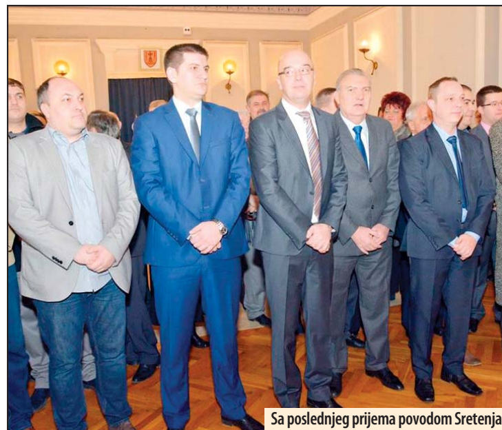
Sa poslednjeg prijema povodom Sretenja

glasnost o angažovanju eksterne revizije gradskog budžeta za 2016. godinu a odluku je potvrdio državni revizor.