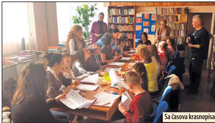
Sa časova krasnopisa

Kaligrafija je, inače, umetnost lepog pisanja koja vodi poreklo iz Kine. Savremena definicija kaligrafske veštine je „umetnost davanja forme znakovima na izražajan, harmonistički i vešt način“. Stil kaligrafije je opisan kao ruka ili alfabet. Može biti funkcionalni i ručni zapis do prefinjenih umetničkih komada, gde ručno pisani tragovi uzimaju pr-