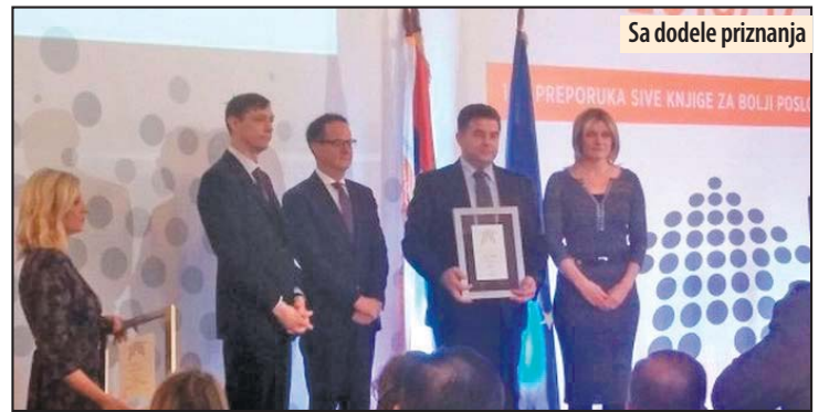
Sa dodele priznanja

■ Visina subvencije koja se isplaćuje jednokratno iznosi 180.000 dinara, za tehnološke viškove je predviđeno 200.000, dok će po 220.000 dobiti osobe sa invaliditetom