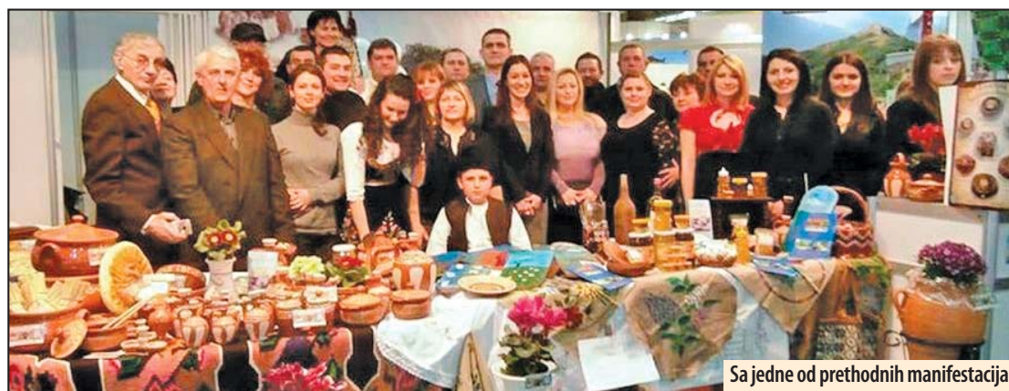
Sa jedne od prethodnih manifestacija

Prezentacija će biti održana u Velikoj konferencijskoj sali (hala 4 Beogradskog sajma), sa početkom u 11 sati i 30 minuta, a druženje se nastavlja tradicionalnim, prigodnim koktelom na štandu opštine Veliko Gradište gde će posetioci imati priliku da vide nove propagandne materijale, suvenire bazirane na etnografskoj građi kao i da okušaju specijalitete ovog dela Podunavlja. Z. V.