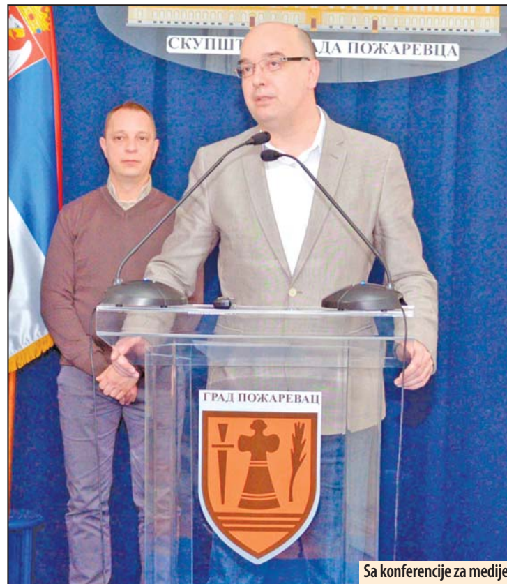
Sa konferencije za medije

koji je mnogo dao pozorištu jeste umetnik čiju veličinu, utisak je, ne shvataju mnogi, uključujući tu i pojedine sugrađane. Ipak, u odnosu na 1995, situacija se mnogo popravila a za to, čvrsto sam uveren, najveću zahvalnost dugujemo upravo ovom festivalu. Želeo bih da čestitam zaposlenima u ovoj kući, sadašnjim i prošlim, koji su sa velikom pažnjom postavljali selektore a koji su svojim odabirom iz godine u godinu pred domaću publiku doveli vrhunske predstave i nadahnute glumačke veličine. Još jedna vrednost ovih glumačkih dana je što su one, po mom mišljenju, generator i ostalih