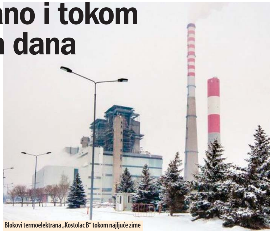
Blokovi termoelektrana „Kostolac B“ tokom najljuće zime

Ima problema zbog izuzetno nepovoljnih vremenskih uslova, ali ih prevazilazimo i ostvarujemo proizvodne ciljeve. Uveli smo i vanredne mere i dežurstva. Sve pohvale idu na račun zaposlenih, koji su lane ostvarili rekordnu proizvodnju, a koji su i tokom praznika i ledenih dana dali svoj maksimum u