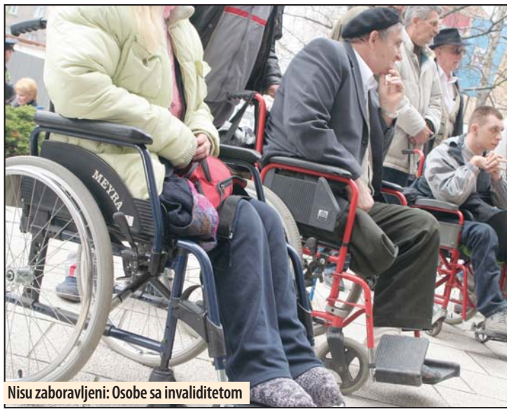
Nisu zaboravljeni: Osobe sa invaliditetom

Pravo učešća na konkursu imaju udruženja koja su od javnog interesa za Grad Požarevac u oblasti zaštite lica sa invaliditetom pod uslovom da sprovedu aktivnosti ili da im je sedište na teritoriji Grada Požarevca, kao opštinske ili međuopštinske organizacije. Predlog projekta podnosi se na datum obrascu za pisanje predloga projekta koji je u skladu sa ciljevima konkursa. Osnov za definisanje prioriteta konkursa je Lo-