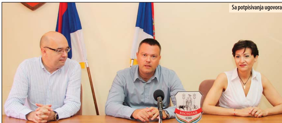
Sa potpisivanja ugovora

U Kostolcu potpisan trojni ugovor o javnim radovima