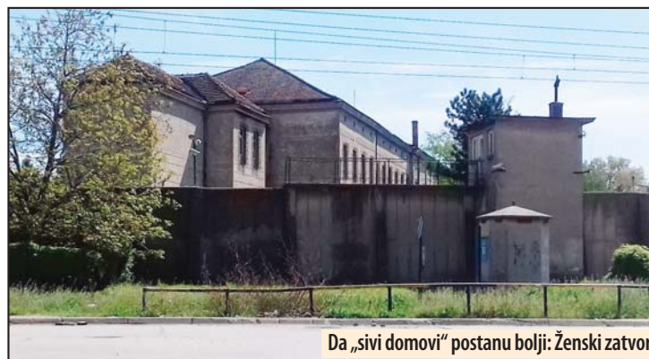
Da „sivi domovi“ postanu bolji: Ženski zatvor

Od 2. do 6. avgusta u Požarevcu se održava Festival ulične umetnosti