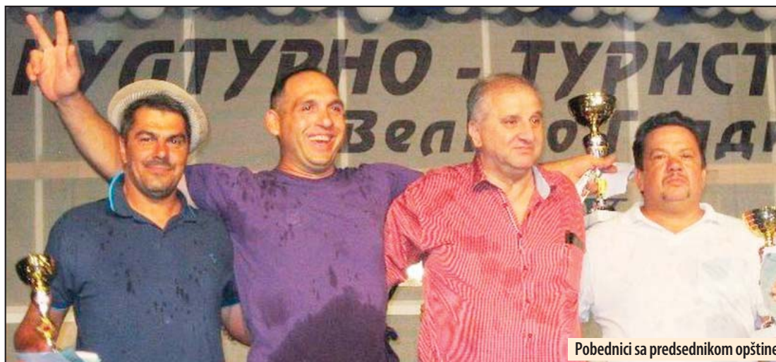
Pobednici sa predsednikom opštine

Hit Radio 104.9 FM @hitradio1049 www.hitradio.rs