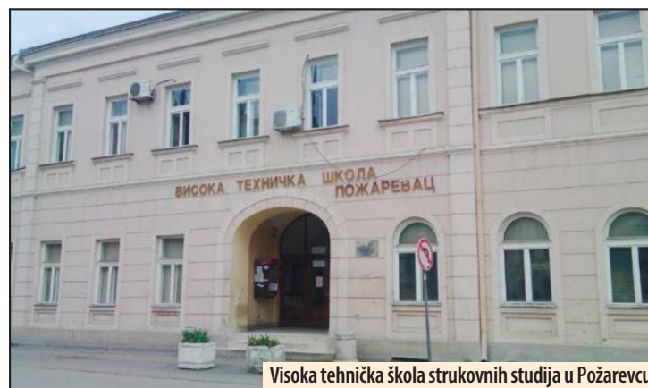
Visoka tehnička škola strukovnih studija u Požarevcu

Prijavljivanje kandidata za drugi upisni rok biće od 1. do 4. septembra. Kandidati mogu da biraju oblast iz koje će polagati prijemni ispit: matematiku, hemiju ili biologiju, u zavisnosti od toga koju oblast žele da studiraju, a polaganje će biti organizovano 5. septembra. Nakon objavljivanja konačne rang liste, upis kandidata će se obavljati od 11. do 15. septembra. Školarna za samofinansirajuće studente iznosi 55.000 dinara. Prva rata od