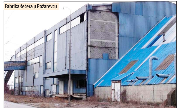
Fabrika šećera u Požarevcu

Udruženje penzionera je po posebnom projektu od Grada iz budžeta dobilo 400.000 dinara za nabavku 30 aparata za signalizaciju i hitne intervencije. Aparate će dobiti penzioneri koji su sami i bespomoćni i pritiskom na dugme u teškim situacijama aktiviraće specijalizovanu firmu „Kontakta“, koja odmah interveniše u takvim slučajevima, zove Hitnu pomoć ili bilo koju ustanovu da pomogne.