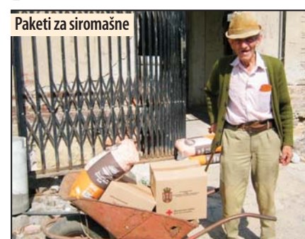
Paketi za siromašne

- Spiskovi korisnika sačinjeni su u saradnji sa mesnim zajednicama, Lokalnom samoupravom i Centrom za socijalni rad. Pomoć će dobiti porodice sa više dece; porodice koje imaju invalidno lice, ugrožene porodice iz udaljenih seoskih sredina, samohrana staračka do-