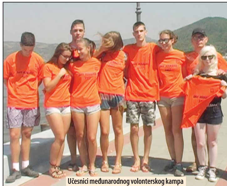
Učesnici međunarodnog volonterskog kampa