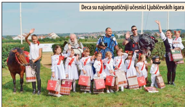
Deca su najsimpatičniji učesnici Ljubičevskih igara