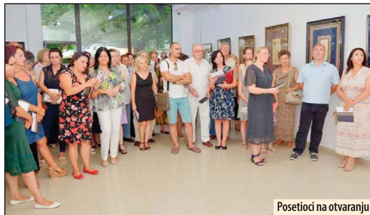
Posetioci na otvaranju

Po njenim rečima, Violeta danas hoda stazama savremene kaligrafije