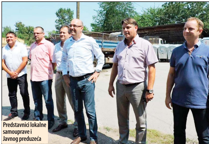
Predstavnici lokalne samouprave i Javnog preduzeća

Grad Požarevac je preko Fonda za zaštitu životne sredine izdvojio značajna sredstva od 22 miliona dinara za Javno komunalno preduzeće „Komunalne službe“ Požarevac. Grad će tako, će do kraja nedelje, imati 100 manjih kontejnera kapaciteta od jednog kubnog metra i 30 kontejnera od po 5 kubika. Novi kamion smečar od 15 kubika koji će, takođe, znatno doprineti kvalitetu usluga JKP „Komunalne službe“ Požarevac, biće nabavljen tokom tekuće sedmice. Inače, Grad je i prošle godine izdvojio