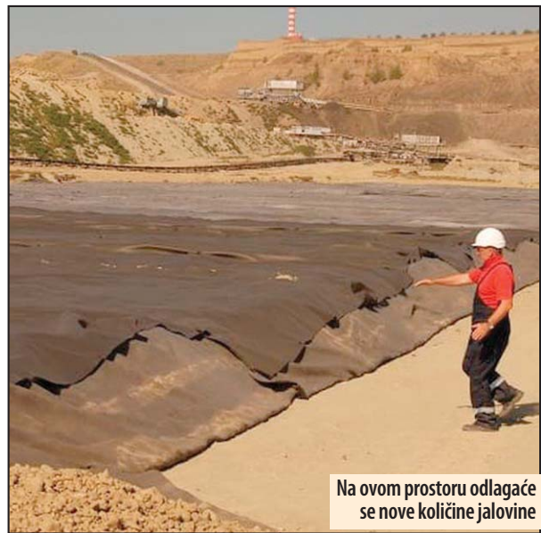
Na ovom prostoru odlagalice se nove količine jalovine

Radovi su izvedeni na prostoru dimenzija 100 sa 300 metara. Prvo je skinut sloj materijala debljine jednog metra, a nakon toga su počela bušenja i postavljanje drenova. Drenažni sistem se sastoji iz vertikalnih drenova ispunjenih šljunkom, a od objekata horizontalne drenaže izgrađena su 24 kanala, u koje su postavljene cevi određenog prečnika, drenažni kolektor, drenažni odvodni kanal