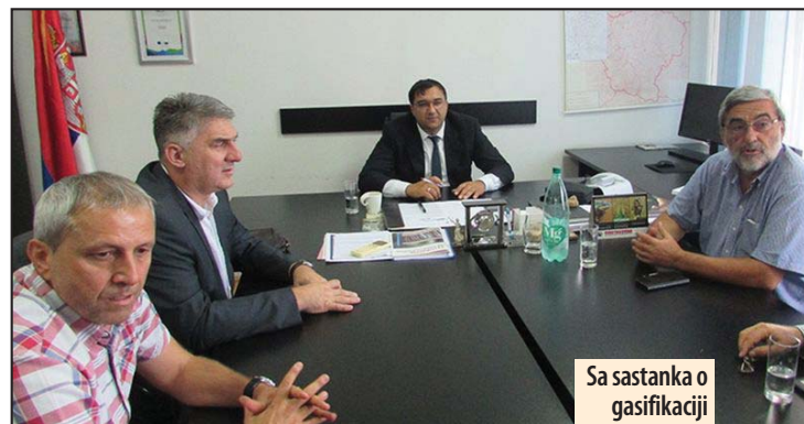
Sa sastanka o gasifikaciji

Kako je konstatovano, do sada je realizovano sve što je planom bilo predviđeno - izvođenje 46 kilometara