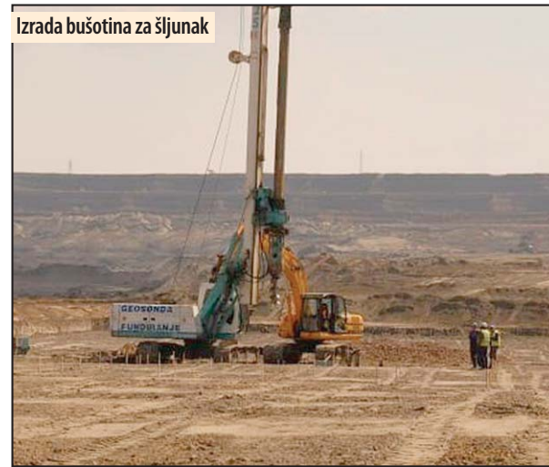
Izrada bušotina za šljunak