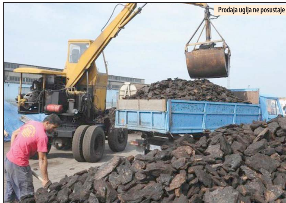
Prodaja uglja ne posustaje

Završena izgradnja drenažnog sistema na kopu „Drmno“