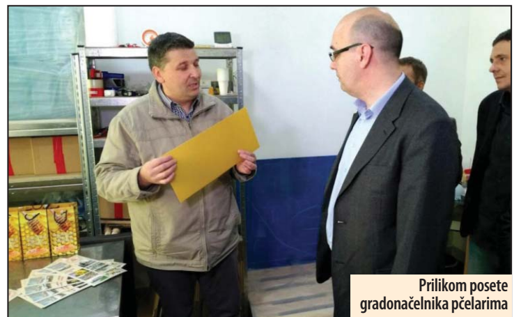
Prilikom posete gradonačelnika pčelarima

Kako kaže, u SPOS-u procenjuju da bi dobijanje domaćinstva ovog Kongresa preporodilo srpsko pčelarstvo, u privrednom i marketinškom smislu. Kompletna prezentacija Srbije koju SPOS sprovodi, svakako će izuzetno doprineti daljoj promociji srpskog pčelarstva, koje već ima značajnu reputaciju u svetu stečenu poslednjih godina a sada će ona biti i značajno poboljšana. Z. V.