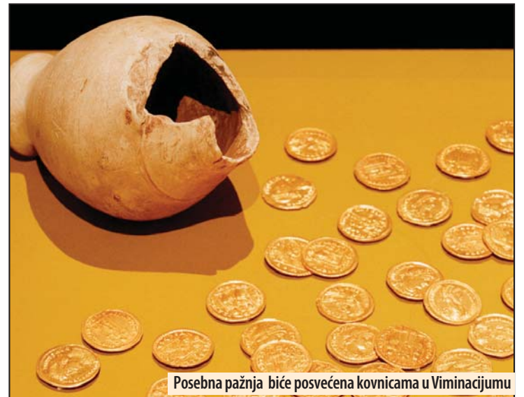
Posebna pažnja biće posvećena kovnicama u Viminacijumu

Veliko Gradište - Treći festival amaterskih pozorišta simboličnog naziva „Štap i kanap“, pošto se predstave pripremaju i izvođe upravo u takvim okolnostima, biće održan po treći put u Velikom Gradištu od 20. do 23. septembra. Varoš pored Dunava biće domaćin brojnim ljubiteljima pozorišne umetnosti, a mesto događanja biće scena Kulturnog centra koji je i organizator Festivala. Učestvuju pozorišta koja su uložila minimalna sredstva u svoje projekte. Popularni ŠIK je manifestacija takmičarskog karaktera sa vrednovanjem i rangiranjem predstava, a najboljima će biti uručene slikovite i nesvakidašnje nagrade. Z. V.