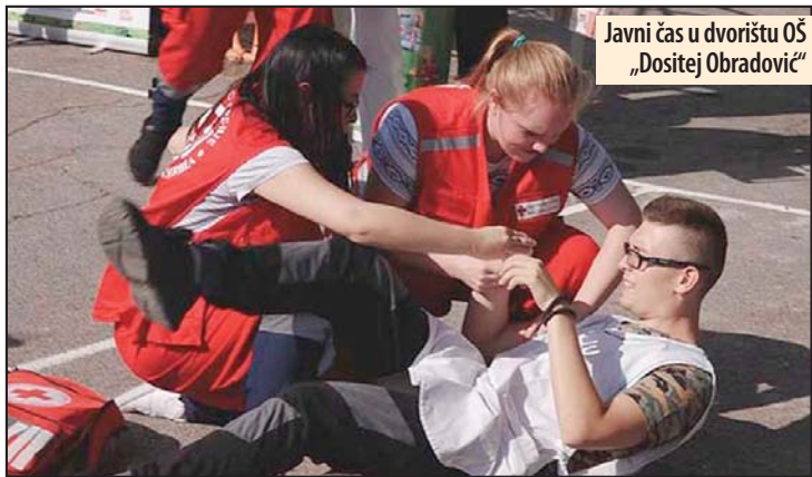
Javni čas u dvorištu OŠ „Dositej Obradović“

Crveni krst edukuje decu za pružanje pomoći ugroženima