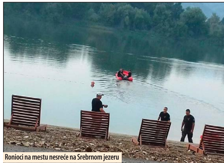
Ronioci na mestu nesreće na Srebrnom jezeru

Oni su optuženi za teško delo protiv opšte bezbednosti, za koje zakon propisuje kaznu od jedne do osam godina zatvora. Pošto budu dobili pisani otpisak presude, sve strane u ovom postupku imaju pravo podnošenja žalbe. Direktor škole i školski trener bili su optuženi jer nisu vodili računa o bezbednosti osnovaca koje su doveli na fudbalsku utakmicu u Veliko Gradište, a supružnici iz Niša jer su pedaline iznajmili maloletnicima bez