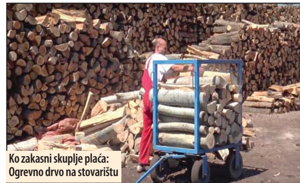
Ko zakasni skuplje plaća: Ogrevno drvo na stovarištu

„Slaviša Ivković: Kao i prethodnih godina i ove ću se grejati na uglj, dok će mi za pot-