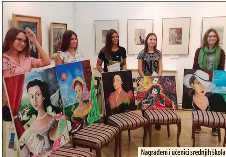
Nagrađeni i učenici srednjih škola

U okviru Kolonije, Udruženje likovnih umetnika „Milena Pavlović Barili“ realizovalo je i deo humanitarnog projekta „Požarevac u srcu“. Izložba dela namenjenih prodaji u humane svrhe biće organizovana 19. septembra u požarevačkom Centru za kulturu, a potom i aukcija 28. septembra. Z. V.