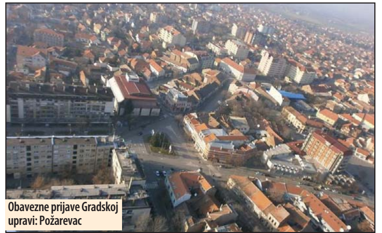
Obavezne prijave Gradskoj upravi: Požarevac

IZLOŽBA PASA NA HIPODROMU Požarevac - Na hipodromu u Požarevcu 17. septembra održava se Međunarodna izložba pasa svih rasa, sedma po redu, u organizaciji Kinološkog udruženja „Stig“. Uvođenje pasa na hipodrom počinje u 8 sati, a dva sata kasnije sledi otvaranje izložbe i ocenjivanje učesnika od strane desetero sudija. Proglašenje pobednika i dodela priznanja zakazani su za 14 sati. M. V.