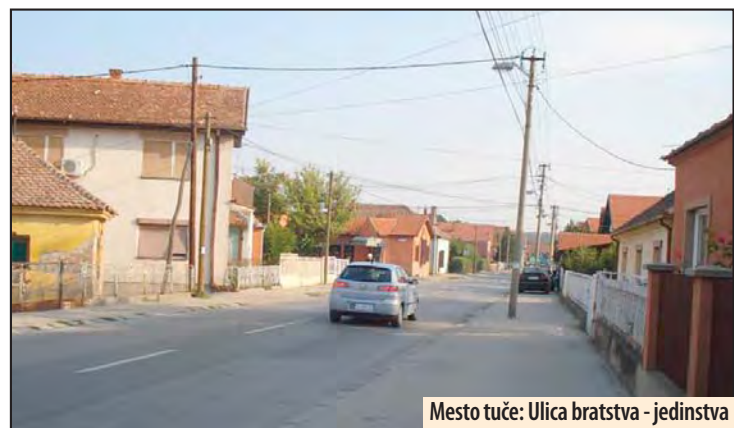
Mesto tuče: Ulica bratstva - jedinstva

onda u potiljak, a kad sam pao nastavili su da me tuku. Onda su otišli, ali se jedan vratio i opet me udario. Ubrzo je stigla