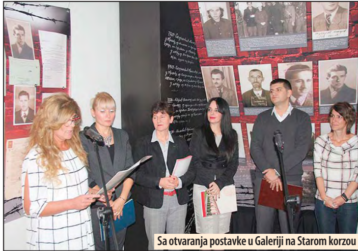
Sa otvaranja postavke u Galeriji na Starom korzou

Izložba je otvorena do 14. oktobra, a ulaz je, po tradiciji ove Galerije, slobodan za sve građane. Z. V.