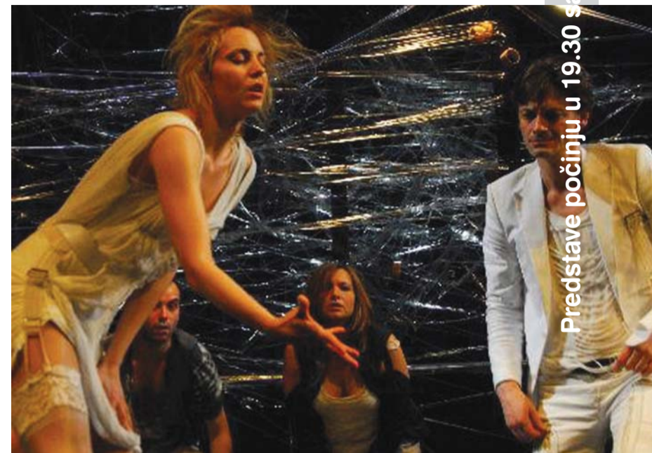
Predstave počinju u 19.30 sati