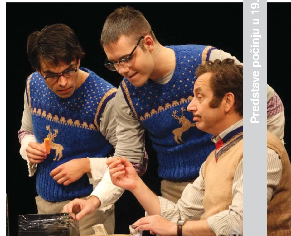
Predstave počinju u 19.30 sati