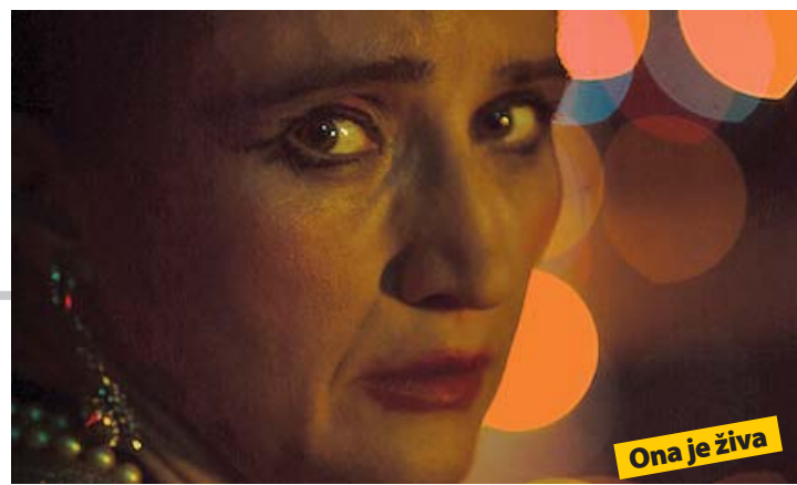
Ona je živa