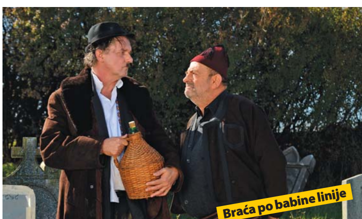
Braća po babine linije