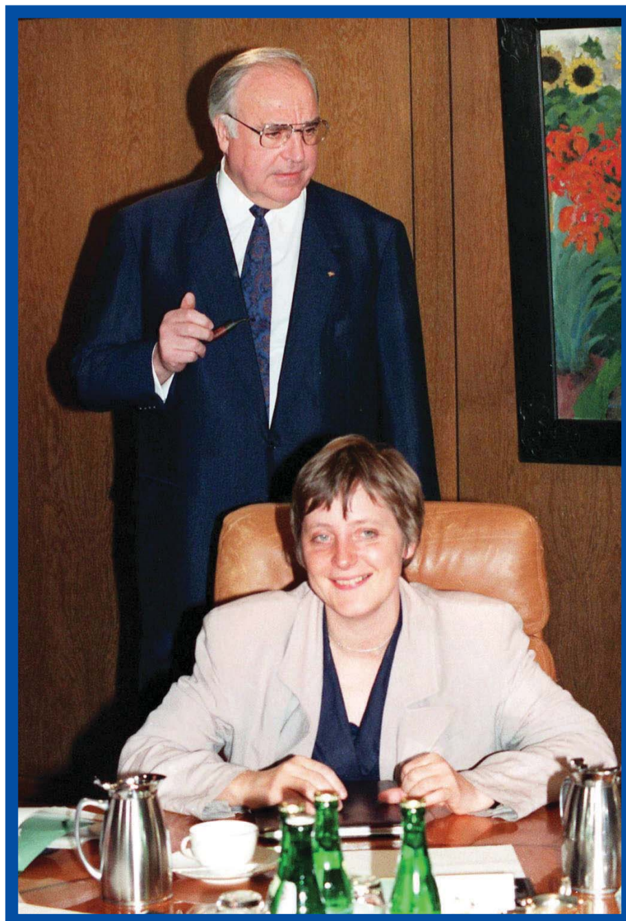
Početak uspona: Kancelar Helmut Kol i Angela Merkel, njegova ministarka za ženska i omladinska pitanja

► Za razliku od vremena velike koalicije u kojem je njena umešnost posredovanja dolazila do punog izražaja, njeno drugo kancelerovanje opterećeno je brojnim nepoverenjima. Vicekancelar i šef diplomatije Gido Vestervele je osoba puna sujete, željna vlasti i slave, umnogome jednako odgovoran ne samo za slabi rejting njegovog FDP-a, nego i za isti takav rejting vlade