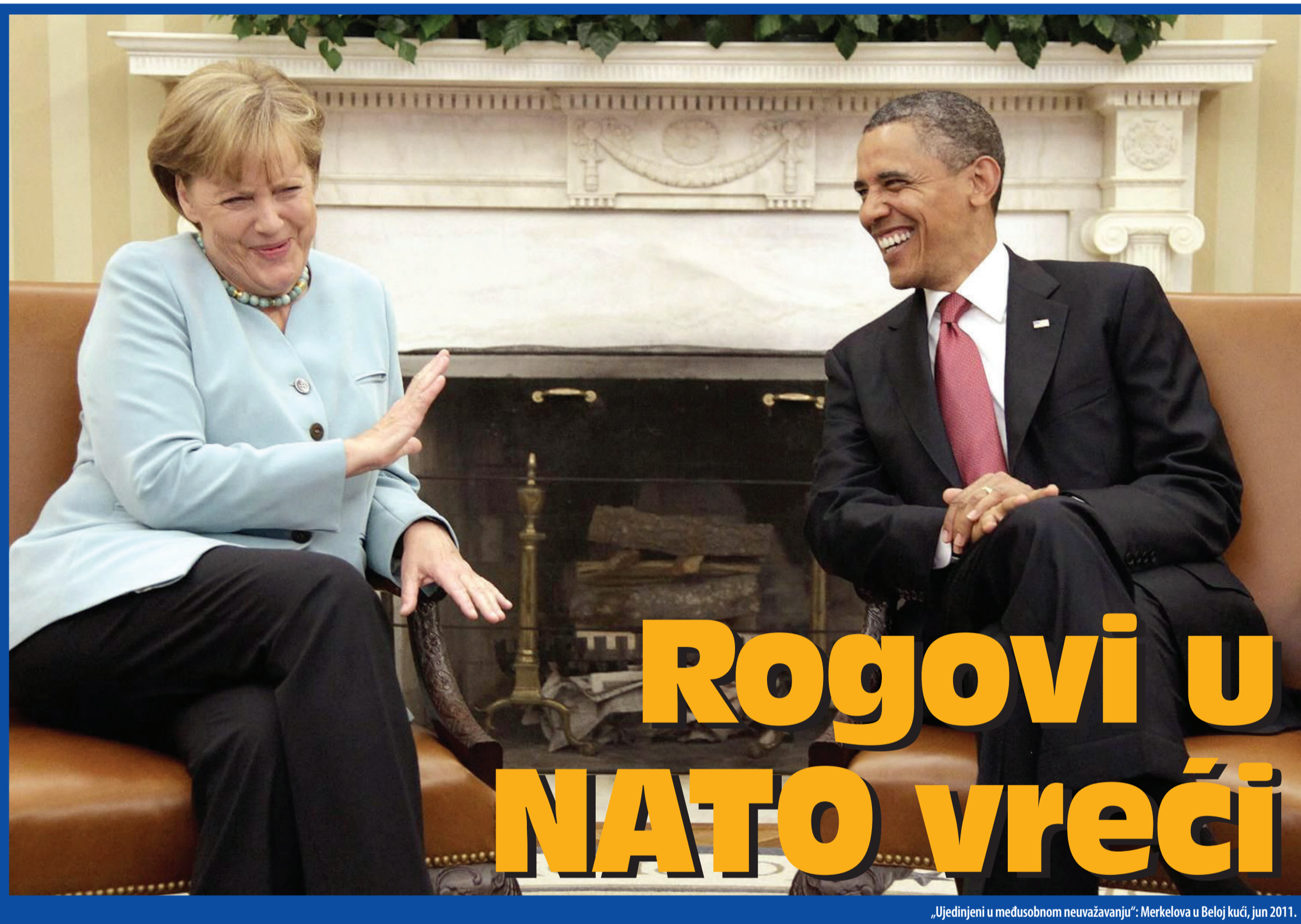
„Ujedinjeni u međusobnom neuvažavanju“: Merkelova u Beloj kući, jun 2011.

Nekako istovremeno, dopisnici američkih listova iz Nemačke počeli su da javljaju o sve primetnijem padu Obamine popularnosti u tamošnjoj javnosti, kao i o slabljenju i onako anemične podrške koju je američki predsednik imao od 2008. u kabinetu Merkelove i među poslanicima Bundestaga. Citiran je tim povodom frankfurtski Rundschau, po kome se na njega sad uglavnom gleda kao na političara „koji ne ispunjava svoje proklamacije“, uz zaključak da Angela Merkel „više ne veruje da on može da rešava svetske probleme“. Prvi značajan raskorak između SAD i SRN registrovan je, inače, prošle jeseni (posle Obaminog neočekivanog „razumevanja za