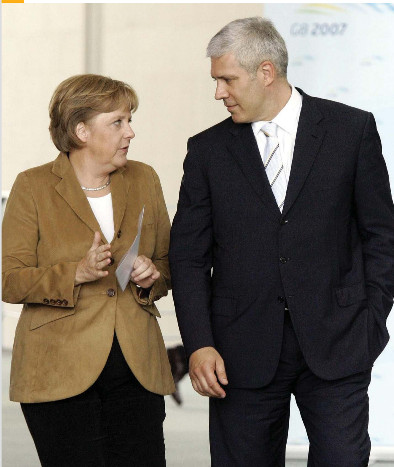
Angela Merkel i Boris Tadić u Berlinu 2007.