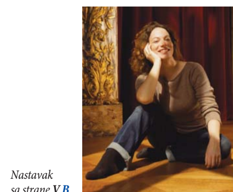
Nastavak sa strane V B

- Retko, šta ću kad sam romantična duša (smeh)... Pratim sve od muzike, volim da čujem dobar džez ili bosu novu, a od savremenih umetnika da li mi se neko dopada? Hm... biću iskren, niko. ■