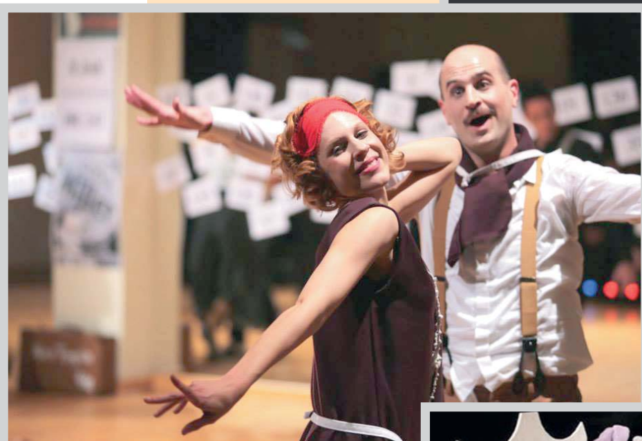
Konje ubijaju, zar ne?