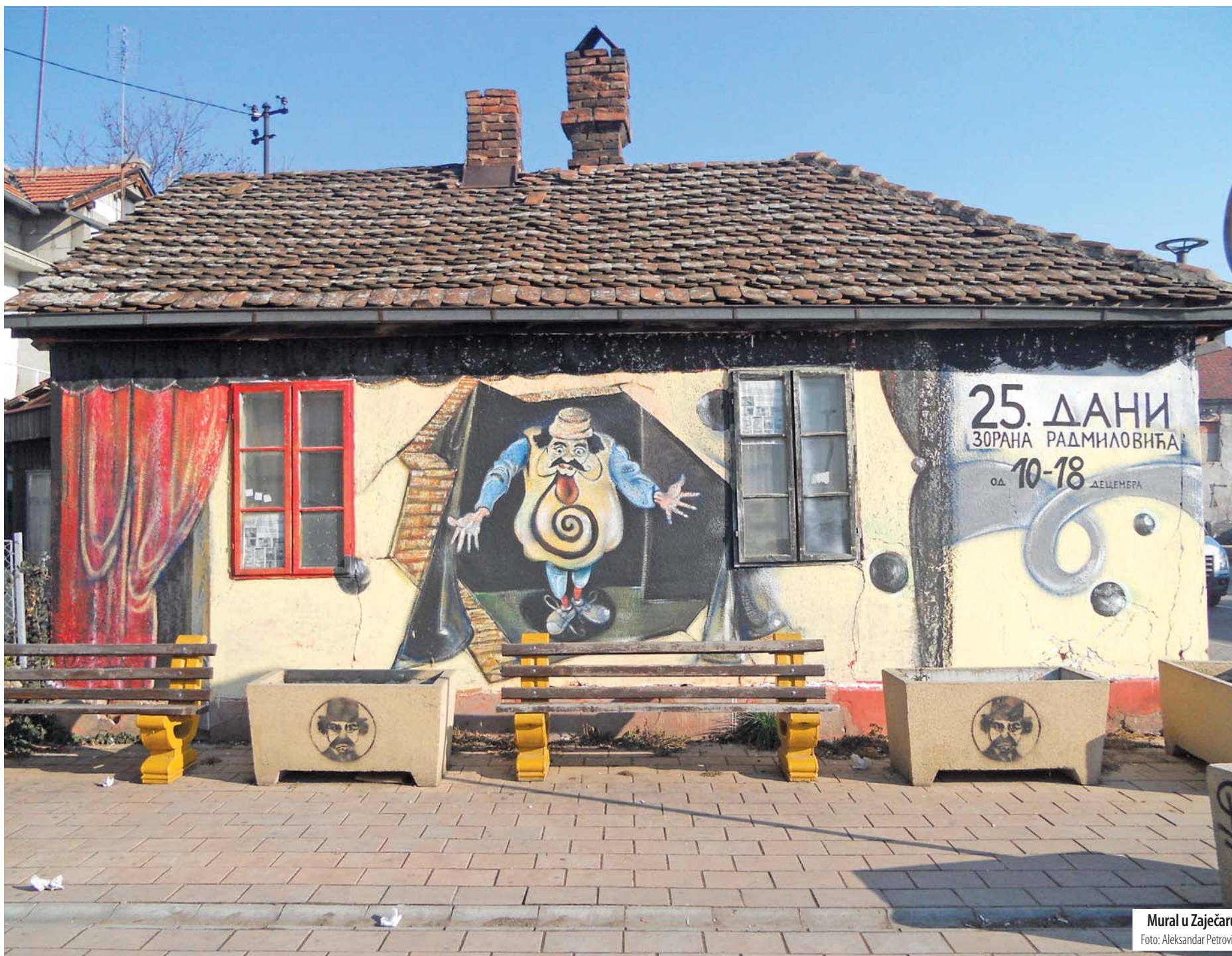
Mural u Zaječaru