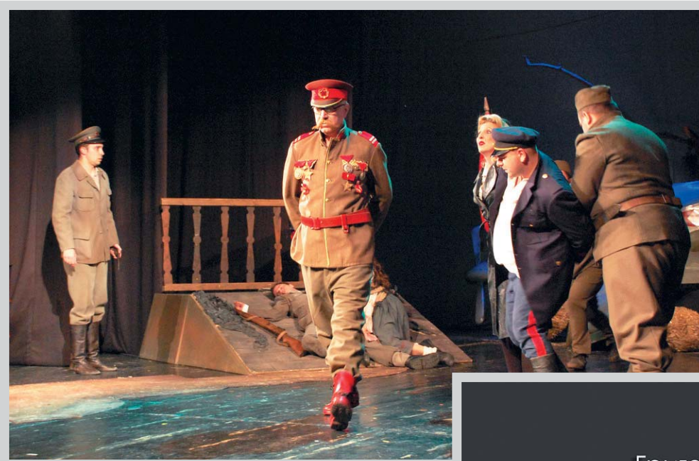
Dosije vojnika Čonkina

Kao selektor ovogodišnjih Dana Zorana Radmilovića predložim i predstavu koja će biti izvedena u čast nagrađenih, poslednjeg festivalskog dana, te sugerišem da to bude predstava Narodnog pozorišta iz Beograda Frenki i Džoni Terensa Meka Neli, koju je režirala Tea Puharić. U vremenima kad smo sve intenzivnije suočeni sa činjenicom da živimo u svojim malim svetovima kao u kakvim zatvorenim univerzumima, sve više izolovani i sve češće usamljeni, dobro je pogledati ovu scensku priču koja svedoči upravo o bolnim ali neophodnim procesima otvaranja jedne osobe u odnosu na drugu. Mek Neli je na sebi svojstven način i u svom stilu napisao dobar, pitak komad o ljudima unesrećenih sudbina, osobama koje u istoj meri i čeznu za iskazivanjem emocija ali i pate što emocije ne primaju. Rediteljka Tea Puharić je ovu priču scenski realizovala odmerenim sredstvima, svesna značaja ove teme, ali i svesna da u подели ima dvoje izuzetnih aktera, posebnog glumačkog senzibiliteta. Otuda na kraju 25. Dana Zorana Radmilovića nudim rediteljski pametno mišljenu i odličnu glumačku predstavu. ▲