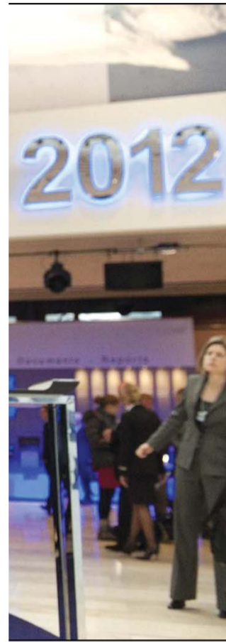
Odbaceni prihvat: Džordž Soros u Davosu 2012.