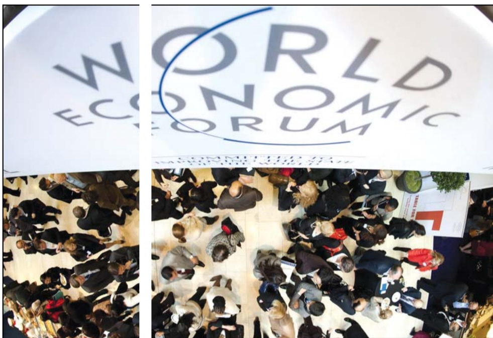
Evropske su vlasti, nažalost, slabo shvatale kako zapravo funkcionišu finansijska tržišta i sve su radile pogrešno: Davos 2012. iz ptičje perspektive