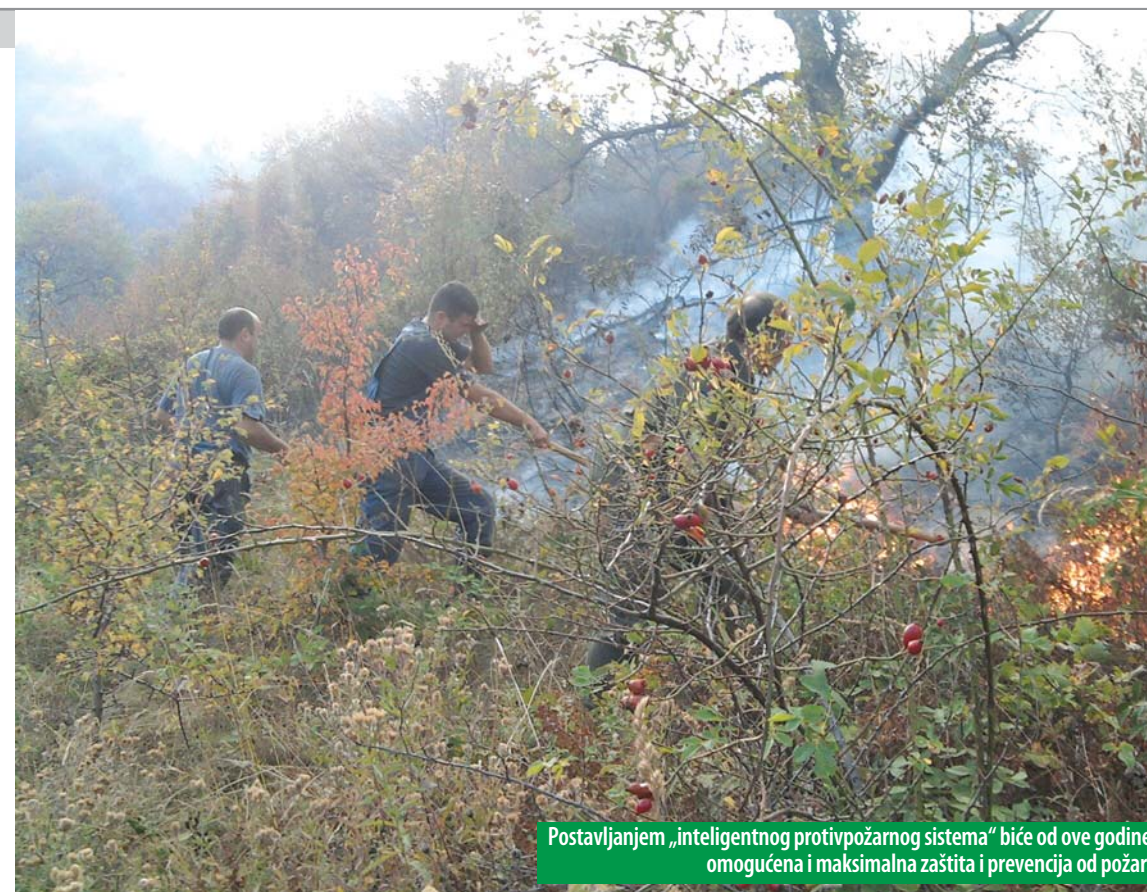
Postavljanjem „inteligentnog protivpožarnog sistema“ biće od ove godine omogućena i maksimalna zaštita i prevencija od požara

Konačnu reč o Planu upravljanja - u JP NP Đerdap očekuju da će ona biti pozitivna i brza - daće nadležni i onda će krenuti i realizacija postavljenih zadataka i ciljeva. Rađić će to 74 zaposlenih, gde trećinu čini visokoobrazovani kadar. Računa se da će u skorije vreme biti omogućeno i novo zapošljavanje, prema sistematizaciji ima 119 radnih mesta u ovom preduzeću, što će doprineti još kvalitetnijem obavljanju poslova i onom osnovnom cilju - očuvanje, zaštita i unapređenje prirodnih vrednosti i retkosti i kulturno-istorijskog nasleđa i njihovo namensko korišćenje na principima održivog razvoja.