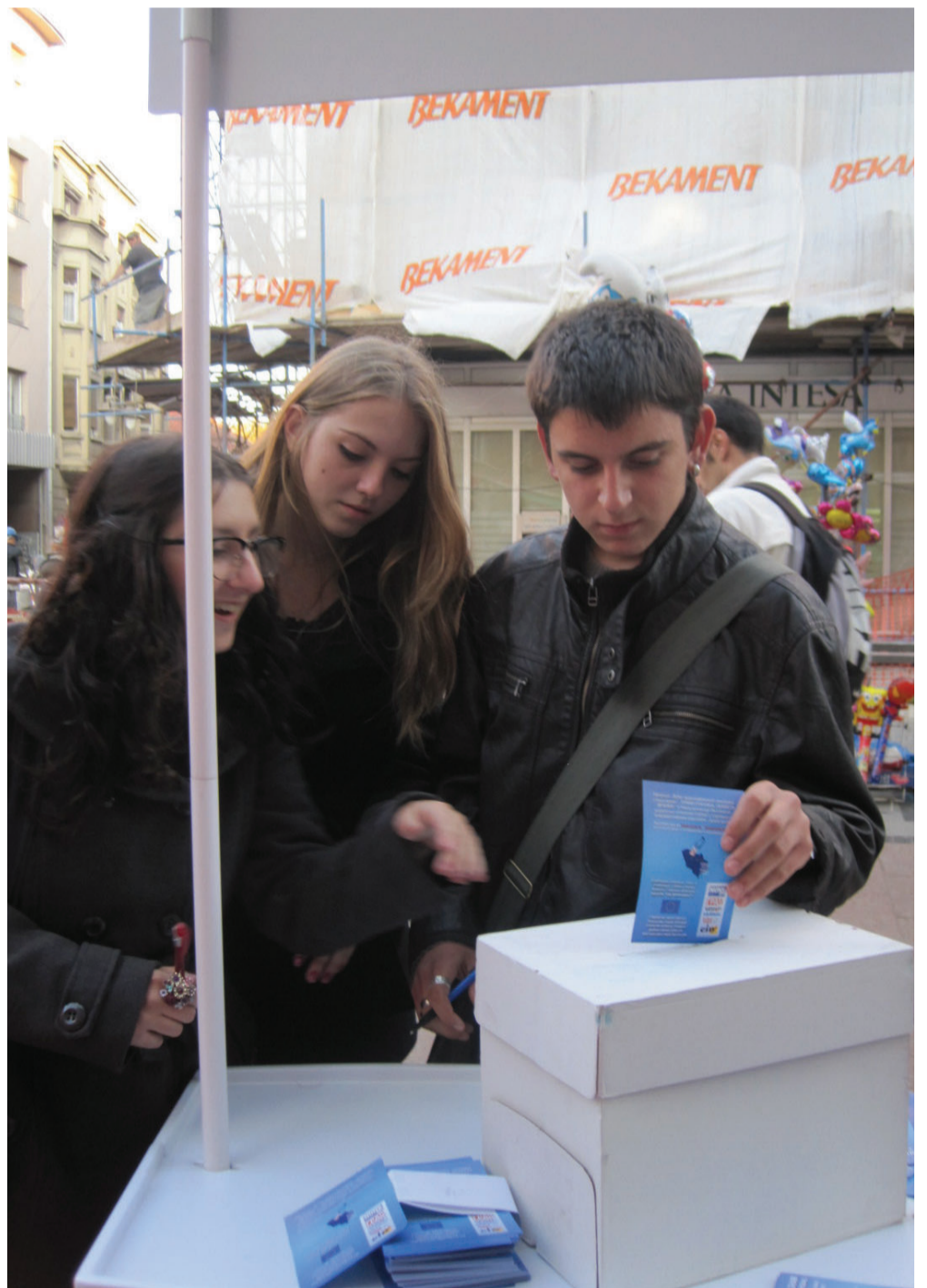
Akcija u Nišu: Građani veoma zainteresovani za rad lokalnih samouprava