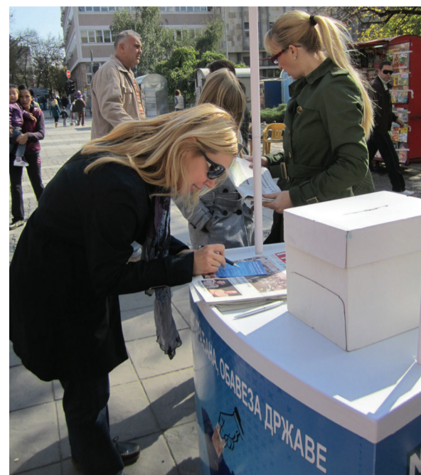
Akcija u Kruševcu