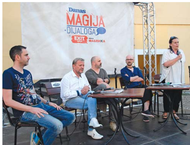
TRIBINA 1 Dušan Kovačević, Emir Hadžihafizbegović, Kokan Mladenović, Damir Urban i Gordana Nonin