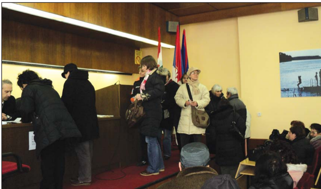
Фонд решио 50.000 захтева заосталих зарада и других права запослених: Радници „Клуз-Тиса“ из Новог Бечеја