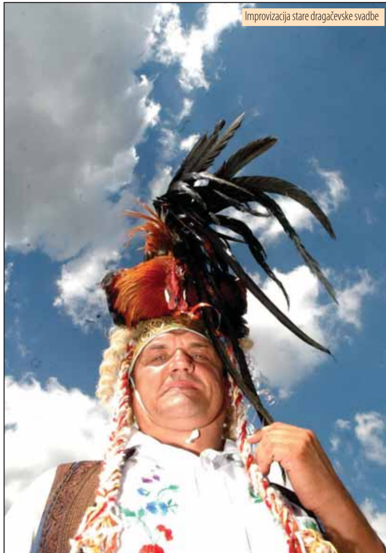
Improvizacija stare draga}evske svadbe