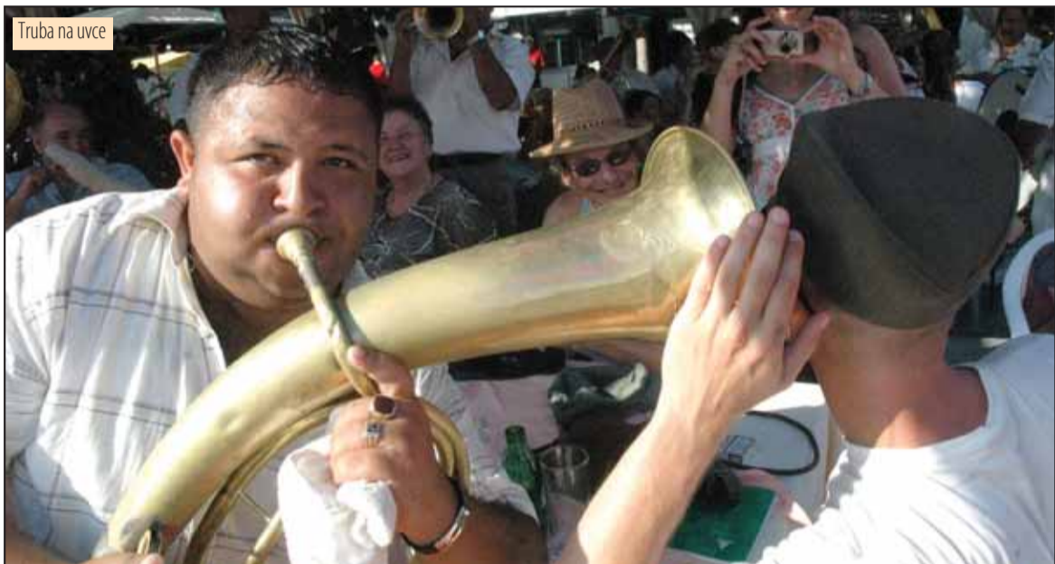
Truba na uvce