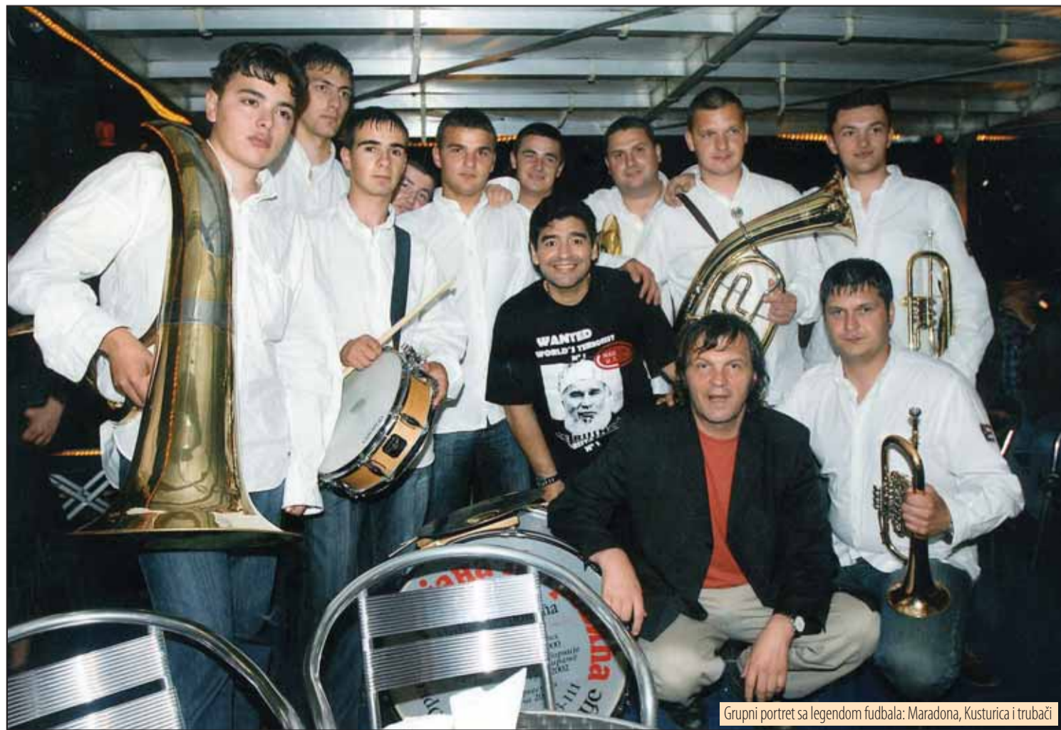
Grupni portret sa legendom fudbala: Maradona, Kusturica i trubači

-Postoje tri orkestra sa ovog podneblja koja su proslavila trubu u