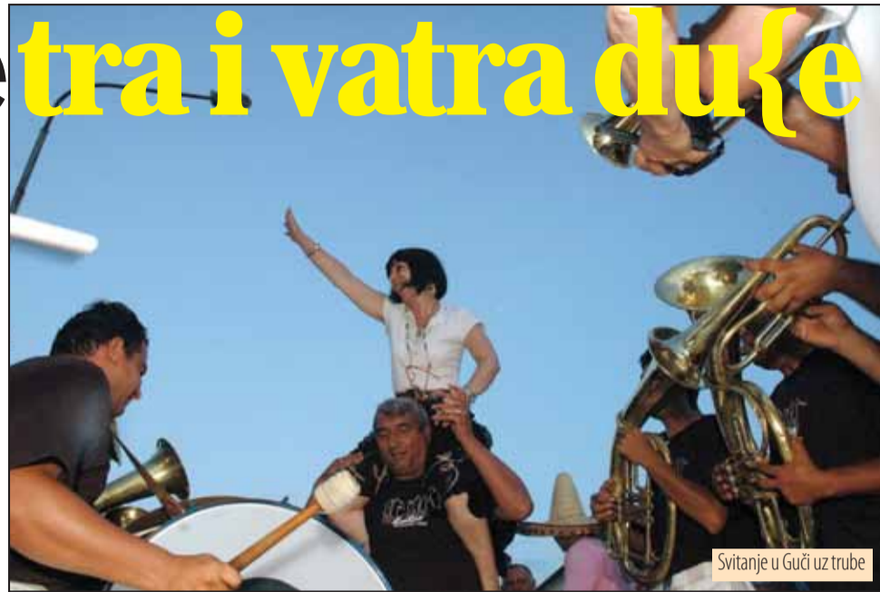
Svitanje u Guči uz trube

logu za ovu nesvakidašnju prezentaciju draga-evskog saborisanja navodi da inspiracija za ovaj projekat leži u „injenici da svoju punu afirmaciju i priznanje muzičari Vranja i vranjskog kraja dobijaju upravo u Guči (to je Stanić) a navelo da objektivom zabeleži scene koje festivaline jedinstvenim“.