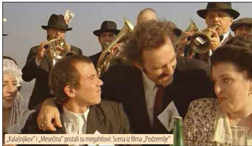
„Kalašnjikov“ i „Mesečina“ postali su megahitovi: Scena iz filma „Podzemlje“

u Gu-u da bi se slikali. Verovatno im oni {to ih „brifingiju“ i savetuju ka`u da su se toliko otu|ili od naroda, da bi morali nekako da mu se pribli`e. Koliko god se to nekima gadilo, zvuk trube sa Balkana nosi energiju i pru`a poseban ugo|aj. Nastajao je vekovima, kao spoj melanholi-nih tonova istoka i