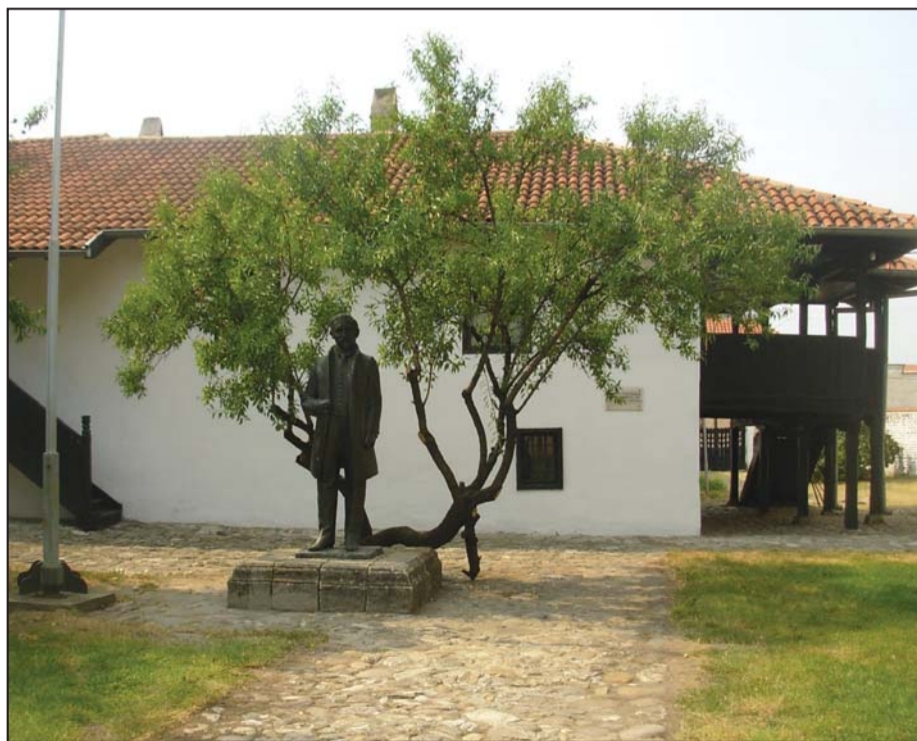
Kuća Stevana Mokranjca