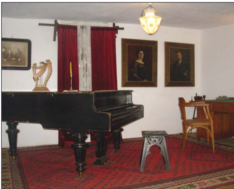
Unutrašnjost kuće Stevana Mokranjca

Na kraju, prirodno je da se Festival tokom vremena menja, kao što se i menjao tokom svih ovih godina. Kao što su neki ljudi ulagali sebe nekada, kao što to rade danas, tako će i u budućnosti neki novi ljudi naše velike porodice Mokranjčevih dana, činiti sinergiju neophodnu za život Festivala.