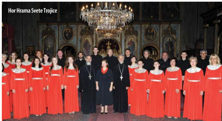
Hor Hrama Svete Trojice

- Šestu Rukovet Stevana St. Mokranjca, u nastavku programa izvode učesnici Natpevanja i Hor Hrama Svete Trojice ,