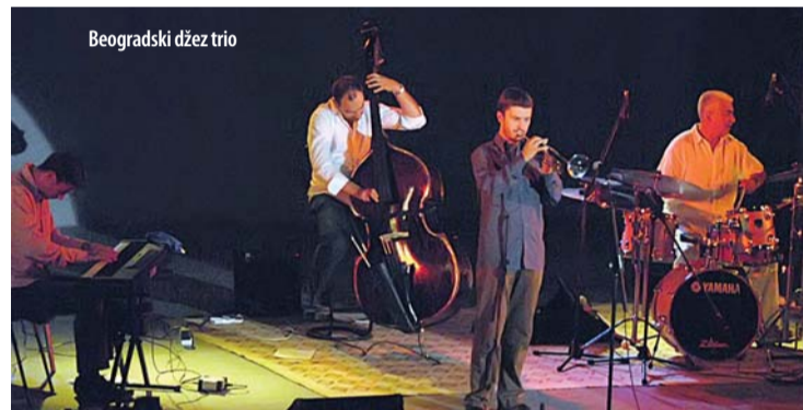
Beogradski džez trio