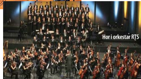
Hor i orkestar RTS

jac, Hor i orkestar RTS i Hor Obilić AKUD Branko Krsmanović