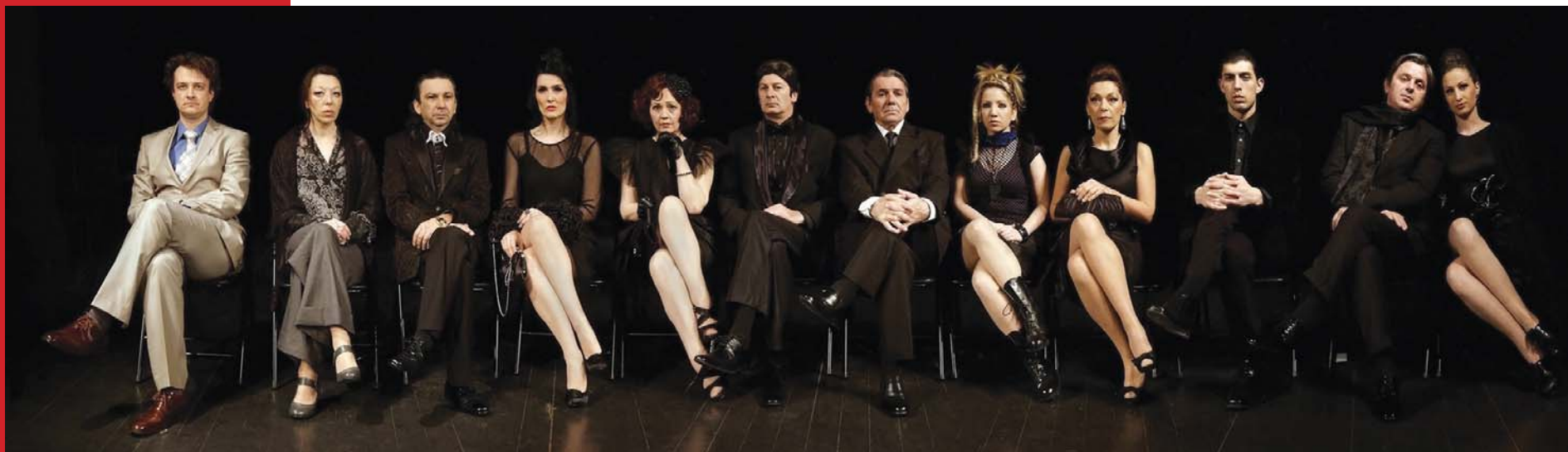
Mnogo nagrađivana predstava: „Ožalošćena porodica“