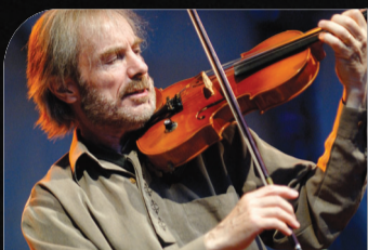
Jean Luc Ponty