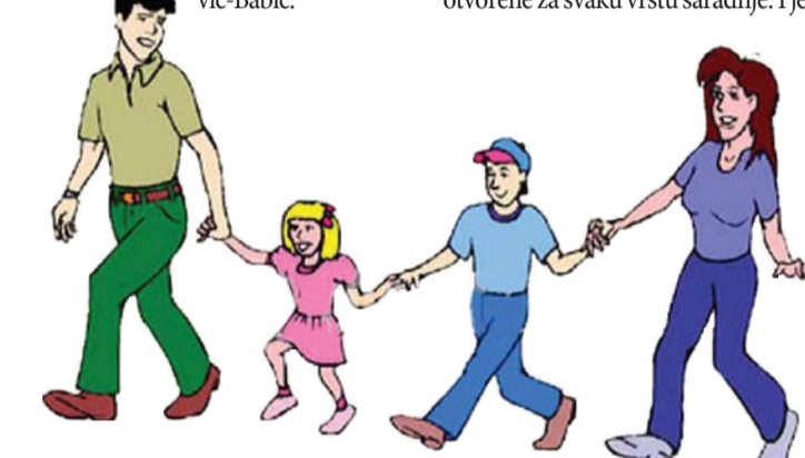
Uvođenje elektronskih dnevnika i komunikacija SMS porukama udaljuje roditelje od škole

Oni se osećaju dosta nemoćno između dva vrlo moćna partnera. S jedne strane su njihova deca, koja imaju moćno vršnjačko okruženje, „moćne“ kompjutere, pred kojima provode mnogo vremena, a roditeljski autoritet teško da može da parira takvim „autoritetima“. Ne znaju kako da im plasiraju svoje vrednosti, kako da ih, grubo rečeno, drže pod kontrolom, da budu sigurni kuda vode svoju decu. S druge strane, škola je takođe moćan partner. Roditelji u školu dolaze da bi im nastavnici rekli kakva su njihova deca, šta treba da rade sa njima, da bi im dali lekcije, a niko ih ne pita za mišljenje. Pitanje je i koliko su nastavnici pristupačni i otvoreni za saradnju - kaže Pavlović-Babić.