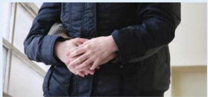
Maloletničke trudnoće - tema o kojoj se ne govori