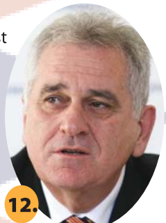
TOMISLAV NIKOLIĆ, SNS