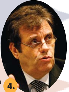
VOJISLAV KOŠTUNICA, DSS