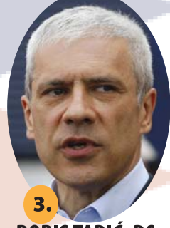
BORIS TADIĆ, DS