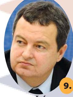
IVICA DAČIĆ, SPS

DOSADAŠNJI IZBORI: Prvi put učestvuje na predsedničkim izborima.