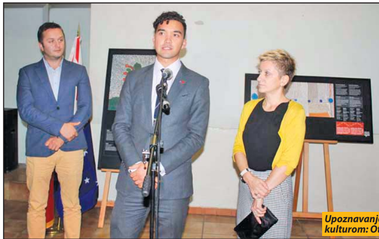
Upoznavanje sa dalekom kulturom: Otvaranje izložbe

smo za renoviranje prostorija, spuštanjem plafona, uradili smo elektroinstalaciju nanovo, natkrili ulaz, okrečili, uradili pregradu za poseban kancelarijski dio i napravili prijatan prostor za bora-