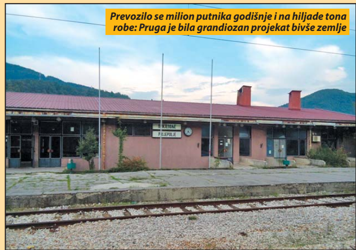
Prevozilo se milion putnika godišnje i na hiljade tona robe: Pruga je bila grandiozan projekat bivše zemlje