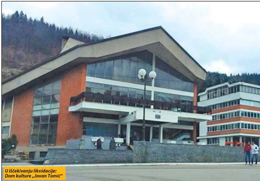
U iščekivanju likvidacije: Dom kulture „Jovan Tomić“

- U domaćoj javnosti se mogu čuti različite spekulacije na ovu temu, uz