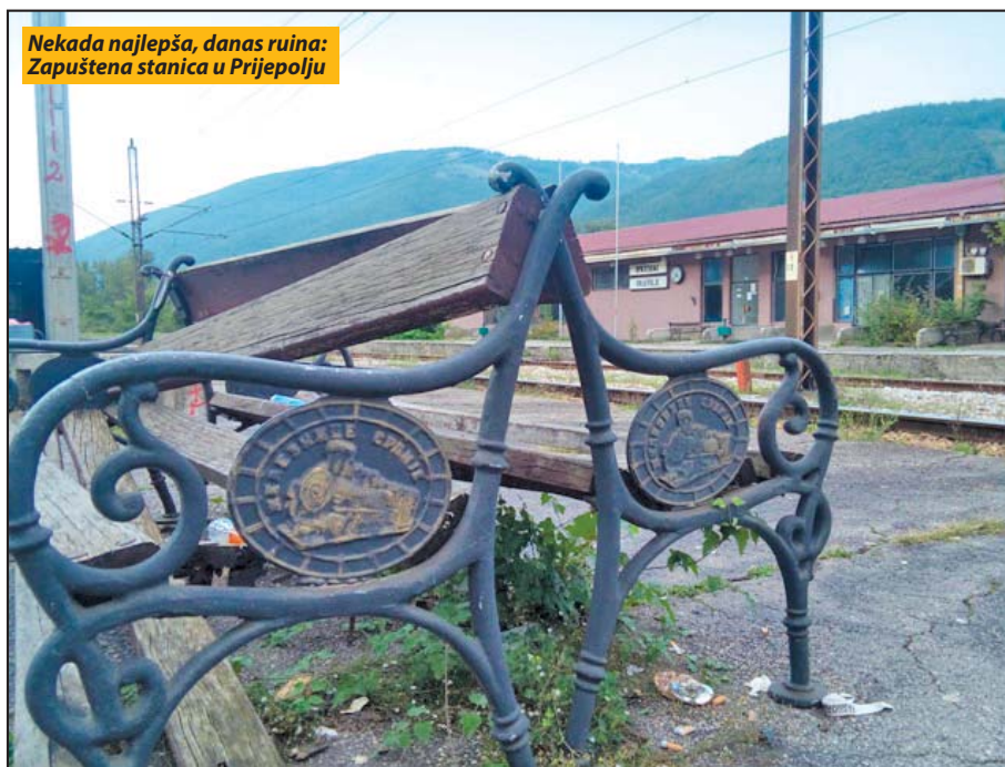
Nekada najlepša, danas ruina: Zapuštena stanica u Prijepolju

Ideja o izgradnji pruge koja će Beograd povezati sa morem nastala je još osamdesetih godina 19. veka. Bila je to varijanta koju je zagovarala moćna Austrougarska kako bi Srbiju, preko Višegrada povezala sa lukom u Gružu. Bilo još ideja. Na Međunarodnoj konferenciji u Parizu 1909. godine zaključeno je da bi London preko Pariza, Rima, Barija, Niša, Bukurešta i Kijeva mogao da bude povezan sa Moskvom. Nastaje potom mnogi elaborati i doktorati na temu trasiranja pruge. Ipak, 1940. godine ozvaničena je trasa od Beograda do Tivta, dužine 550 kilometara. Onda rat. I nestade sna o pruzi. Posle Drugog svetskog rata, 20. jula 1951. godine, Privredni sa-