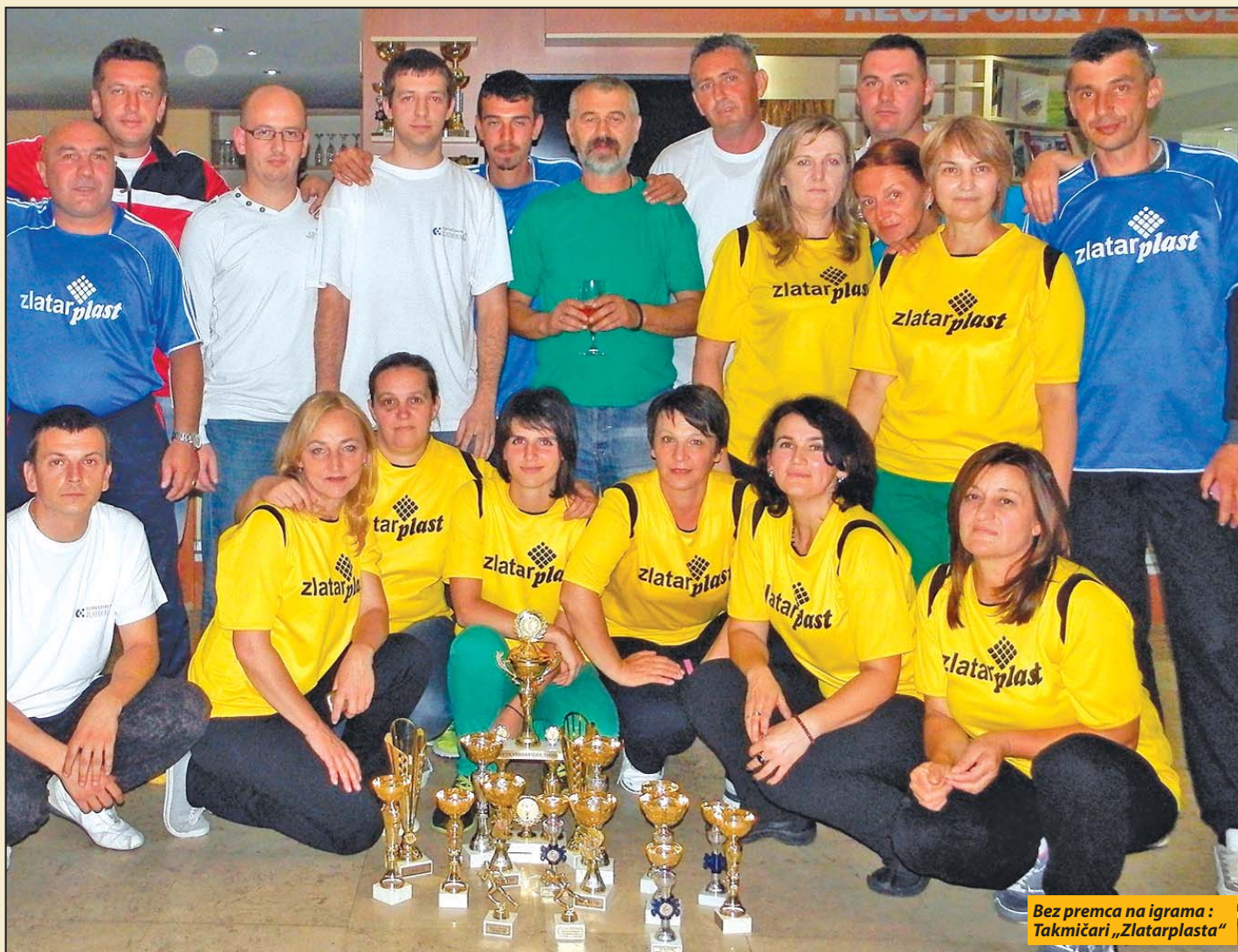
Bez premca na igrama: Takmičari „Zlatarplasta“

Nova Varoš - Sa ukupno 16 osvojenih medalja preduzeće „Zlatarplast“ iz Bistrice sveukupni je pobednik Radničkih sportskih igara koje su upravo završene u Novoj Varoši. Drugo mesto sa svega deset bodova zaostatka, osvojio je Dom zdravlja, dok je treći Turističko-sportski centar „Zlatar“. Pehar za fer-plej pripao je malobrojnoj ekipi Centra za socijalni rad.