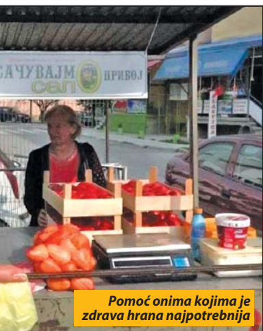
Pomoć onima kojima je zdrava hrana najpotrebnija