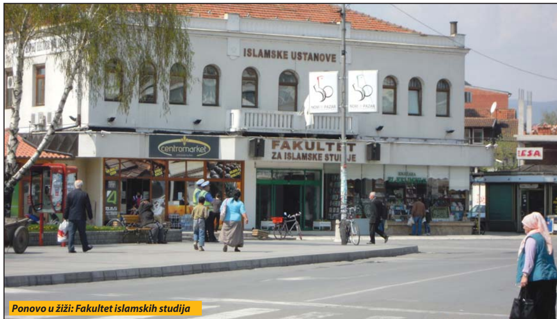
Ponovo u žiži: Fakultet islamskih studija

Novi Pazar - Gradsko veće nastoji da zaustavi proširenje zgrade Fakulteta za islamske studije (FIS) bez građevinskih dozvola. Ovim pitanjem na poslednjem zasjedanju bavilo se i Gradsko veće Novog Pazara. Konsatovano je da su nadležne inspeksijske službe donele sva potrebna rešenja u skladu sa zakonom (obustavljanje radova, rušenje izgrađenog dela i zatvaranje gradilišta), ali izgradnja nije zaustavljena. Zbog toga je doneta odluka da se pomoć zatraži od Vlade Srbije i ministarstava unutrašnjih poslova, pravde i građevinarstva.