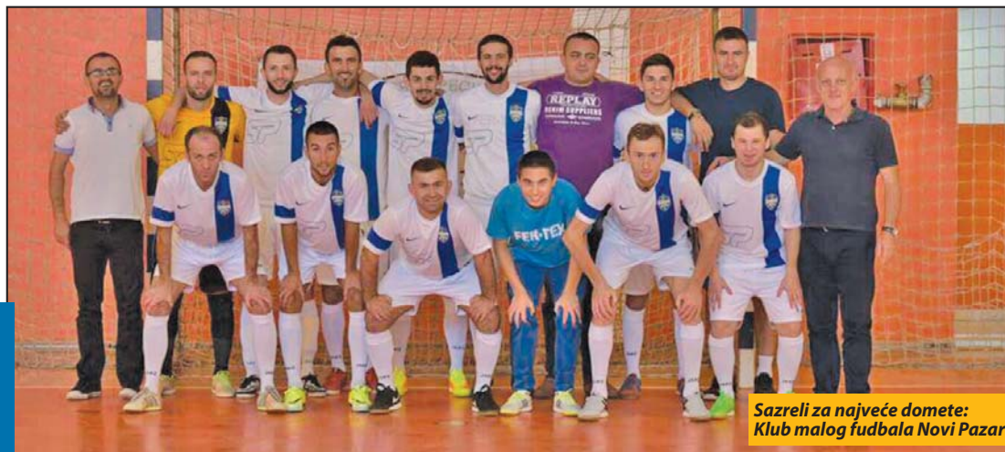
Sazreli za najveće domete: Klub malog fudbala Novi Pazar

Drugi deo šampionat počinje 17. februara 2017. godine.