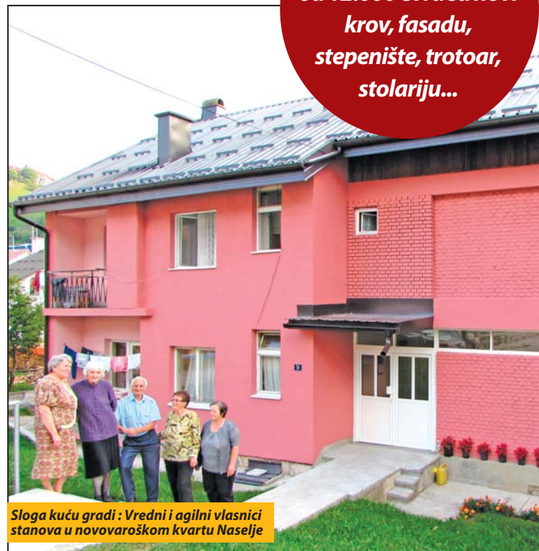
Sloga kuću gradi: Vredni i agilni vlasnici stanova u novovaroškom kvartu Naselje

Iako su gotovo svi u već poznim godinama života, vrednim stanarima iz Nikole Tesle 14 nije teško ni da se sami staraju o održavanju, higijeni i čišćenju dvospratnice. Na vidnom mestu u hodniku zgrade redovno se prave rasporedi pranja i ribanja stepeništa, prozora, podrumskog prostora i drugih zajedničkih prostorija. Ne izostaju ni radovi na sadnji i održavanju cveća i zelenila u neposrednoj blizini ovog stambenog objekta. Strogo se poštuju i pravila kućnog reda,