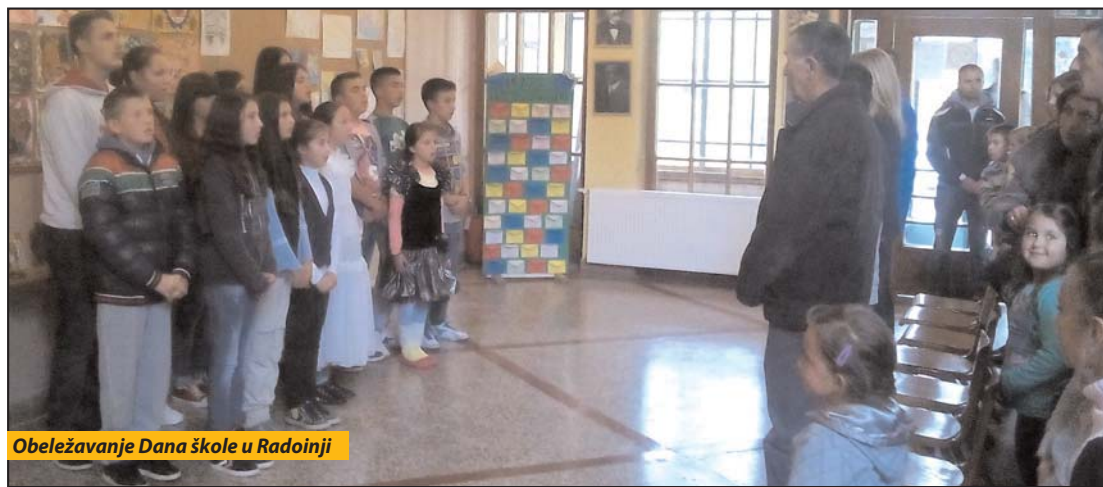
Obeležavanje Dana škole u Radojnji

Nova Varoš - Osnovna škola „Gojko Drušević“ iz Radojnje proslavila je šezdeset prvu godinu postojanja i uspešnog rada. Rođendan je, u matičnoj školi, obeležen nizom kulturno-umetničkih, zabavnih i sportskih programa