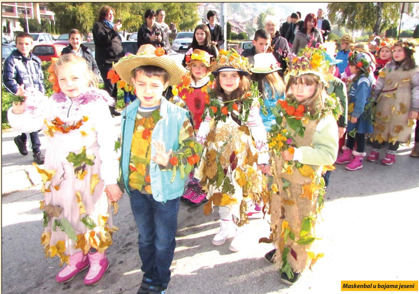
Maskenbal u bojama jeseni

Nova Varoš - Predškolska ustanova „Paša i Nataša“ u Novoj Varoši održala je tradicionalni jesenji karneval.