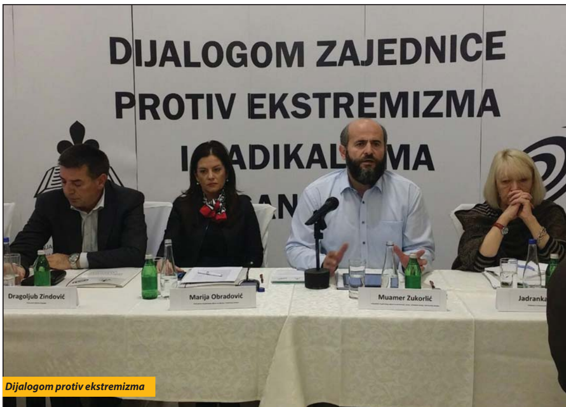
Dijalogom protiv ekstremizma