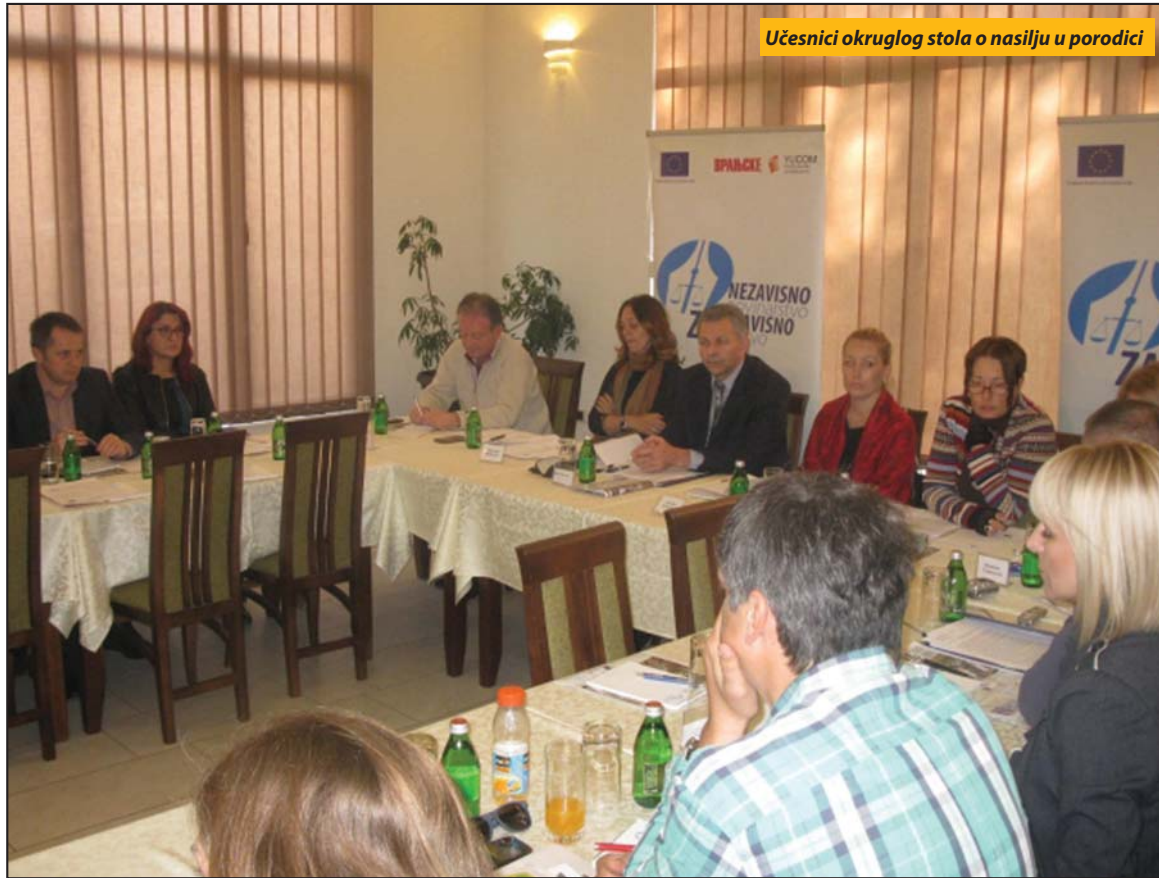
Učesnici okruglog stola o nasilju u porodici

Srbija je 2005. godine prvi put u svoje krivično zakonodavstvo uvela krivično delo „Nasilje u porodici“. Nedugo zatim i Porodičnim zakonom uvedena je zaštita od nasilja u porodici. Proteklih godina ova pojava postala je i tema u javnim glasilima i na stručnim skupovima. Srbija je prestala da ignoriše ovaj problem. Sudeći po prisustvu u medijima, stiče se utisak da nasilje u porodici eskalira, međutim, ono je pre svega postalo vidljivije,