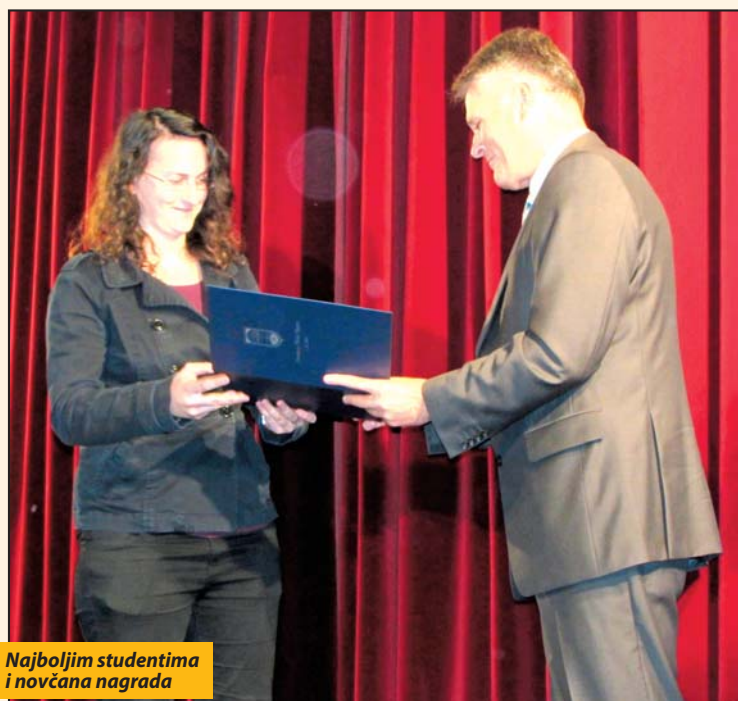
Najboljim studentima i novčana nagrada