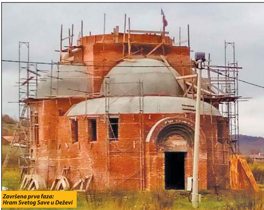
Završena prva faza: Hram Svetog Save u Deževi