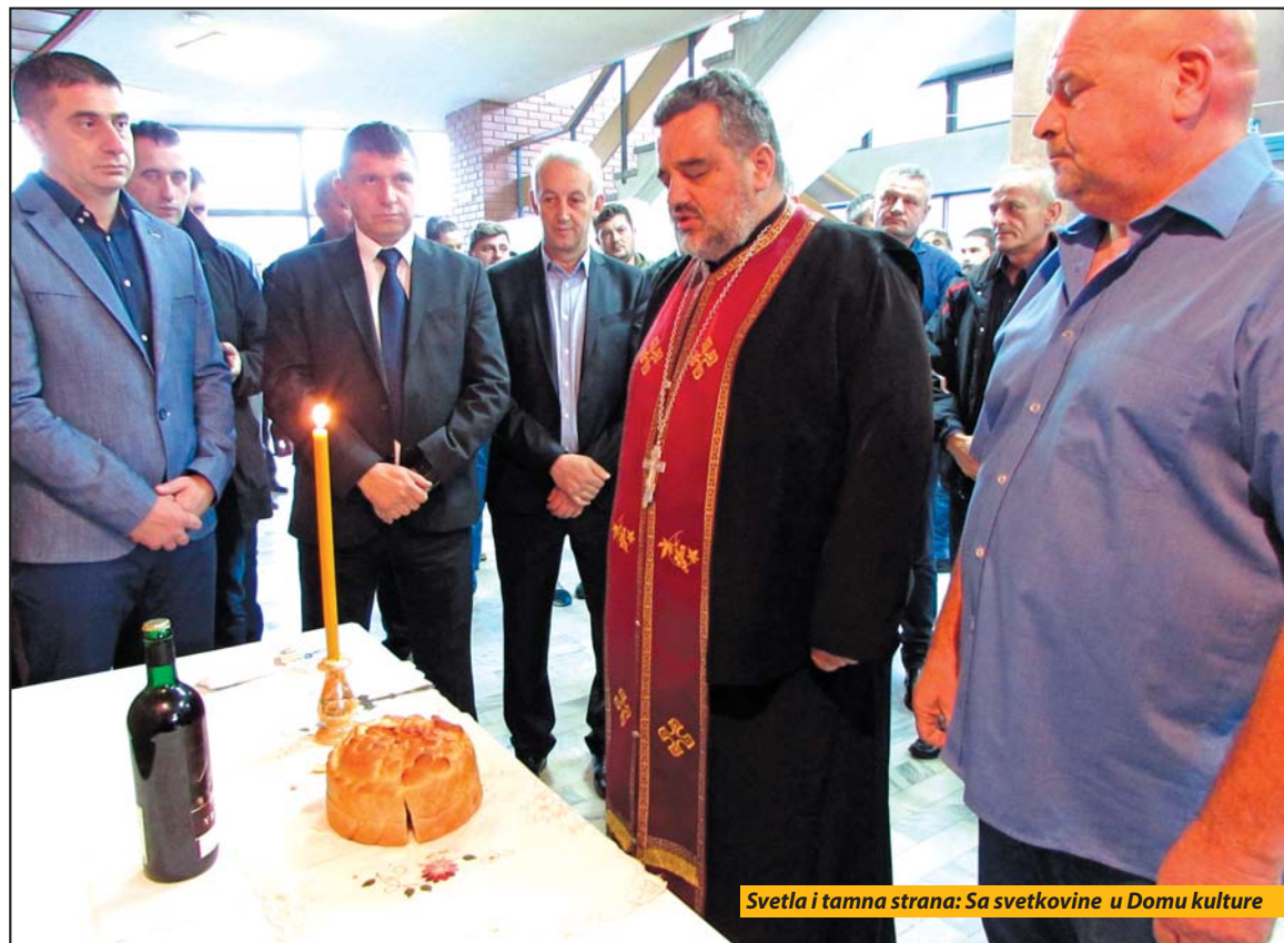
Svetla i tamna strana: Sa svetkovine u Domu kulture