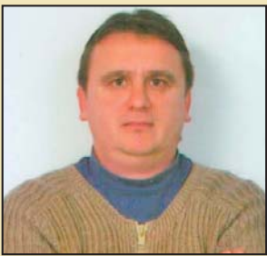
Piše: Slobodan Martinović

U kom okviru danas funkcioniše civilno društvo u Srbiji? Kakva je donatorska politika prema civilnom društvu? Kakva je državna politika prema civilnom društvu? Poslednji konkursi kod Regionalnog centra za životnu sredinu i Kancelarije za ljudska i manjinska prava još jednom potvrđuju već neko vreme ustanovljenu praksu da jedne te iste organizacije civilnog društva dobijaju podršku. Da li organizacije civilnog društva koje stalno dobijaju podršku prave pozitivne promene u društvu? Odgovor je - ne. Predlozi projekata koji prolaze ne rešavaju probleme u društvu i nisu relevantni.