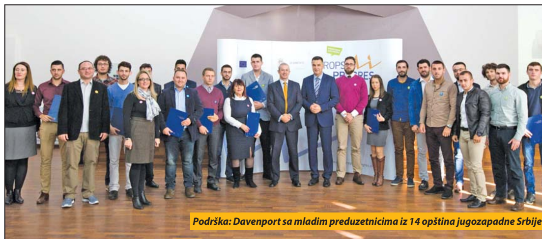
Podrška: Davenport sa mladim preduzetnicima iz 14 opština jugozapadne Srbije