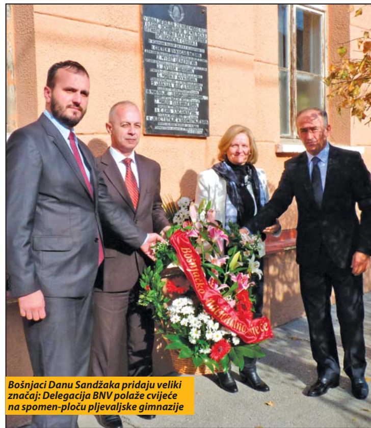
Bošnjaci Danu Sandžaka pridaju veliki značaj: Delegacija BNV polaže cvijeće na spomen-ploču pljevaljske gimnazije

Predsjednik Crne Gore Filip Vujanović je kazao da je ovo godina u kojoj je izvjesno da će se graditi drugi blok