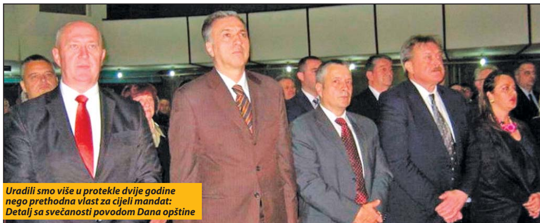
Uradili smo više u protekle dvije godine nego prethodna vlast za cijeli mandat: Detalj sa svečanosti povodom Dana opštine

nog društva, vjerskih organizacija, boračkih organizacija i udruženja Pljevljaka.