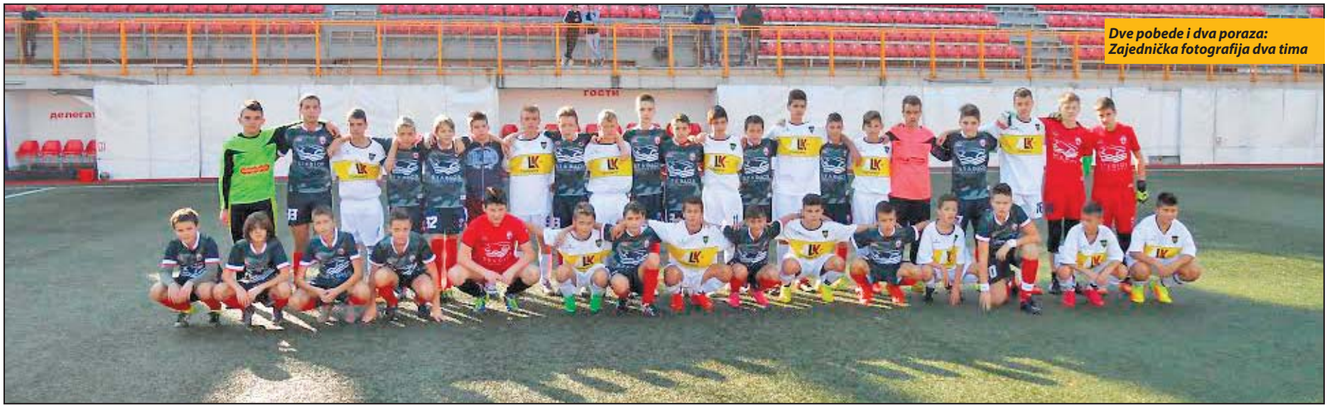
Dve pobjede i dva poraza: Zajednička fotografija dva tima

Četiri selekcije mladih fudbalera Pazar juniorsa odmerile snage sa Voždovcem