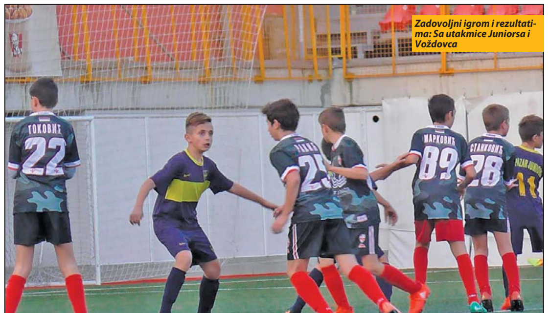
Zadovoljni igrom i rezultatima: Sa utakmice Juniorsa i Voždovca

Tradicija i rezultati FK Voždovac nisu na nivou onih klubova sa kojima su se sve kategorije Pazar juniorsa ranije sastajale, zato ovaj beogradski klub ima nešto što osim njih u Srbiji nema niko, a to vredi videti. Stadion ovog su-