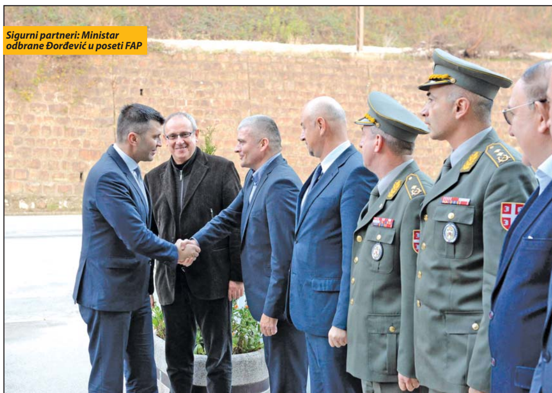
Sigurni partneri: Ministar odbrane Đorđević u poseti FAP

Ministar odbrane Zoran Đorđević nedavno je posetio FAP i razgovarao sa