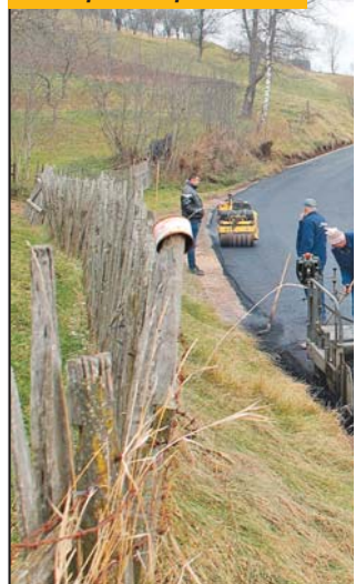
Miški gaj bez zakrpa: Radovi pored Popadića kuća

Ovuda se transportuju velike količine građe, drva, građevinskog materijala, stoke, mleka, sira, stočne hrane i drugih sirovina i proizvoda, a svakodnevno prevoze meštani, daci i posade HE „Uvac“ na Rastokama. Meštani su godinama ogorčeni