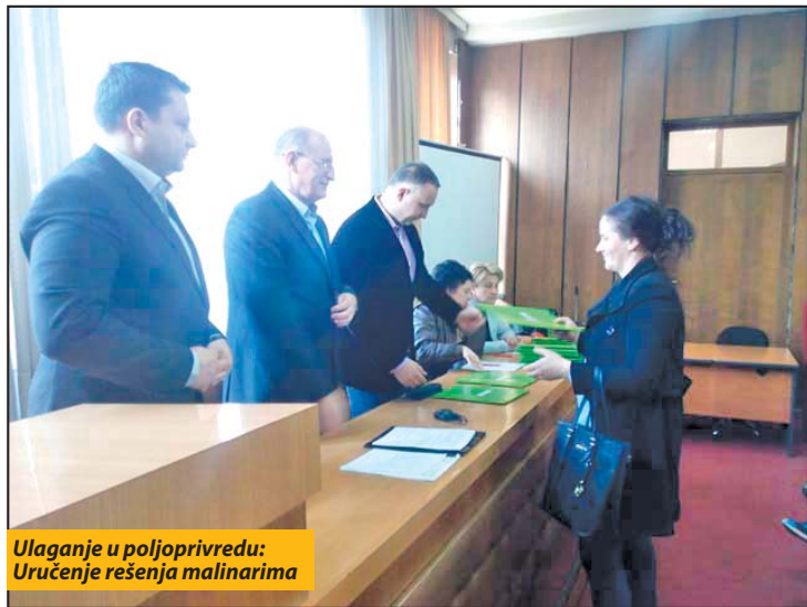
Ulaganje u poljoprivredu: Uručenje rešenja malinarima

Podsticaj razvoja poljoprivrede u Bijelom Polju