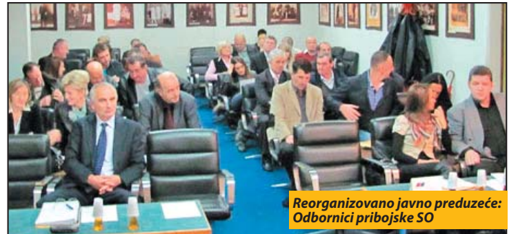
Reorganizovano javno preduzeće: Odbornici pribojske SO

Većina zaposlenih iz Direkcije nastaviće da radi u novoformiranom preduzeću. Za sprovođenja ove odluke moralo je da dođe do rebalansa budžeta. O tome je doneta odluka u okviru prve tačke dnevnog reda istog zasedanja lokalne Skupštine, na čijem je dnevnom redu bilo još: Predlog Odluke o usklađivanju poslovanja JKP "Usluga" Priboj sa Zakonom o javnim