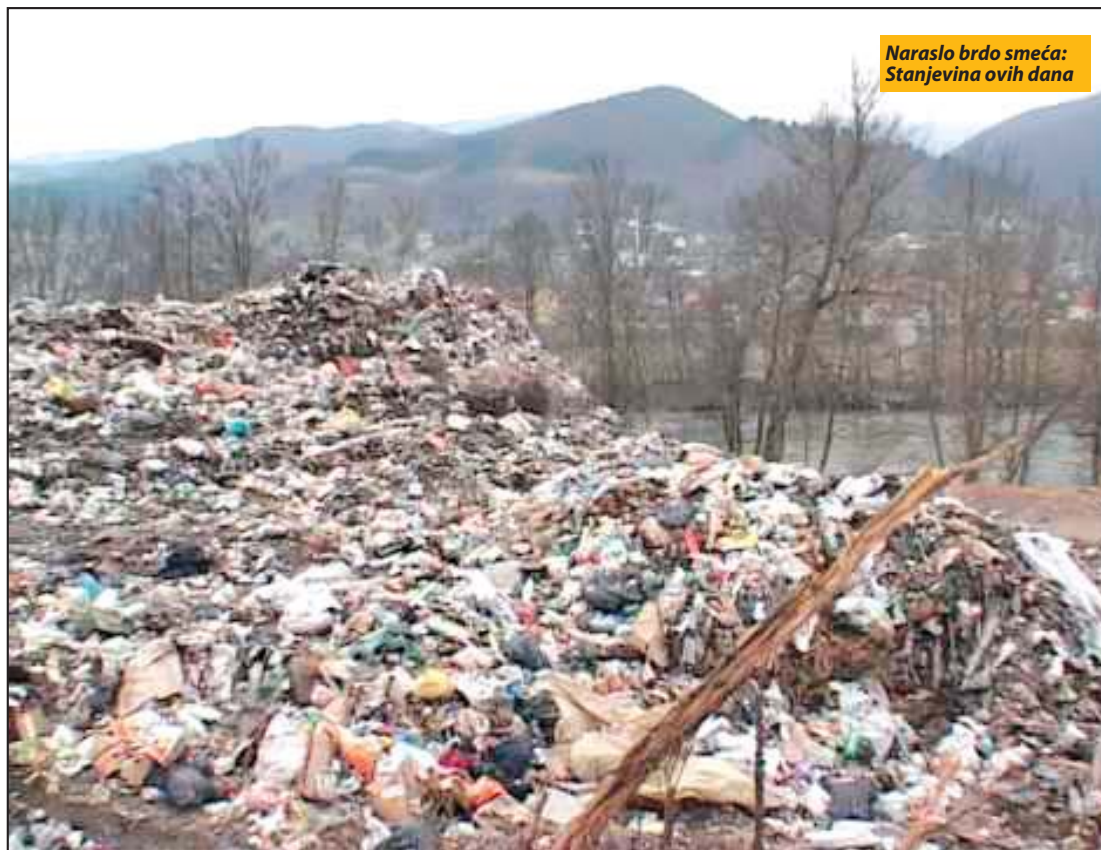
Narasio brdo smeća: Stanjevina ovih dana

Prijepolje - Predstavnici građana koji žive u Zalugu, u prisustvu brojnih kamera, predali su u pisarnicu Opštinske uprave zahtev sa skoro 500 potpisa, kojim se traži zatvaranje divlje deponije u Stanjevinama. Namera je, kako se navodi, da se ukaže na nepodnošljivo stanje koje je do skora bilo i podnošljivo jer je JKP „Lim“ iole održavalo deponiju, ali od letos je brdo smeća naraslo nekoliko metara i zbog obrušavanja u Lim