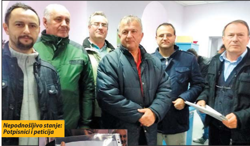
Nepodnošljivo stanje: Potpisnici i peticija

- Potpuno razumem građane Zaluga ali mislim da je u ovom trenutku