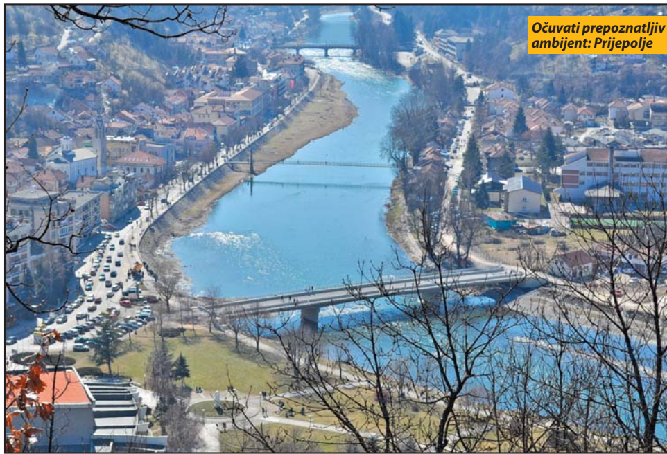
Očuvati prepoznatljiv ambijent: Prijepolje