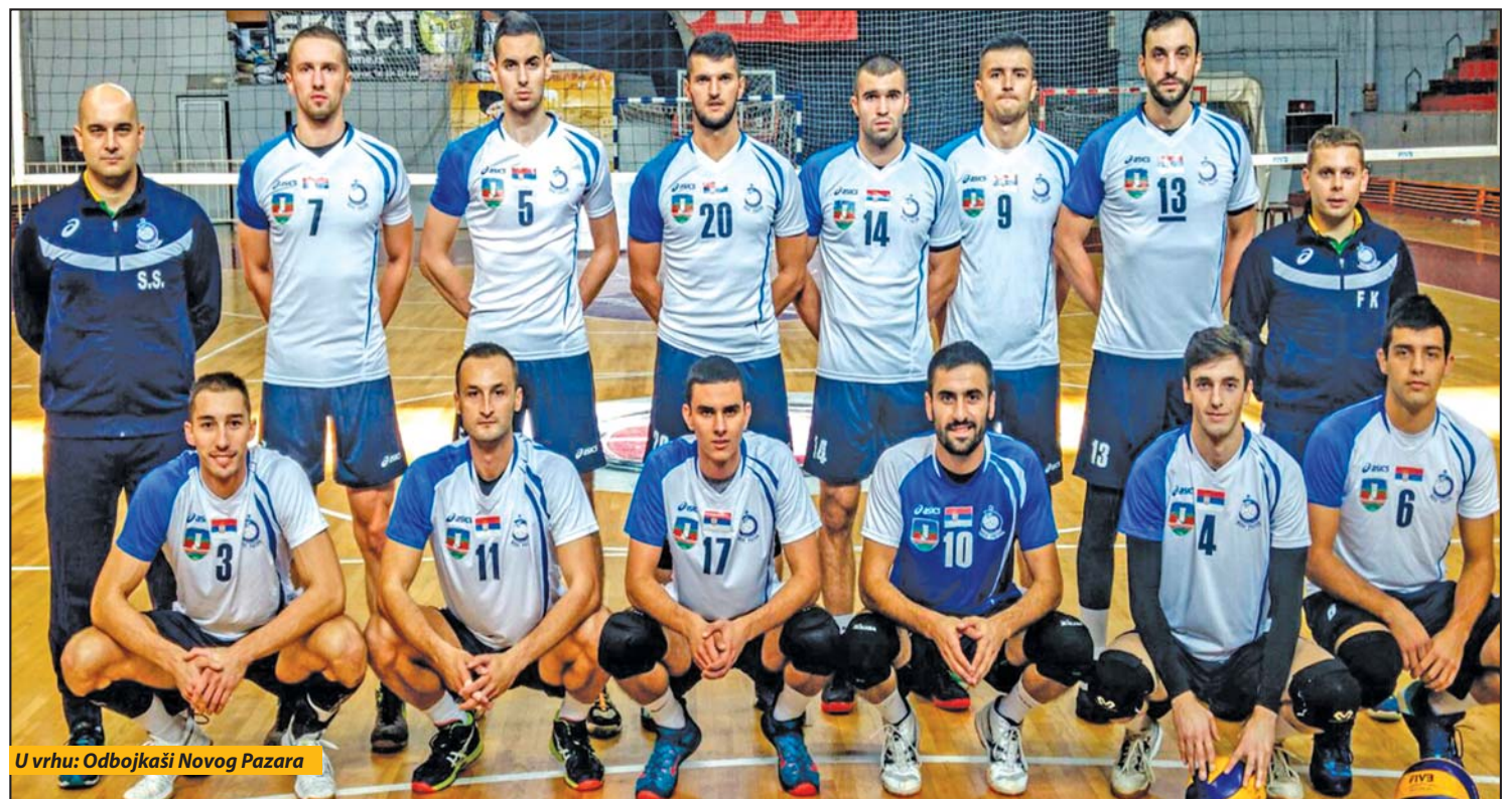
U vrhu: Odbojkaši Novog Pazara

Utakmica u dresu Novog Pazara koju ste najbolje odigrali?