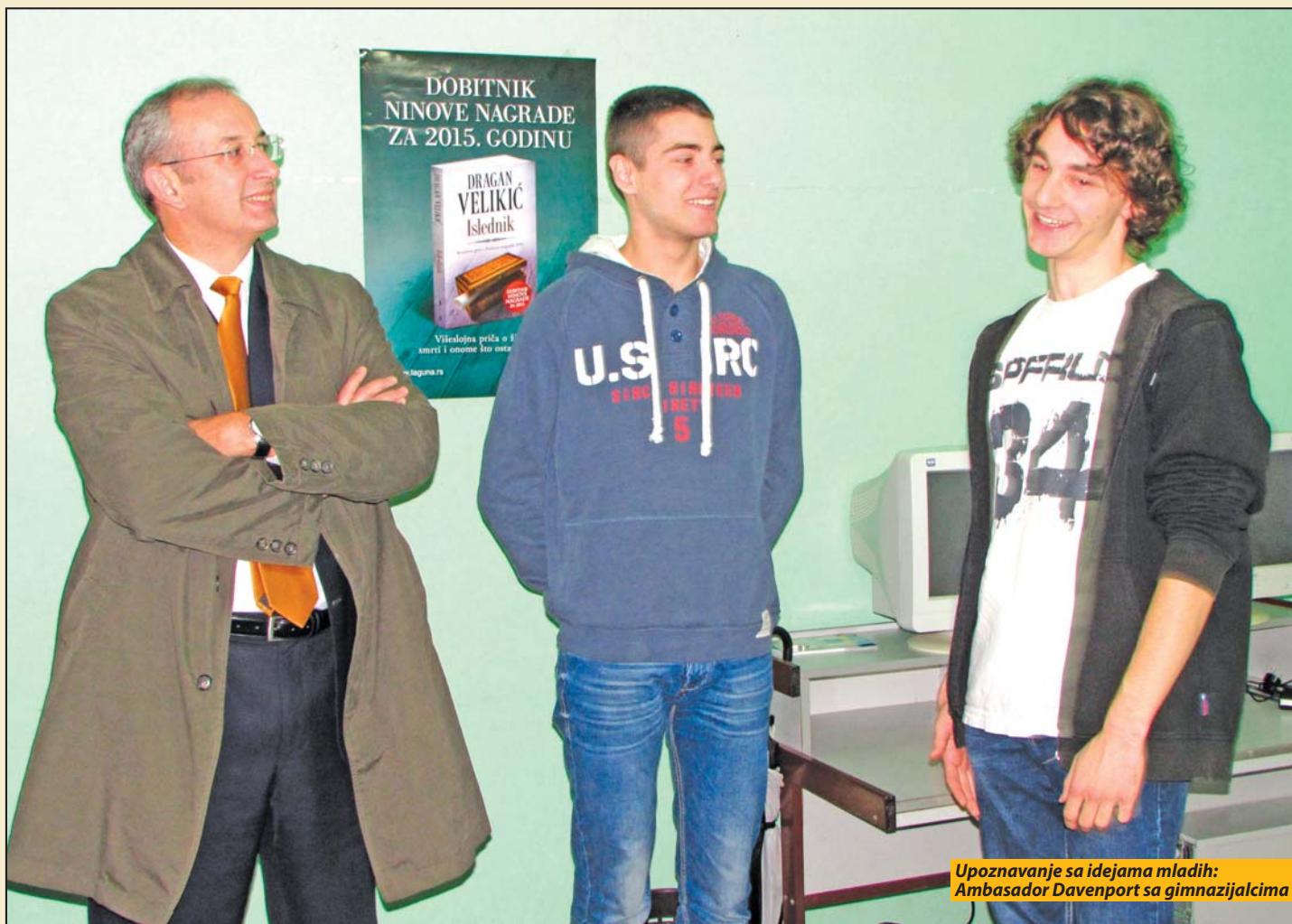
Upoznavanje sa idejama mladih: Ambasador Davenport sa gimnazijalcima

Nova Varoš - Unija srednjoškolaca Srbije podržala je putem konkursa projekat grupe od petnaest članova učeničkog parlamenta Gimnazije „Pivo Karamatijević“ u Novoj Varoši. Okosnicu projekta „Gde ja stadoh, ti produži“ čini ideja o reaktiviranju Gimnazijskog centra, otvorenog pod okriljem škole u martu 2013, koji je, međutim, godinu dana kasnije prestao da radi jer je ta namenska prostorija spajanjem smena u ovoj ustanovi pretvorena u đačku učionicu.