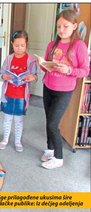
ge prilagođene ukusima šire lačke publike: Iz dečjeg odeljenja

Biblioteke su, uprkos višemesečnim problemima u poslovanju nakon smrti bivše direktorke, ipak, uspeli da značajno zanova knjižni fond, koji je tokom 2016. uvećan za blizu 1.000 naslova. Kako bi privukli čitaoce, u GB će tokom decembra prilikom učlanjenja važiti popust od oko 50 posto. Cenovnik članarine nije se