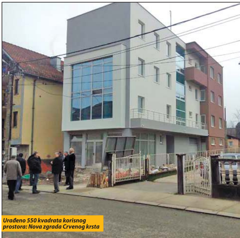
Urađeno 550 kvadrata korisnog prostora: Nova zgrada Crvenog krsta

- Ovaj objekat je vraćanje malog dijela duga prema tim ljudima i poštovanje za organizaciju staru više od jednog vijeka. Pohvale zaslužuju svi koji su radili na ovom objektu, počev od Direkcije za izgradnju i investicije, projektanta, nadzornog organa i izvođača, koji su napravili objekat koji će, osim svoje funkcionalno-