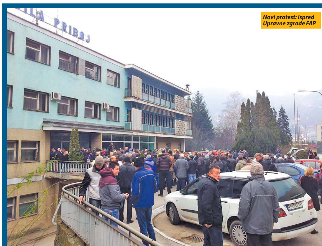
Novi protest: Ispred Upravne zgrade FAP

Radnici FAP nastavili protest i blokirali Upravnu zgradu