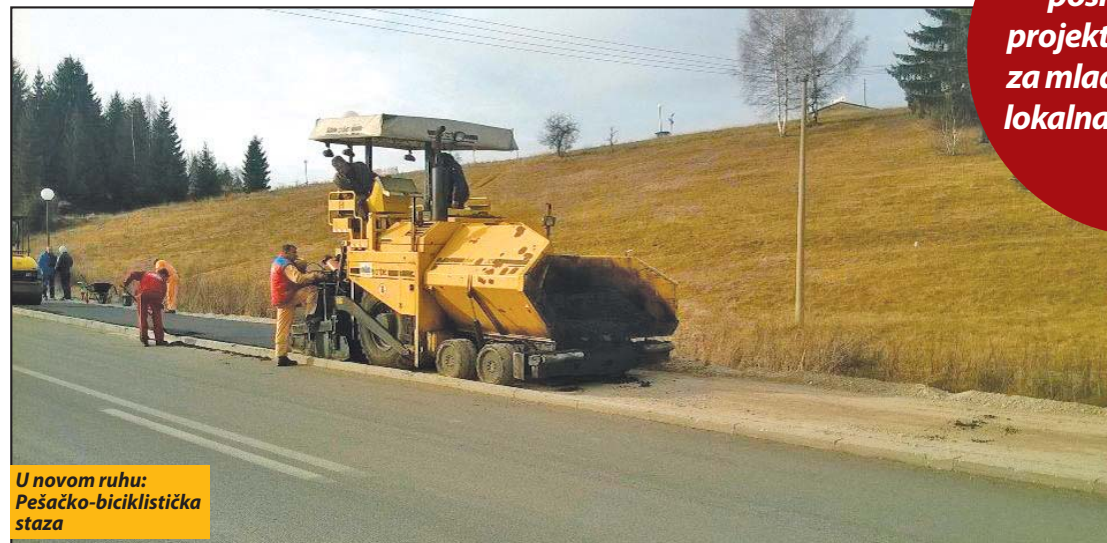
U novom ruhu: Pešačko-biciklistička staza

Mreža nevladinih organizacija za afirmaciju evropskih integracionih procesa