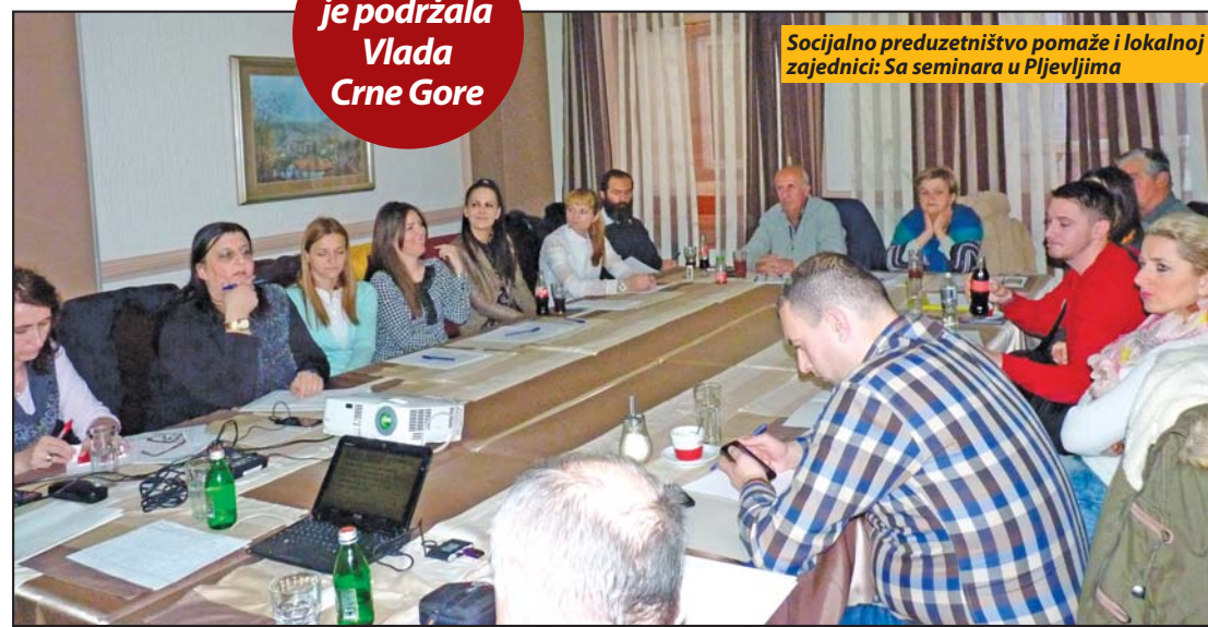
Socijalno preduzetništvo pomaže i lokalnoj zajednici: Sa seminara u Pljevljima

otvaranju novih radnih mjesta i to posebno za one koji su pripadnici najranjivijih grupa stanovništva i koji će doprinijeti smanjenju siromaštva.