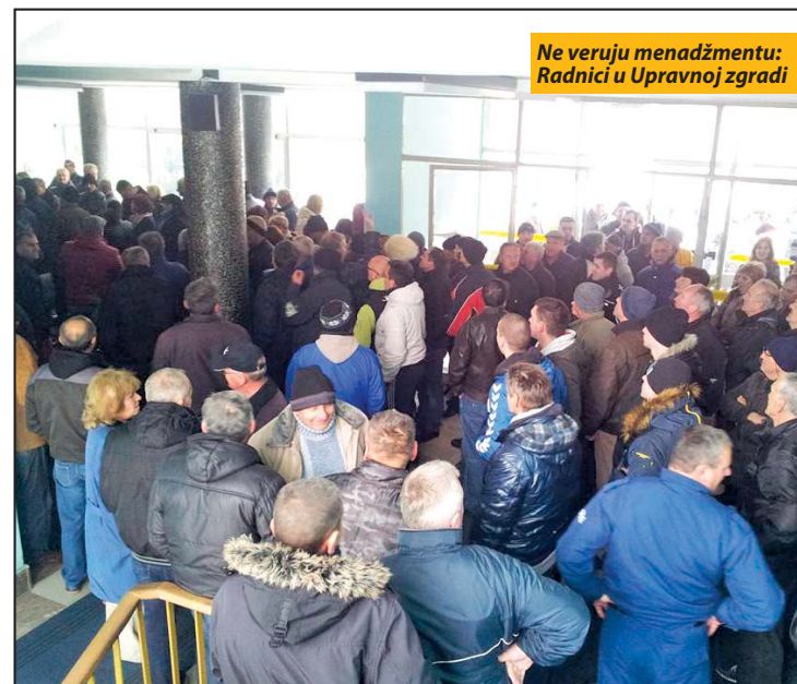
Ne veruju menadžmentu: Radnici u Upravnoj zgradi

Pošto je, preko društvenih mreža, saznao za njen uspeh i problem oko slanja rada na bijenale, predsednik opštine Priboj Lazar Rvović, ponudio je pomoć i finansiranje izlaganja na Bijenalu.