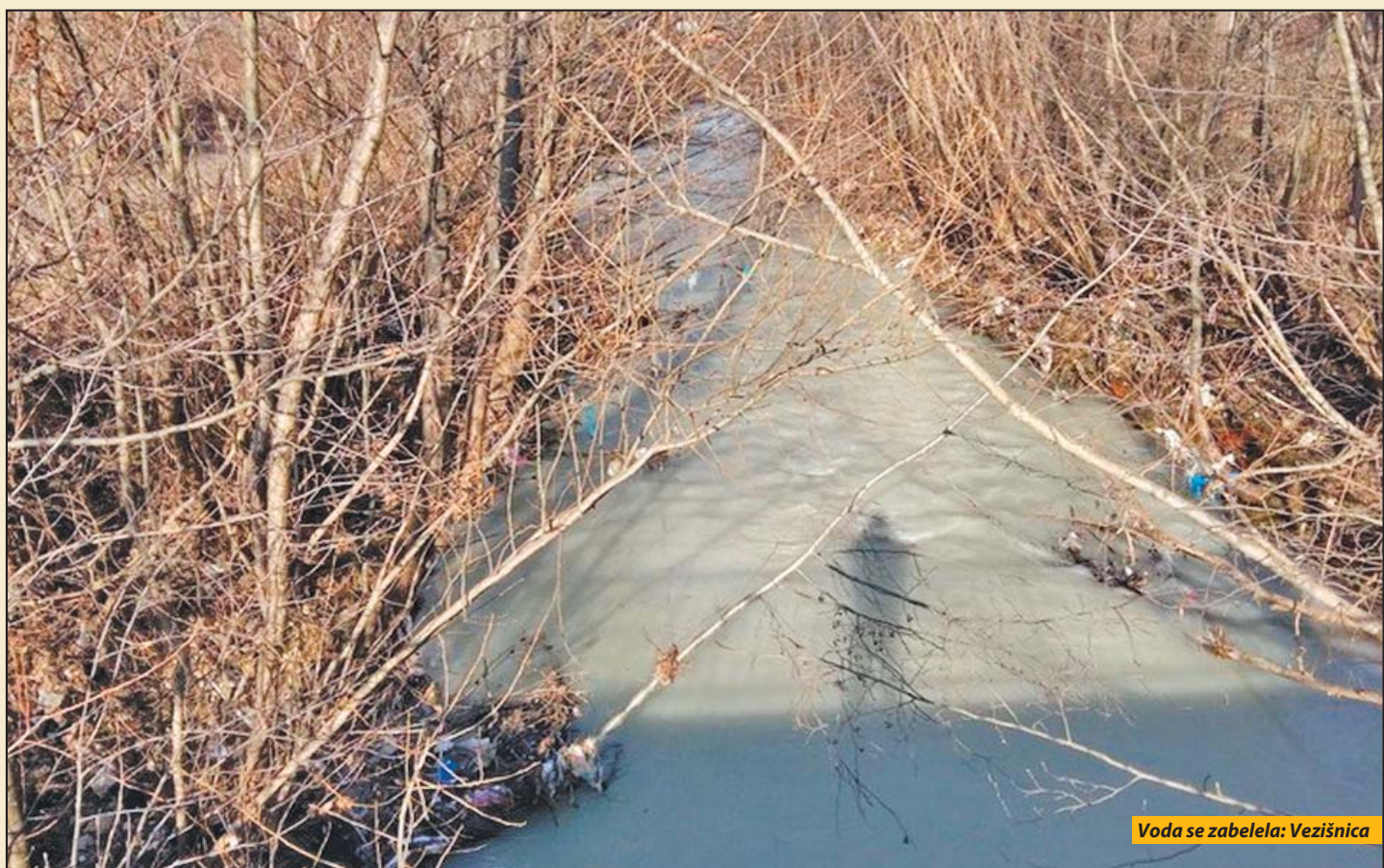
Voda se zabelela: Vezišnica

Pljevlja - I pored rekonstrukcije brane, kao i prije nekoliko godina otpadne vode iz deponije pepela i šljake Maljevac, izlile su se preko brane i ulile u Paleški potok, a potom u Vezišnicu i Čehotinu. Nakon što su ribari alarmirali javnost, nadležni iz lokalne uprave opštine Pljevlja, izašli su na lice mjesta i uvjerali se da voda u velikim količinama preljeva branu kao i da se voda izliva iz odvodnih kanala.