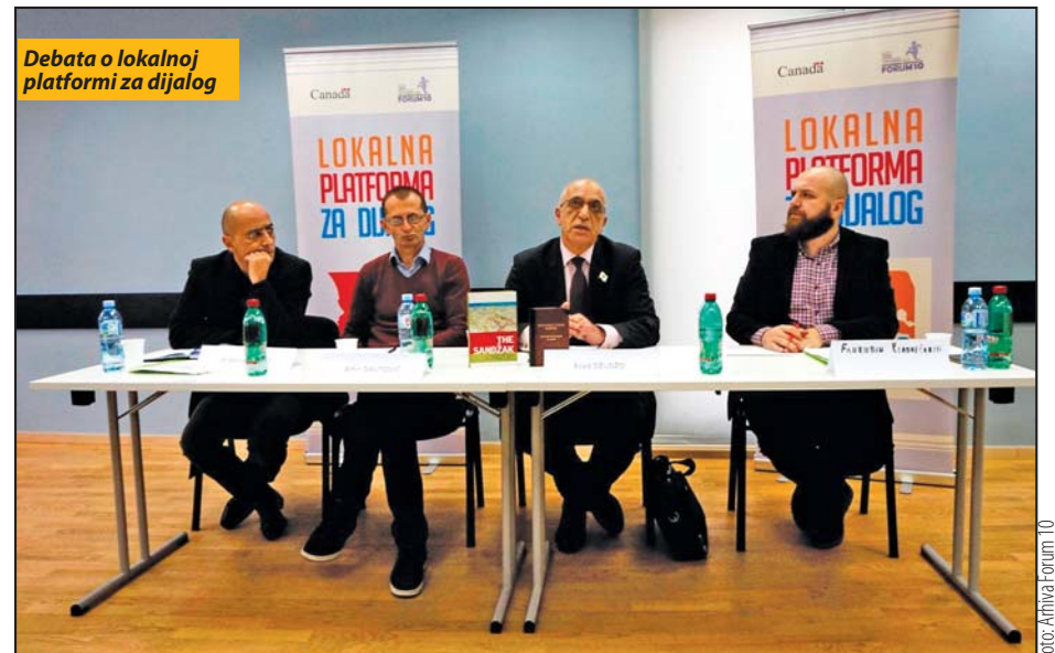
Debata o lokalnoj platformi za dijalog

- Ostaje da organizujemo još pet debata o slobodi medija i medijskom izveštavanju, socioekonomskim problemima sa kojima se susreće region, konceptu politike pomirenja, evropskim integracijama, zapošljavanju mladih i fenomenu radikalizma i ekstremizma u lokalnoj zajednici - objašnjava Kladničanin. Projekat „Lokalna platforma za dijalog“ traje devet meseci i trebalo bi da bude završen u aprilu sledeće godine, a krajnji cilj je „da se kreira prostor da se dijalog podigne na viši nivo i da bude održiv“. S. Novosele