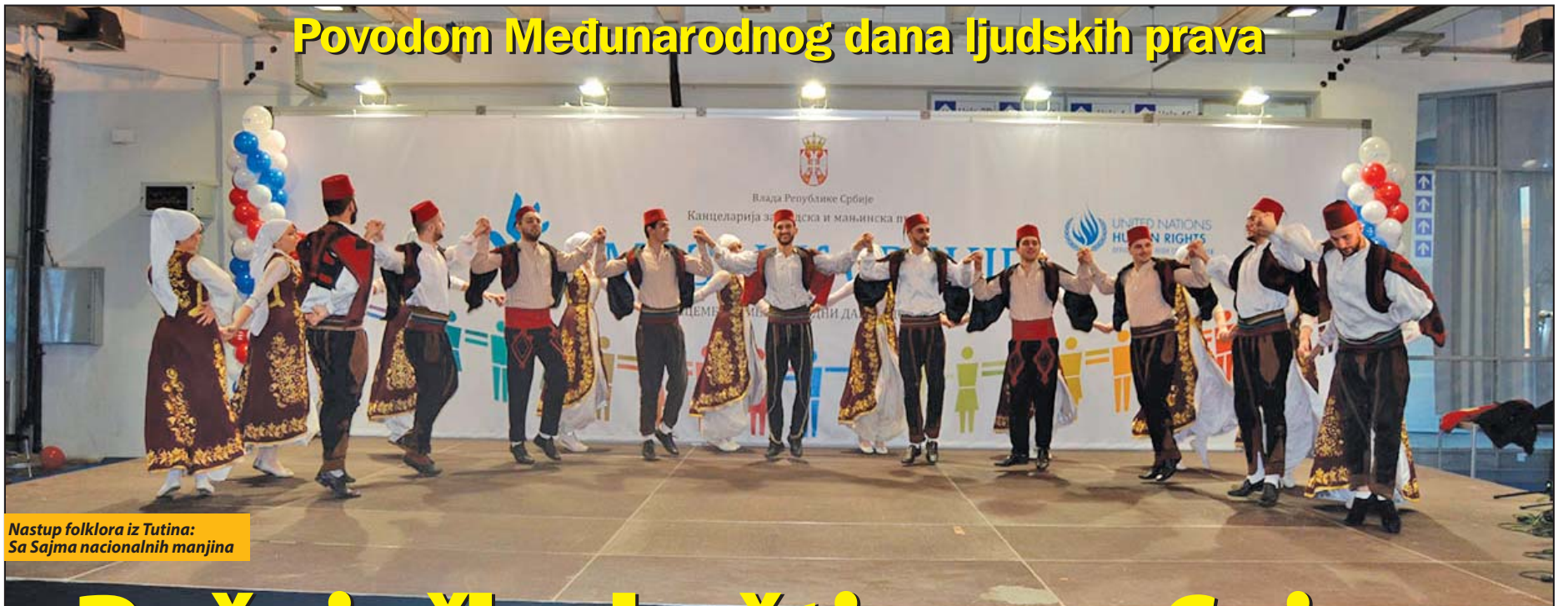
Nastup folklor iz Tutina: Sa Sajma nacionalnih manjina