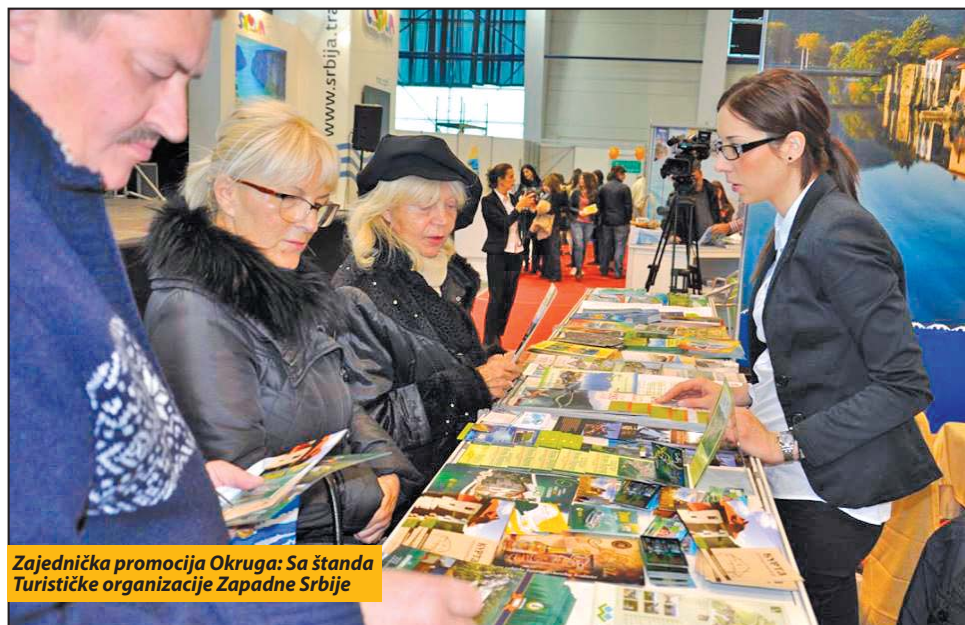
Zajednička promocija Okruga: Sa štanda Turističke organizacije Zapadne Srbije

Posetiocima trodnevnog kragujevačkog sajma predstavljena je i novina u vanpansionskoj ponudi TSC-a i hotela „Panorama“, a po potrebi i ostalih hotela i motela u opštini. „Lokalna samouprava nabavila je dva kombi vozila, od kojih će se jedan koristiti za potre-