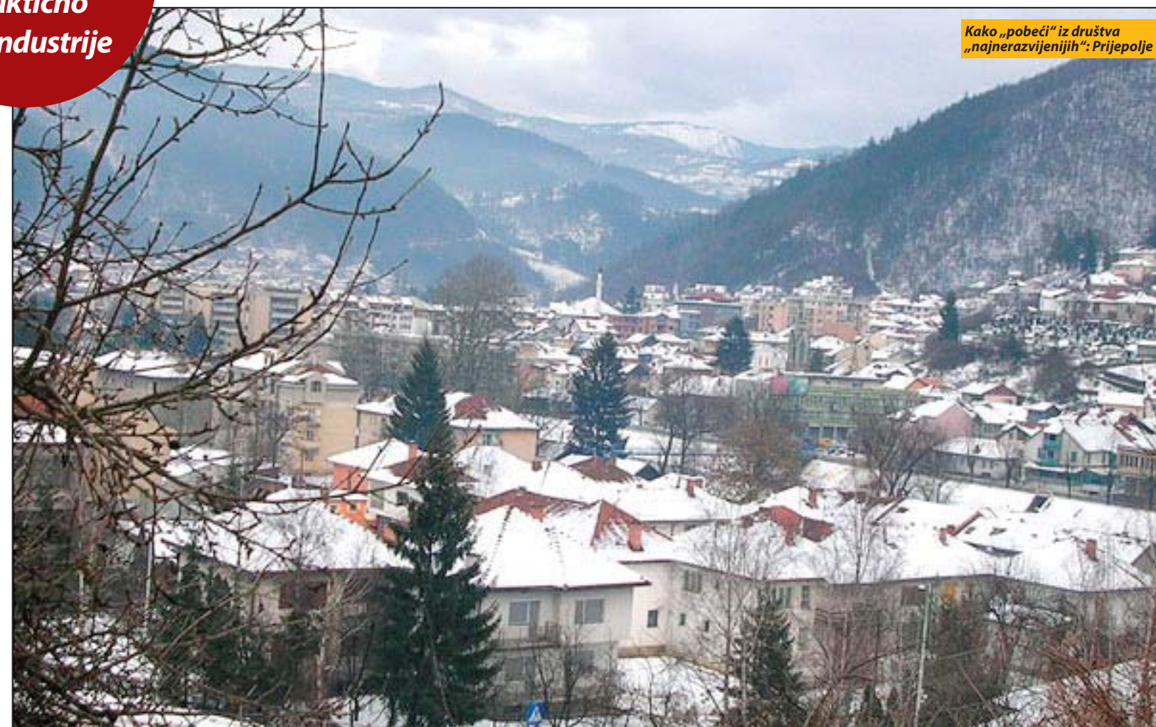
Kako „pobeći“ iz društva „najnerazvijenijih“: Prijeljske opštine