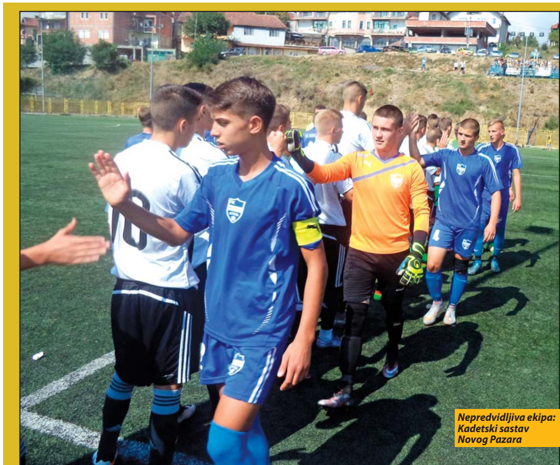
Nepredvidljiva ekipa: Kadetski sastav Novog Pazara