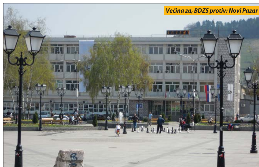
Većina za, BDZS protiv: Novi Pazar