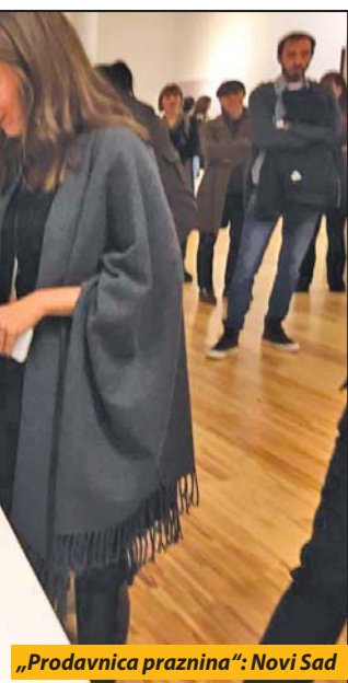
„Prodavnica praznina“: Novi Sad

11 do 18 godina. U ovom, novogodišnjem broju, „žurnalci“ postavljaju neka bitna pitanja: da li deca odrastaju sama, da li ih najviše vaspitava televizija i neadekvatni programi za njihov uzrast, da li su mobilni telefoni zamenili vršnjačko druženje, da li su roditelji „smarači“... „Žurnalci“ će vam reći zašto će Deda Mraz sigurno doći i otkriti kakvu će haljinu nositi Nova 2017. godina. Predstavljaju i najnagrađivaniju knjigu za decu „Leto kada sam naučila da letim“ Jasminke Petrović, koja je pre nekoliko godina i saradivala sa polaznicima ove male škole novinarstva i kao rezultat te saradnje su i brojni tekstovi „žurnalaca“ koji su se našli u knjizi „Prije polje iz dečjeg ugla“. A Jasminka Petrović je rekla o Žurnalcu: „Aktuelan, informativan, savremen, zanimljiv. Sve u svemu-svaka čast!“ S. D.