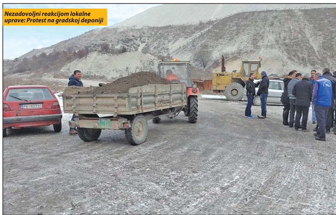
Nezadovoljni reakcijom lokalne uprave: Protest na gradskoj deponiji

Mještani MZ Crljenice su prije dvije sedmice predali peticiju Sekretarijatu za stambeno komunalne poslove saobraćaj i vode u kojoj traže hitno rješavanje problema sa psima lutalicama koji u poslednje vrijeme sve intenzivnije napadaju ljude i stoku. Ubrzo na lice mjesta izašli su predstavnici lokalne uprave, DOO Komunalne usluge i DOO Čistoća. Vule Macanović iz Sekretarijata za stambeno ko-