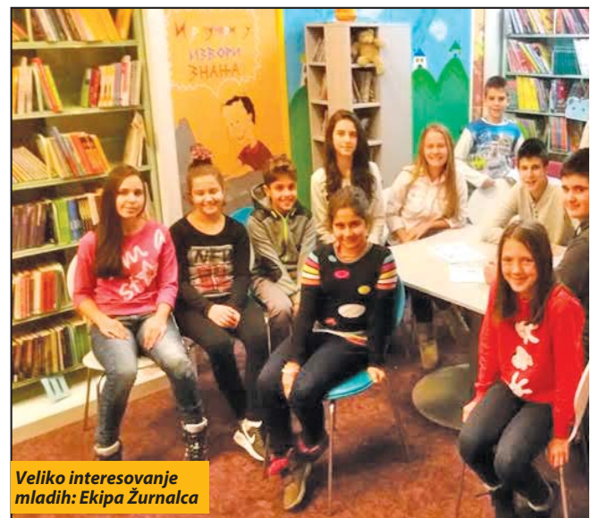
Veliko interesovanje mladih: Ekipa Žurnalca