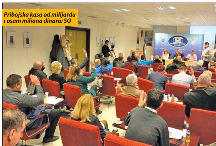
Pribojska kasa od milijardu i osam miliona dinara: SO

Na poslednjem zasedanju u ovoj godini, u toku sednice, na 18 postoje-