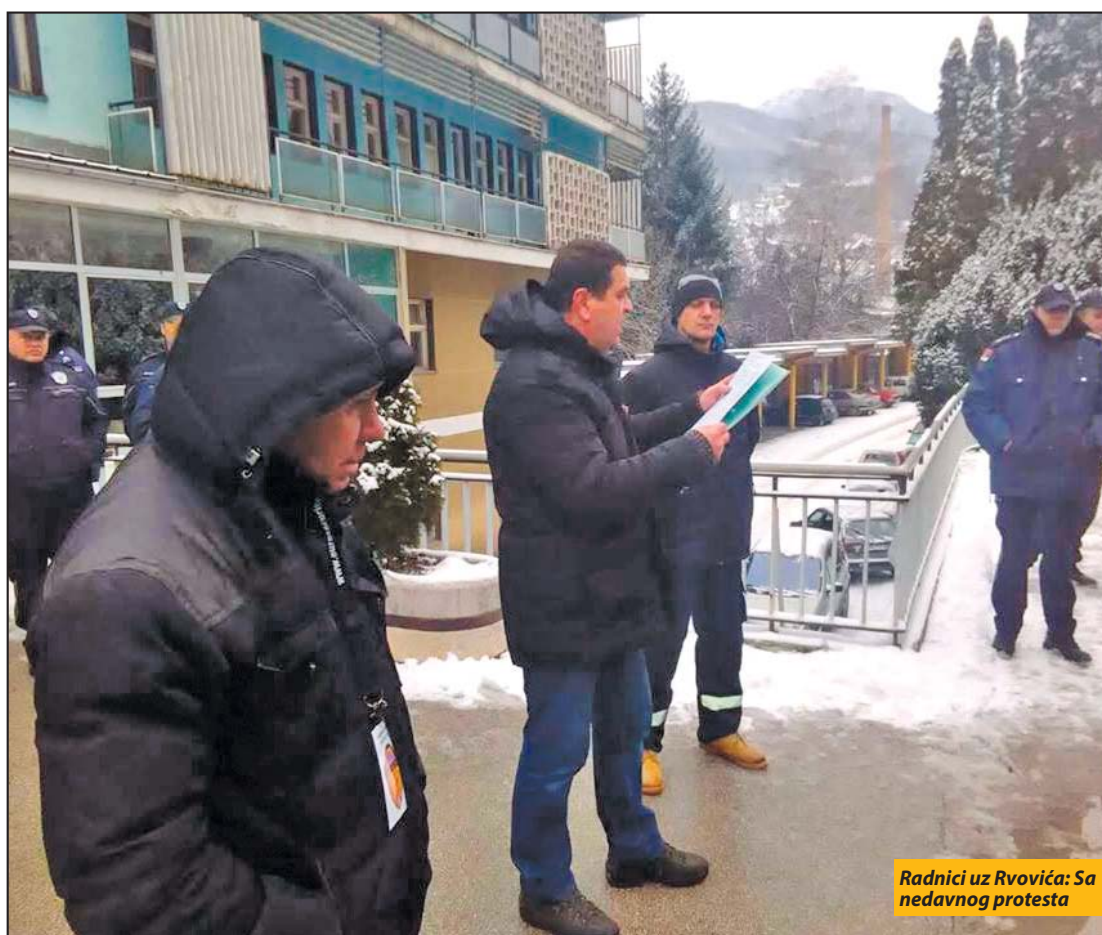
Radnici uz Rvovića: Sa nedavnog protesta