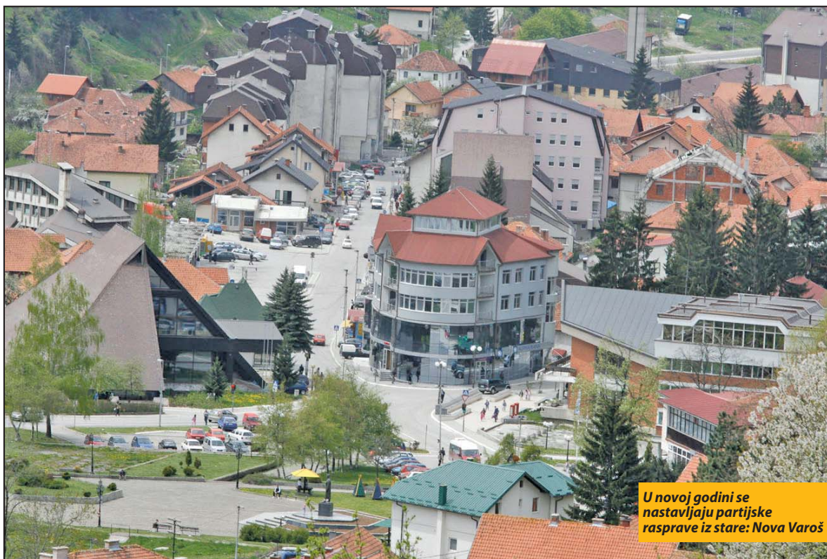
U novoj godini se nastavljaju partijske rasprave iz stare: Nova Varoš

našoj predizbornoj koaliciji ali on takođe ima pravo na svoj mandat pa može potpisivati koalicioni sporazum