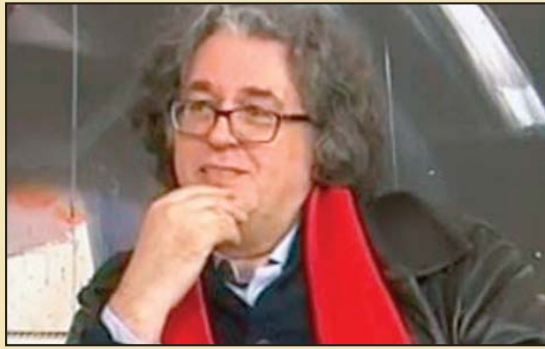
Piše: Mehmed Slezović

Bliski istok- Komplikovana bliskoistočna priča nažalost ne nagoveštava nikakva moguća razrešenja sem što postaje očigledno da orvelovski stavovi imaju sve šanse da se potvrđuju i u neposrednoj budućnosti. Dakle, po svoj prilici, to ostaje prostor sukoba i izukrštanih interesa brojnih subjekata. Rasedne linije na relaciji sunizma i šiizma zasad govore o iranskom povećanom uticaju u regionu. Kakve će to sve posledice imati, ostaje da se vidi. Što se Amerike tiče, čini se da nije izvukla nikakve pouke iz višedecenijske ratne politike sa islamom. Ako Tramp upućuje pretnje Iranu i nagoveštava moguće napade na ovu zemlju, nastoji da pošalje kao svog