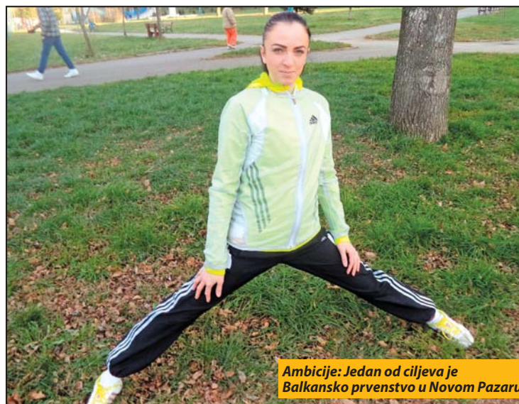
Ambicije: Jedan od ciljeva je Balkansko prvenstvo u Novom Pazaru