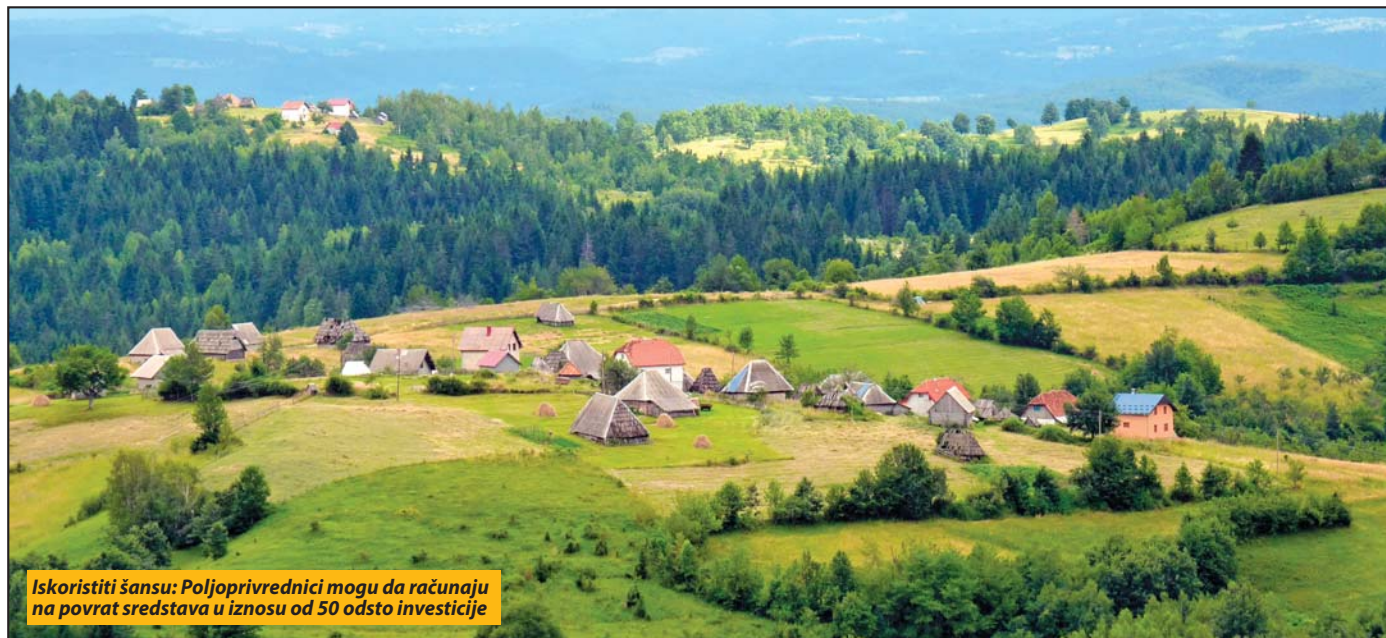
Iskoristiti šansu: Poljoprivrednici mogu da računaju na povrat sredstava u iznosu od 50 odsto investicije

Pljevlja - Predstavnici Ministarstva poljoprivrede i ruralnog razvoja počeli su sa predstavljajanjem projekta „IPARD like 2.2“ po crnogorskim opštinama. Presentacija za potencijalne korisnike sa područja pljevaljske opštine održana je u utorak u sali Skupštine opštine Pljevlja.