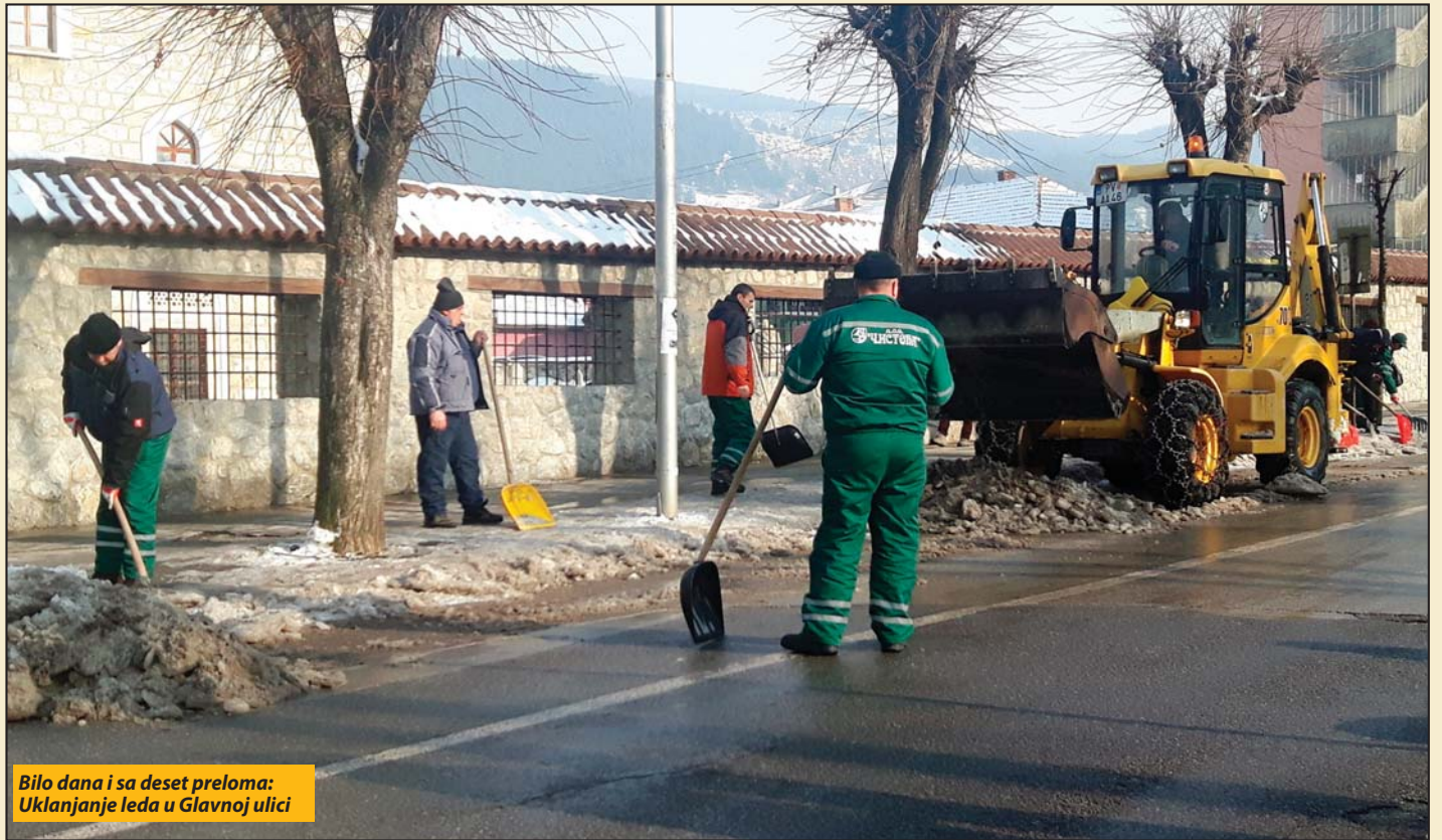
Bilo dana i sa deset preloma: Uklanjanje leda u Glavnoj ulici

Pljevlja - Na hirurškom odjeljenju opšte bolnice u Pljevljima zbrinuto 160 povreda, od čega 35 preloma. Niske temperature tokom januara stvorile su brojne probleme Pljevljancima. To se vidi po činjenici da je za prvih 20 dana, zbog povreda koje su zadobili padom na ledu zbrinuto 100 pacijenata, a da je 35 njih prilikom pada zadobilo prelome. Urađene su 32 manje i veće operativne intervencije. Kako su saopštili iz pljevaljske bolnice najviše je bilo preloma nogu i ruku, a bilo je i drugih povreda.