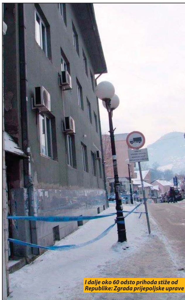
I dalje oko 60 odsto prihoda stiže od Republike: Zgrada prijepoljske uprave

„Lista“ kapitalnih izdataka je povelika i sadrži čak 96 stavki, koje će biti pokrivene sa 282 miliona dinara, ukoliko se plan ostvari. Apsolutno najveća investicija je izgradnja puta Kolovrat-Seljašnica za šta je planirano da se uloži