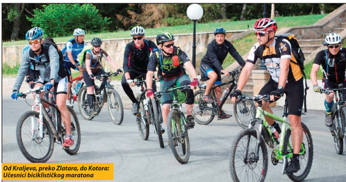
Od Kraljeva, preko Zlatara, do Kotora: Učesnici biciklističkog maratona

Lokalna samouprava aplicira za sredstva od oko 2,8 miliona evra, koja bi trebalo da investira u izgradnju nove toplane i rekonstrukciju gradske toplotne mreže