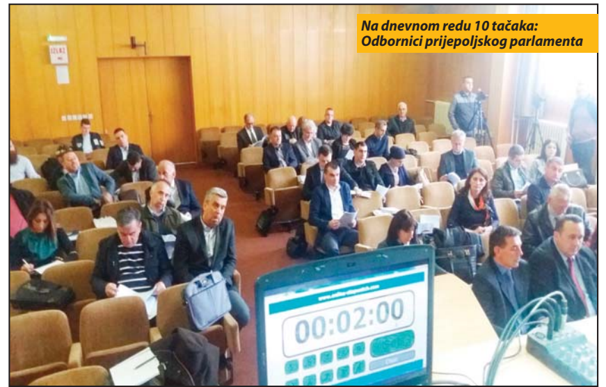
Na dnevnom redu 10 tačaka: Odbornici prijepoljskog parlamenta

Na desetom zasjedanju, odbornici će razmatrati izvještaje o radu Opštinske uprave i Opštinskog veća u 2016. godini kao i informacije o stanju privrede u 2016. i problemima