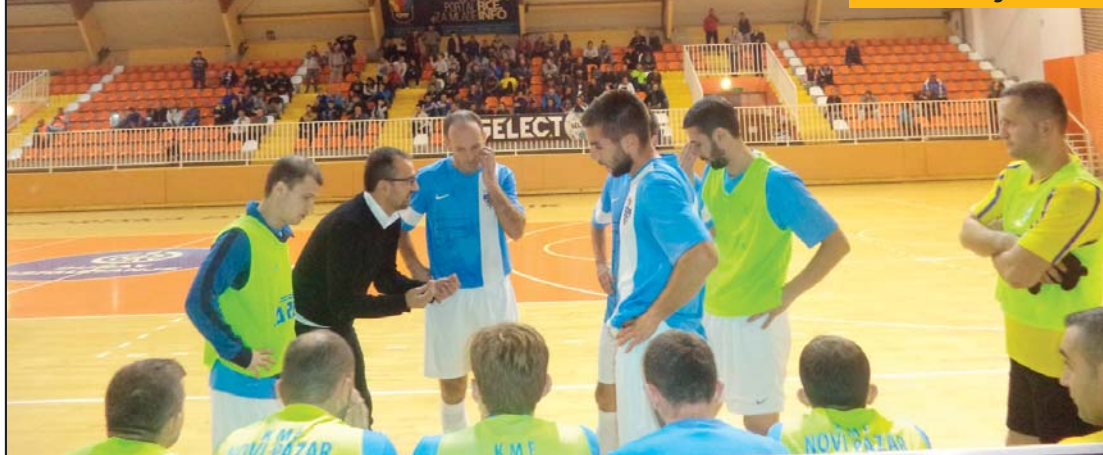
Zaustavili ih Kragujevčani: Futsal tim Novog Pazara