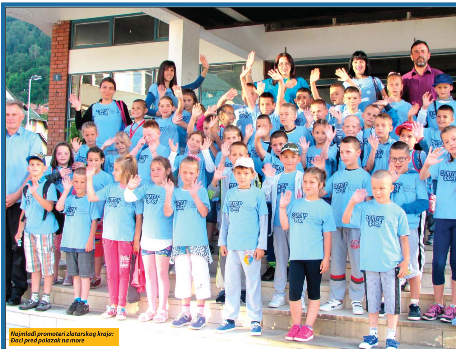
Najmlađi promoteri zlatarskog kraja: Đaci pred polazak na more

Pedesetak novovaroških prvaka otputovalo na crnogorsko primorje