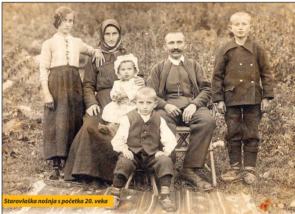
Starovlaška nošnja s početka 20. veka

Sudeći prema odličnom odzivu, naši sugrađani, kao i Novovarošani rasuti širom matice i rasejanja, sa blagonaklonošću su dočekali javni poziv Biblioteke i sa puno entuzijazma počeli da preturaju i prebiraju po porodičnim albumima, ormanima,