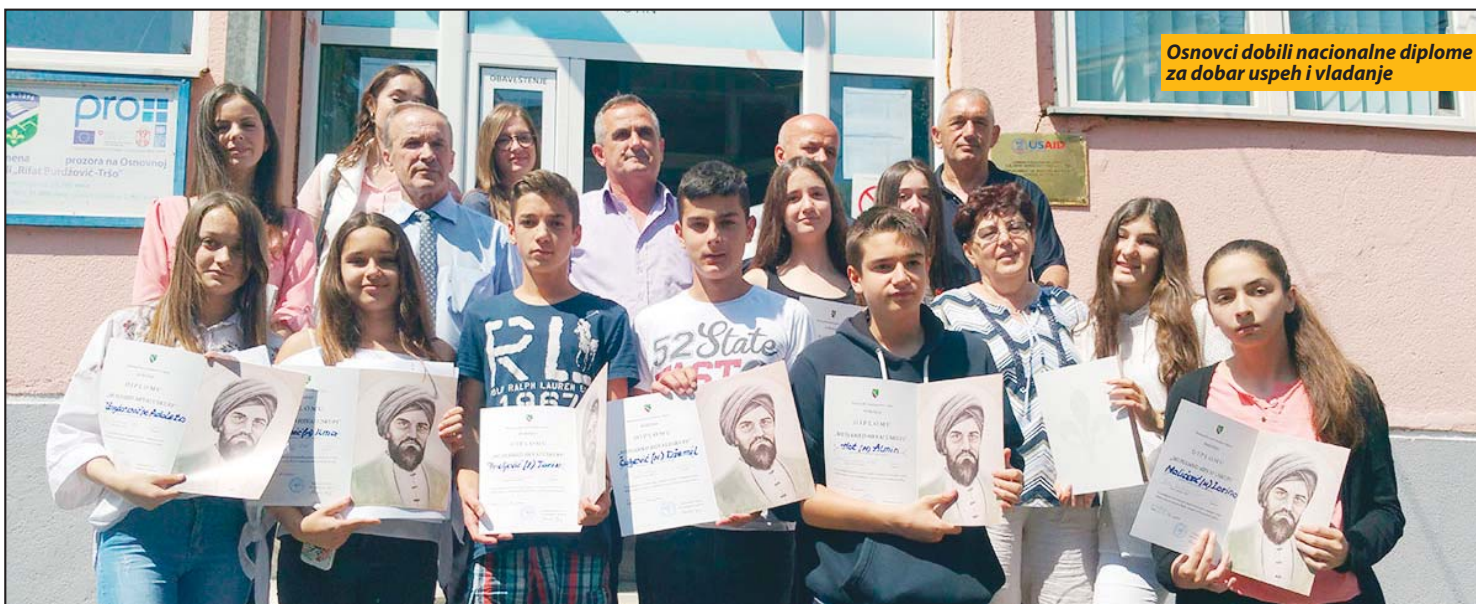
Osnovci dobili nacionalne diplome za dobar uspeh i vladanje

Priznanja BNV dodeljena su osnovnim školama „Avdo Međedović“ u Novom Pazaru, „Rifat Burdžović Tršo“ u Tutinu i „12. decembar“ u Sjenici. Osnovno obrazovanje na bosanskom jeziku završilo je 1.532 učenika u ove tri opštine. Prethodno je nacionalne diplome dobilo osamdesetak učenika Gimnazije koji su srednjoškolsko obrazovanje završili na bosanskom jeziku. Obrazovanje na bosanskom jeziku, u san-