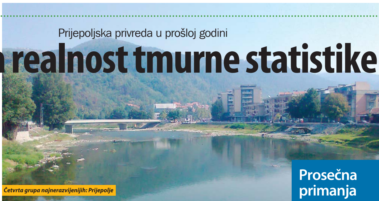
Četvrta grupa najnerazvijenijih: Prijepolje

Lična primanja zaposlenih zaostaju oko 32,4 odsto za republičkim prosekom. Poljoprivreda beleži rast kao i prerađivačka industrija, pre svega, zahvaljujući razvoju malinarstva. Broj zaposlenih je još uvek bolno pitanje, kao i broj nezaposlenih. Privatizacija neka-