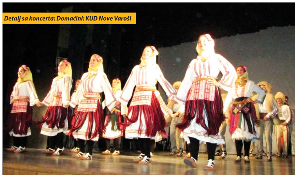
Detalj sa koncerta: Domaćini: KUD Nove Varoši

■ Na petoj po redu manifestaciji učestvovalo više od 200 igrača iz Arilja, Ivanjice, Prijepolja, Sjenice i Nove Varoši