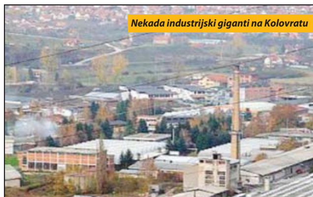
Nekada industrijski giganti na Kolovratu

dašnjih društvenih firmi je bila katastrofalna (uspešnost manja od 10 odsto), a ceo proces je u zastoju i stoji zaključani objekti Irisa, Hotela Mileševa, Poljoproducta, Putnika. To bi bilo „ukratko“. Analitičniji prikaz pokazaće da je tendencija iseljavanja u direktnoj vezi sa nedostatkom posla, malim primanjima, što čini da se trenutno može govoriti o procenama žitelja ove opštine da neke perspektive za bolji život i standard nema. Barem ne u dogledno vreme, a „dogledno vreme“ za jedan ljudski život je, uglavnom, kratko.