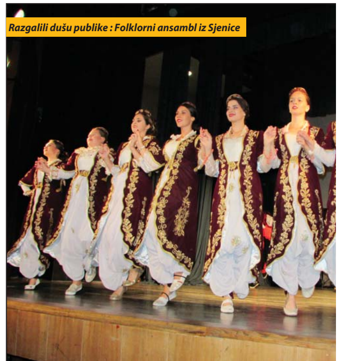
Razgalili dušu publike: Folklorni ansambl iz Sjenice

stavili deo bogate kulturne baštine inspirisane izvornim narodnim stvaralaštvom. Folklorci KUD-a Doma kulture iz Ivanjice, društva sa tradicijom dugom preko tri i po decenije, domaćoj publici su se predstavili koreografi-