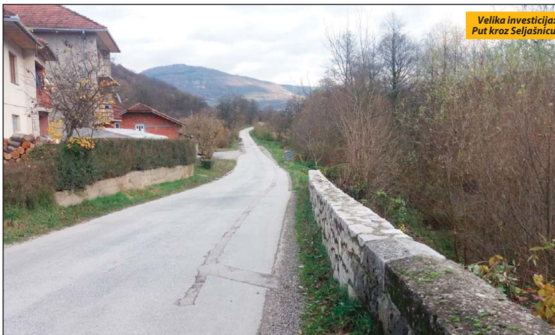
Velika investicija: Put kroz Seljašnicu