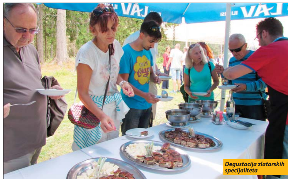
Degustacija zlatarskih specijaliteta

U konkurenciji za najbolji kotlić učestvovala su tri ekipe, od kojih su dve iz grada na Đetinji i jedna iz Nove Varoši. „Planinski alasi“, iako malobrojni, dali su, ipak, sve od sebe da baš njihova čorba, riblja, teleća i pileća ponese titulu najpikantnije i najukusnije. Osim poznatih sastojaka - ribe odnosno ostalih vrsta mesa, začina, paprike, luka, gljiva i drugog raznorodnog povrća, novopečeni majstori kažu i da je potrebna bistra zlatarska voda, malo belog vina, par kapi maslinovog ulja, ali i puno ljubavi prema kuvanju. „Što više okretanja u kazanu, što više ljubavi - to je re-