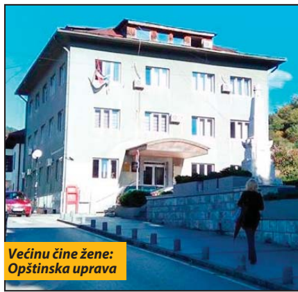
Većinu čine žene: Opštinska uprava

Prijepolje - Prema Odluci o Opštinskoj upravi iz 2009. godine poslovi iz njene nadležnosti organizovani su u prijepoljskoj opštini kroz odeljenja za urbanizam, građevinarstvo, komunalno-stambene i imovinsko pravne poslove; za privredu, budžet i finansije; za lokalni ekonomski razvoj; za društvene delatnosti i opštu upravu i za lokalnu poresku administraciju. Na kraju 2016. godine u Opštinskoj upravi bilo je 69 stalno zaposlenih i sedam na određeno vreme. Najviše zaposlenih ima visoko obrazovanje (34), a od sedam angažovanih na određeno vreme njih šest imalo je završen fakultet. Sa srednjom školom poslove obavlja 30 zaposlenih, pet sa višom, daktilografski kurs imaju četiri zaposlena, dva završenu osnovnu školu, a jedan je kvalifikovani radnik. Zanimljivo je da od 69 stal-