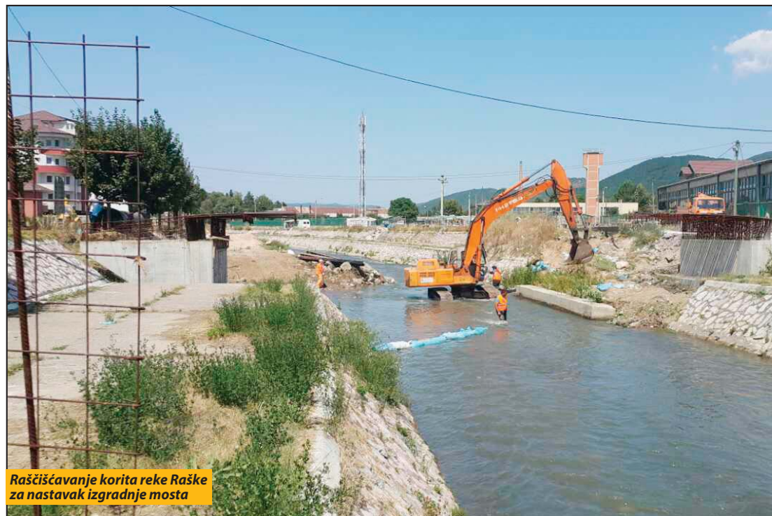
Raščišćavanje korita reke Raške za nastavak izgradnje mosta

Kad činovičnik olovka podvuče, stanje za navek ostaje nepromenjeno. Pohrli narod da legalizuje ono što „od pamtiveka“ postoji, da ispoštuje državu. Da toga ne bi, svi bi ostali u neznanju da je čaršija jedno veliko poljoprivredno dobro. Onde jabučar, onamo šljivici, malo dalje vinogradi, iza njih se prostiru livade i utrine. Ispada da su ljudi u ovoj čaršiji „vekovali“ na granama raznih voćki, ispod listova vinove loze, na livadama i oranicama. Nigde kuća i zgrada. Tako kažu činovičnik spisi, a za život na grani mora da se plati porez na kuću ili stan, plus ekološka taksa (zaštita života na grani). Plati, pa dokazuju da ceo život živiš u svojoj kući, da ideš ulicama, a ne između šeftelija, divljaka, đula, trešanja, višanja, bostana, požegača, luka od svake vrste, tikava... Ono što je činovičnik olovka „zarežala“ treba mnogo para i hoda da se „odreže“. E, dok se dokazuje da postojiš i da živiš u kući a ne na grani, glavni „kulturni događaj“ leta je koncert poznate pevaljke sumnjivih pevačkih kvaliteta i drčnog ponašanja. Glas ni nalik slavuju odjekivao je kroz čaršijske šljivike i livade. S. N.