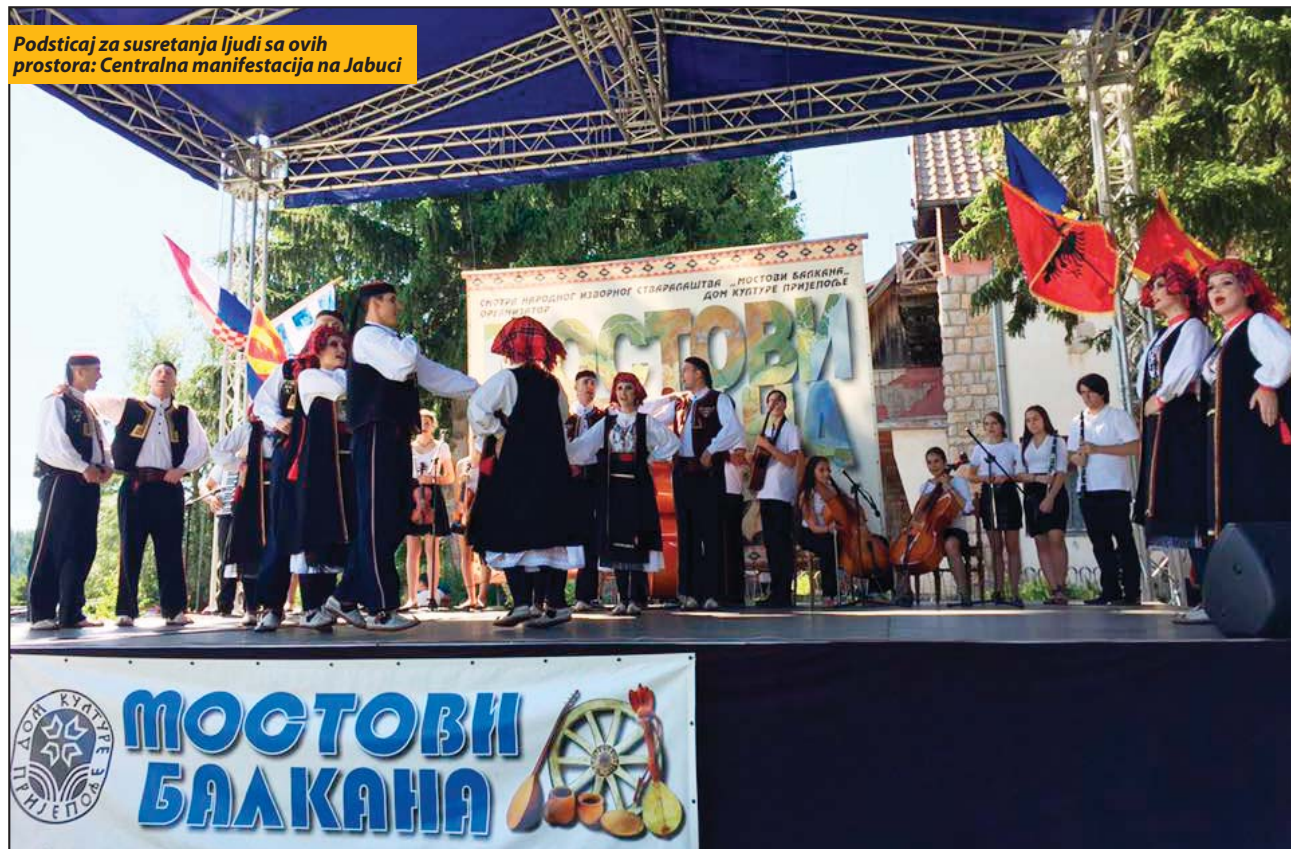
Podsticaj za susretanja ljudi sa ovih prostora: Centralna manifestacija na Jabuci