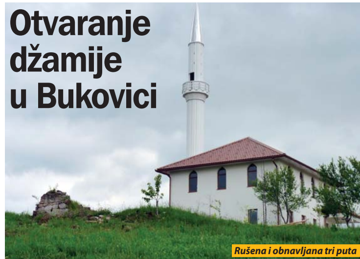
Rušena i obnavljana tri puta

Pljevlja - U selu Raščići, MZ Bukovica, pored Pljevalja za sutra je najavljeno svečano otvaranje džamije, porušene tokom rata u susednoj BiH. Očekuje se prisustvo reisa Islamske zajednice u Crnoj Gori Rifata ef. Fejzica i reisu-l-uleme Islamske zajednice u BiH Huseina ef. Kavazovica. Ova džamija je tri puta rušena i podizana.