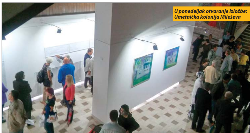
U ponedeljak otvaranje izložbe: Umetnička kolonija Mileševa