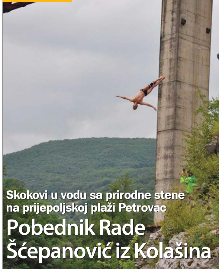
Vreme pokvarilo doživljaj: Skokovi u Lim

Skokovi u vodu sa prirodne stene na prijepoljskoj plaži Petrovac