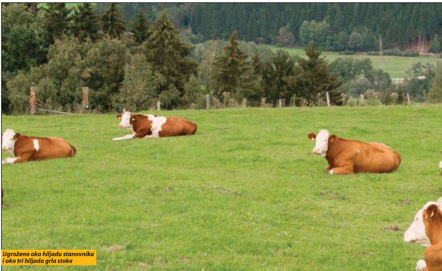
Ugroženo oko hiljadu stanovnika i oko tri hiljada grla stoke