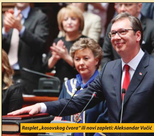
Rasplet „kosovskog čvora“ ili novi zapleti: Aleksandar Vučić

„Priznanje kosovske nezavisnosti će otvoriti put i secesiji Sandžaka i Vojvodine“, jedna je od ustaljenih političkih referenci protiv kosovske nezavisnosti. Istina je da se sandžačka regija graniči sa Kosovom, pa se ne može reći da se ovo pitanje ne tiče i Bošnjaka u Sandžaku. Tiče ga se i te kako, a istorijska pamćenja još i danas snažno opterećuju bošnjačku političku svest i svekolike nacionalno-kulturne i identitetske perspektive. O čemu je reč? Javnosti je poznat slučaj sa postavljanjem spomen ploče Aćifu Bljuti, u Novom Pazaru, zagovorniku ideje i projekta „Velike Albanije“, koja obuhvata ako ne ceo, ono veći deo Sandžaka. Dakle, radi se o isto-