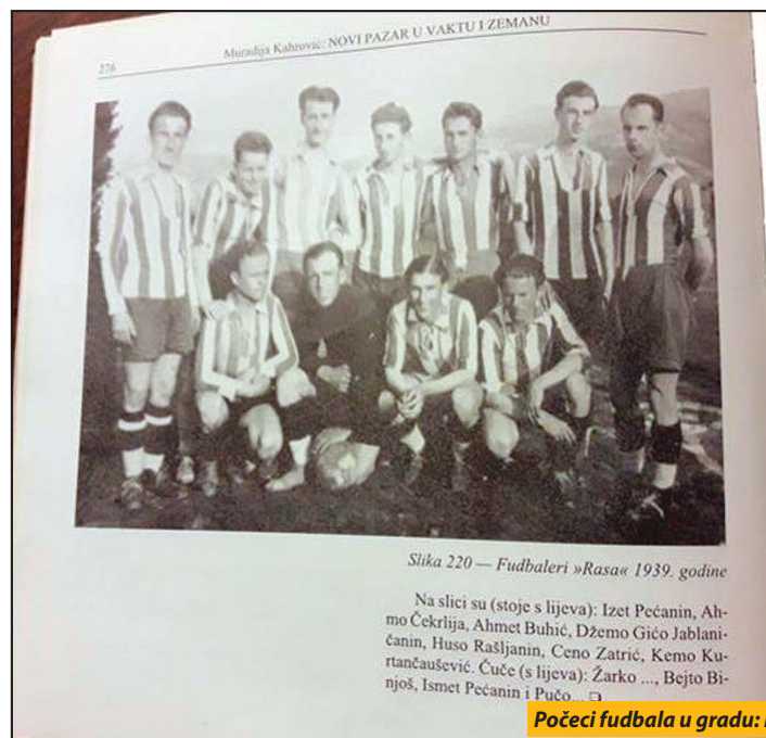
Slika 220 — Fudbaleri »Rasa« 1939. godine