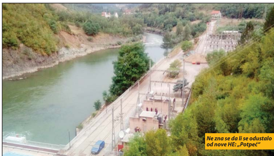
Ne zna se da li se odustalo od nove HE: „Potpeć“

Još uvek nije poznato da li izvođenje ovog projekta ukazuje na to da se odustalo od hidroelektrane „Rekovići“, u Priboju ispod FAP-ovog pogona „Montaža“, protiv čije izgradnje su protestovali građani Priboja. Katastarske parcele koje se pominju u rešenju nalaze se nizvodno od sadašnje HE „Potpeć“, u njoj su neposrednoj