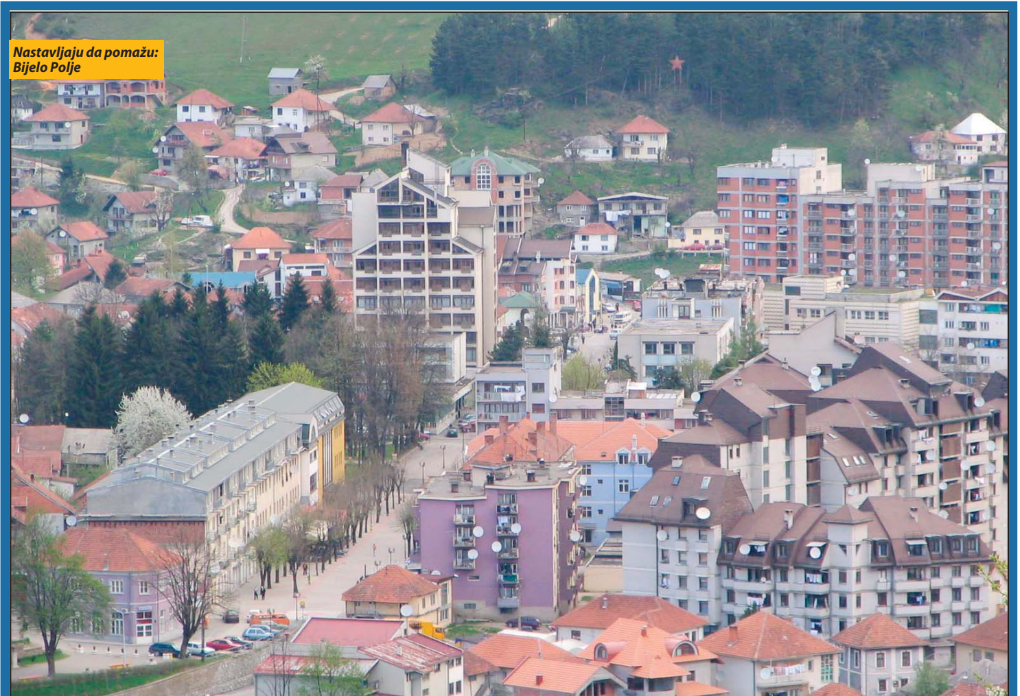
Nastavljaju da pomažu: Bijelo Polje