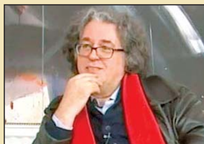
Piše: Mehmed Slezović

Kosovo „najskuplja srpska reč“ i „grdno gubilište“, prostor zbog kojeg je načinjen izbor za „carstvo nebesko“, rečju mitos i etos srpskog naroda, ali i tabu tema o kojoj se nauka samo donekle dotakla, dok ju je politike sklonila sa javne scene u kuoloare ekskluzivnih i nepristupačnih nacionalnih programa. U stvarnosti, sve vreme još od 1912. pa i pre vremena dveju Prizrenskih liga, prostor sukoba dve etničke zajednice. Bili smo iznenađeni studentskim nemirima nakon Titove smrti i parolama „Kosovo republika“, bili smo iznenađeni i potonjim dešavanjima kojih je krajnji rezultat država Kosovo, koju je već priznao pozamašan broj zemalja i kako jedan od učesnika javnog dijaloga reče: „Srbija ne broji više zemlje koje su priznale Kosovo, već one koje to nisu“.