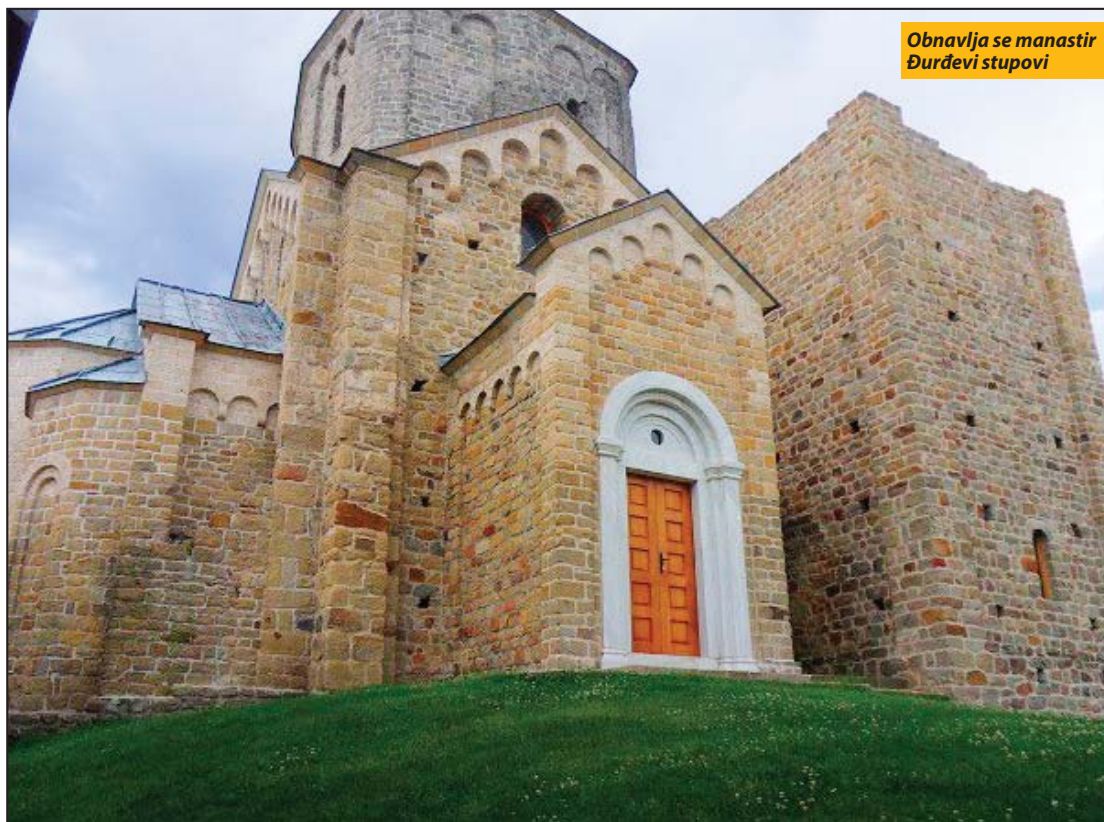
Obnavlja se manastir Đurđevi stupovi