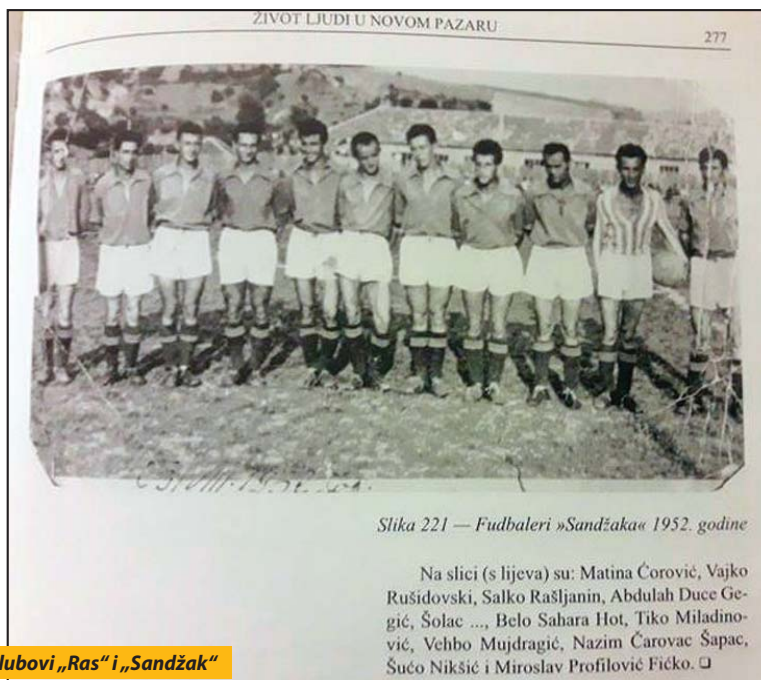
Slika 221 — Fudbaleri »Sandžaka« 1952. godine

Počeci fudbala u gradu: Klubovi „Ras“ i „Sandžak“