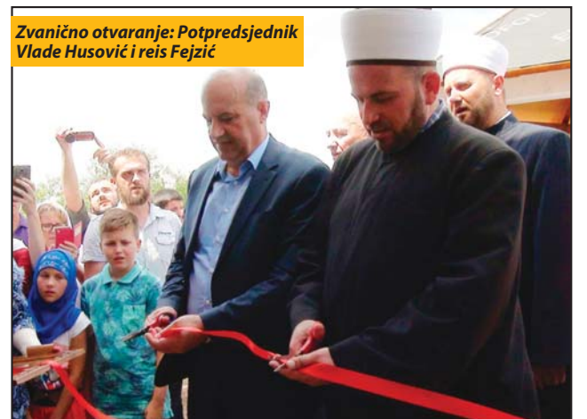
Zvanično otvaranje: Potpredsjednik Vlade Husović i reis Fejzić

Reis Islamske zajednice u Crnoj Gori Rifat ef. Fejzić je zahvalio Bukovičanima na velikom prisustvu i čestitao Odboru Islamske zajednice. Obnova i otvaranje ove džamije je, po njegovim riječima, „svečani momenat za demokratiju u Crnoj Gori i za pravdu, koja je često bila