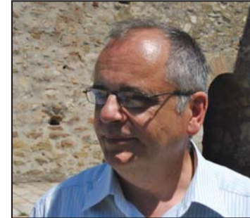
Овогодишњим дефилеи наставио да цела манифестација поприми изглед карневала: Браца Мартић

У суботу увече на Градском тргу заказан је концерт хора Вива Воц који певају обраде светских хитова, док ће у Малом граду бити концерт „Сме-