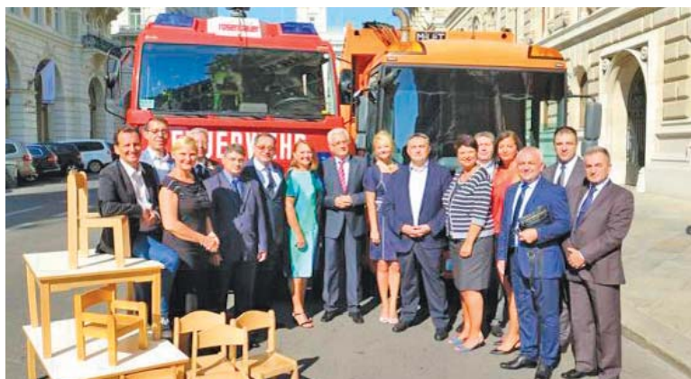
Nakon poplava pomogli brojni evropski gradovi: Donacija Beča

„U poslednje četiri godine u infrastrukturu opštine Svilajnac investirano je oko tri milijarde dinara, što je pet puta više nego u periodu od pre deset i više godina. U Svilajncu je kompletno rekonstruisano šest škola, modernizovani su i obnovljeni Centar za kulturu, Resavska biblioteka, sredena je zgrada opštine Svilajnac, asfaltirano je više desetina kilometara ulica, kako u gradu tako i u selima, na kojima su urađene i nove vodovodne i kanalizacione cevi, trotoari, biciklističke staze, zatim uređeni su parkovi, igrališta, rekonstruisana je sportska hala, uređena gradska pijaca koja je po prvi put i pokrivena, Svilajnac danas ima potpuno novi vrtić nakon poplave, izgrađena su dva nova mosta, rekonstruisano ih je tri u gradu, obe industrijske zone su infrastrukturno opremljene, rekonstruisano je odeljenje fizijatrije Doma zdravlja Svilajnac, kao i dve seoske ambulante i urađeno je još mnogo projekata. Sve ovo govori u prilog tome da građani Svilajнца danas žive u lepšem i uređenijem gradu. Napisali smo veliki broj projekata, vredno radili i uspeli smo da za navedene projekte obezbedimo sredstva, neka iz Kancelarije