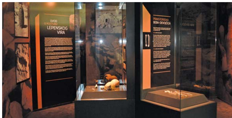
„Bioarheologija Đerdapa“ predstavlja kulturu Lepenskog vira i do sada nije izlagana van Filozofskog fakulteta Univerziteta u Beogradu

Opština Svilajnac uspešno je rešila i problem neuspešne privatizacije, pa je tako kupila pogon bivše fabrike BEKO u Svilajncu, i ubrzo zatim našla novog investitora, beogradsku kompaniju „Union drvo“. „Ova kompanija zapošljava pedeset ljudi, razvili su i opremlili u