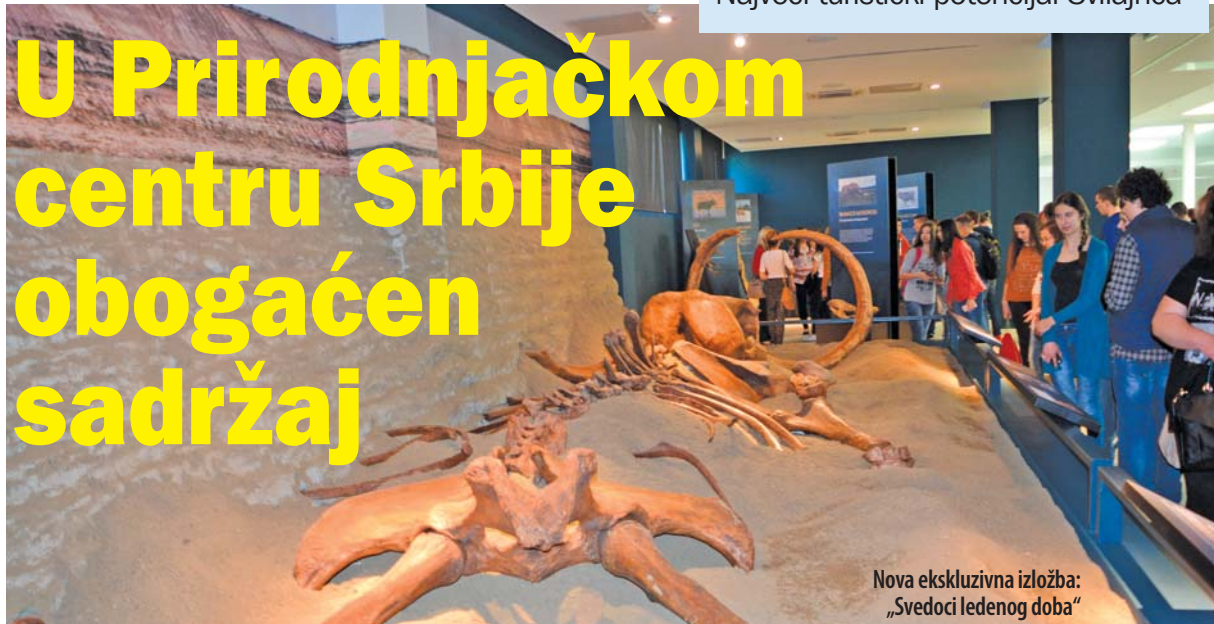
Nova ekskluzivna izložba: „Svedoci ledenog doba“

P rirodnjački centar Srbije u Svilajncu jedinstvena je naučno-obrazovna institucija u Srbiji i ovom delu Evrope, koja kroz spoj nauke, obrazovanja i turizma radi na popularizaciji prirodnih nauka i promociji naučnog turizma. Sadržaj Prirodnjačkog centra Srbije čine izložbe koje do sada nisu viđene u našoj zemlji na ovaj način.