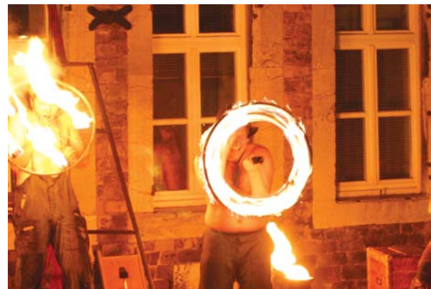
- LET IT BURN - 50 do 60 minuta; UTORAK, 17. jula u 23 sata; Gradski trg;