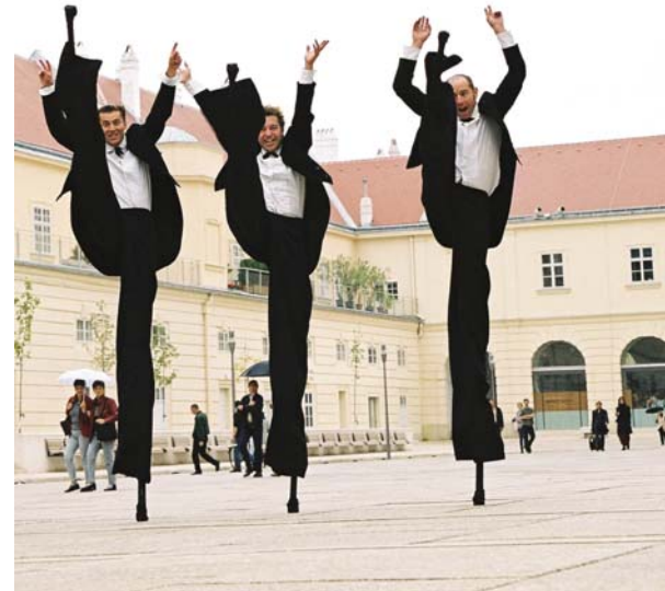
- WEGENSTREITS GUEST - 35 do 40 minuta; SREDA, 18. jula u 19.30 sati, Gradski trg;