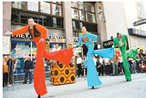
- NUJORK DENZING KWIIN - predstava traje 40 do 45 minuta; PONEDELJAK, 16. jula u 19.30 sati, Gradski trg;

Poslednjih petnaest godina pozorište Irviš je gostovalo širom Evrope. Igrali su, učili i usavršavali svoje veštine na Akademiji uličnog pozorišta, tj. na samoj ulici. Irviš je pozorište koje vas zabavlja, oduševljava, opčinjava i pokreće. Ekscentrični likovi menjaju vašu perspektivu, a oni sami poseduju poseban smisao za humor. Spontanost i improvizacija su osobine njihove umetnosti i kulture. Oni ruše tabue i pomeraju granice. Oni vas otuđuju, ali i ispunjavaju elanom na jedan prijatan i nesvakidašnji način ( http://www.irrwisch.at ).