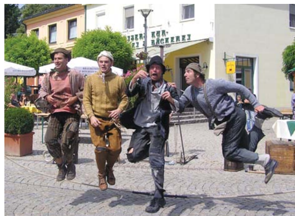
- THE MUDJUMPING - 50 minuta; ČETVRTAK, 19. jula u 21 sat, Gradski trg.