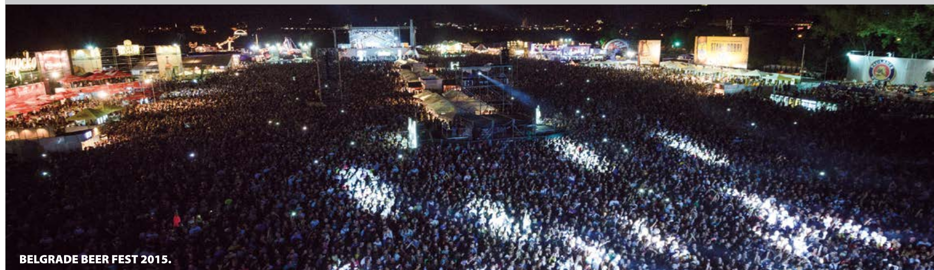
BELGRADE BEER FEST 2015.

Trajanje: 7 dana. Posetilaca: 400.000. Inostranih gostiju: preko 15% iz 70 država sveta. Imidž: Sziget festival je jedan od najvećih multikulturalnih događaja u Evropi koji se prvi put održao 1993. godine, a ove 2017. godine, proslavlja svoje 25. izdanje. Tokom godina nastupe su imala eminentna muzićka imena poput Dejvida Bouvija, Igija Popa, Roberta Planta, Nika Kejva, Rejdiohed, Oejzis, The Cure, Prodigy, Placebo, Franc Ferdinand, Korn, Slayer, Basement Jaxx, Scissor Sisters, Muse i mnogi drugi. Sziget ili „Ostrvo slobode“, može se smatrati nezavisnom državom. To je više festivala u jednom, sa približno 50 programskih prostora i oko 200 događaja dnevno.